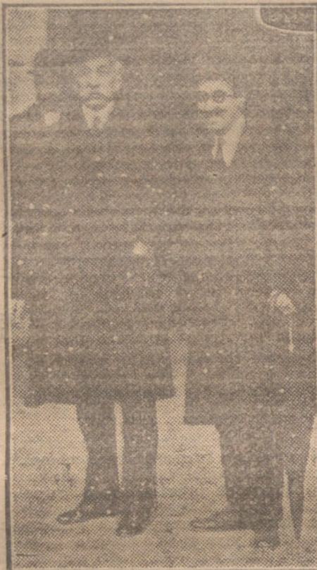
El jefe de los conservadores, Sr. Dato, al salir esta tarde de Palacio, después de ser consultado por S. M.

Terminó ratificando que no habrá modificación alguna en la constitución del Gabinete, pues todos los ministros han sido eficaces colaboradores suyos y a todos estima por igual; no sería justo que en estas condiciones estableciera diferencia alguna, y por otro lado, ello hubiera podido prestarse a la interpretación totalmente equivocada de que la crisis se había planteado con el único propósito de prescindir de alguno de los actuales ministros.