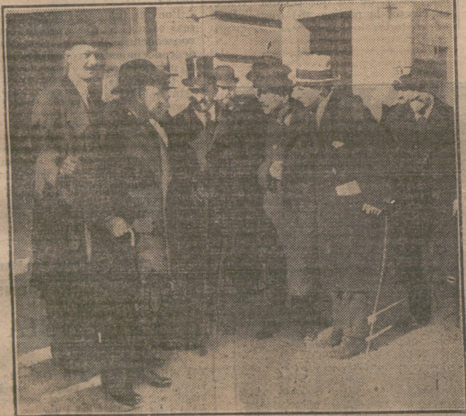
El presidente del Consejo al salir de Palacio, después de presentar al Rey la dimisión de todo el Gobierno.