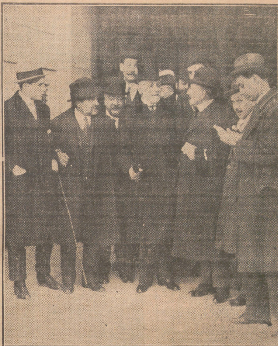
El presidente del Congreso, Sr. Villanueva, al terminar su entrevista con el Rey, conversando con los periodistas a la puerta de Palacio.

Cuando llegó a Palacio el jefe del Gobierno, fué preguntado por los periodistas, pero el presidente excusó toda contestación hasta la salida.