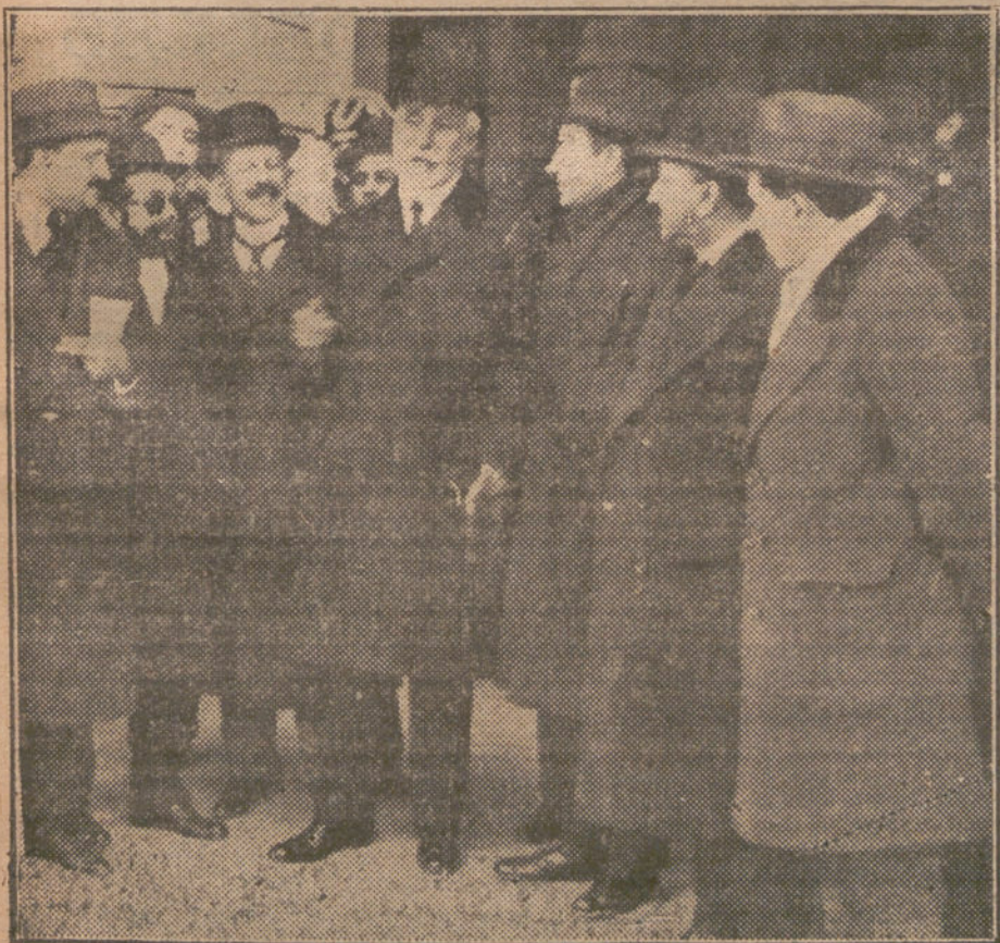
El Sr. Maura al salir de Palacio.

Añadió que había aconsejado la continuidad, tanto en lo que se refiere a la política interior como a la exterior, de la situación actual, por entender que esto es lo que conviene hoy a los altos intereses del país.