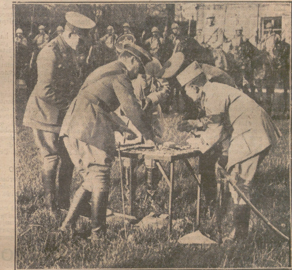
LA LUCHA EN FRANCIA. Oficiales franceses haciendo una distribución de recompensas.

Finalmente, el crítico se sorprende de que haya traducido «bound» por «atado» y de que así resulte que diga el autor traducido: «Cervantes fué embarcado en la galera del Bey y conducido atado á Constantinopla.» También me sorprendió á mí, teniendo en cuenta que «bound for» puede traducirse asimismo: «con destino á», y «por eso precisamente» (estando la traducción