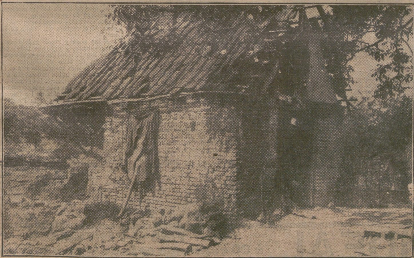
LA LUCHA EN FRANCIA - Caseta para centinelas, instalada en las líneas avanzadas del Somme.