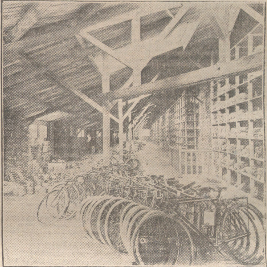
Parque ciclista del Ejército francés, en talado en las proximidades de la línea de fuego de la Champaña.

Hablar de que los ingleses combaten por «vindicar el principio de que las pequeñas naciones no han de ser aplastadas», según manifestara el Sr. Asquith y mister Barcia repite, cuando es lo cierto que por causa del egoísmo inglés, que no acudió a auxiliar a Bél-