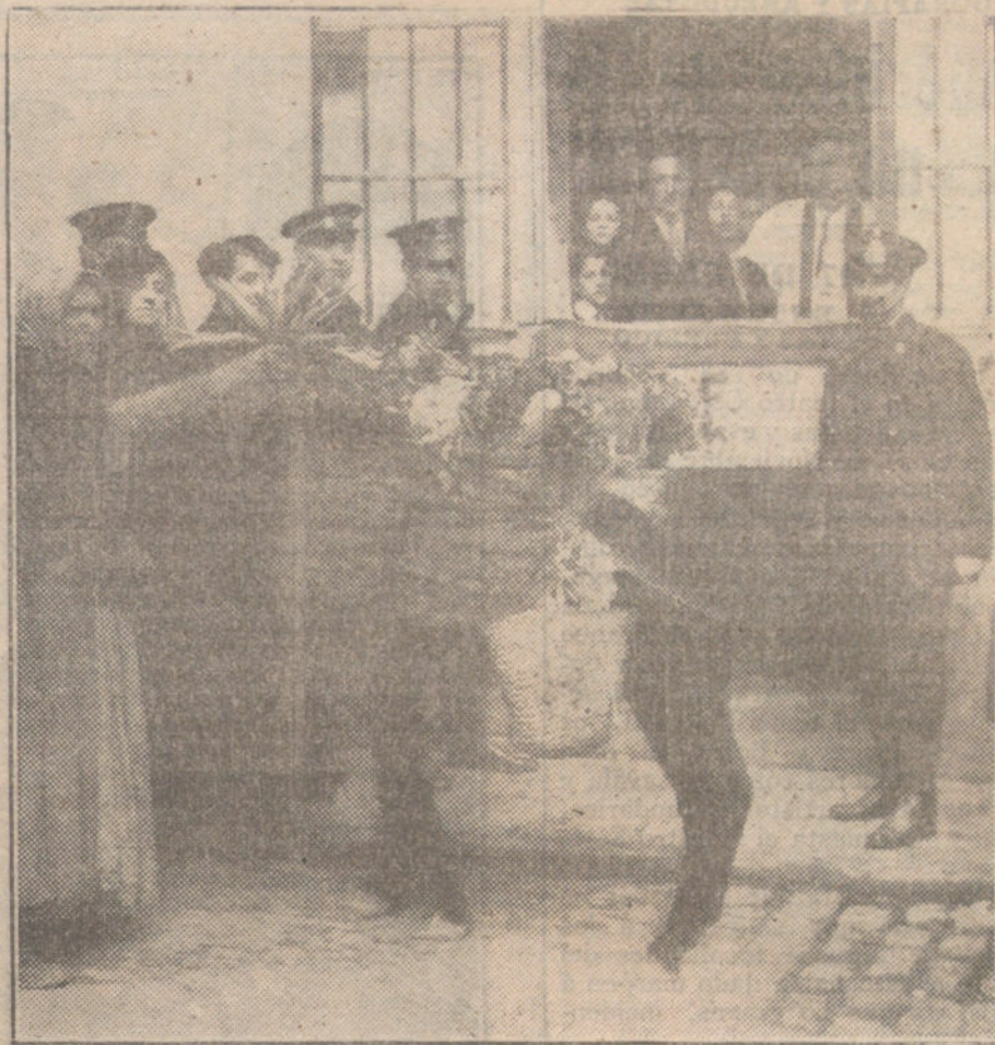
LA FIESTA DE SAN ANTON.—Una de las escenas desarrolladas en la calle de la Farmacia durante la tradicional bendición de la cebada.