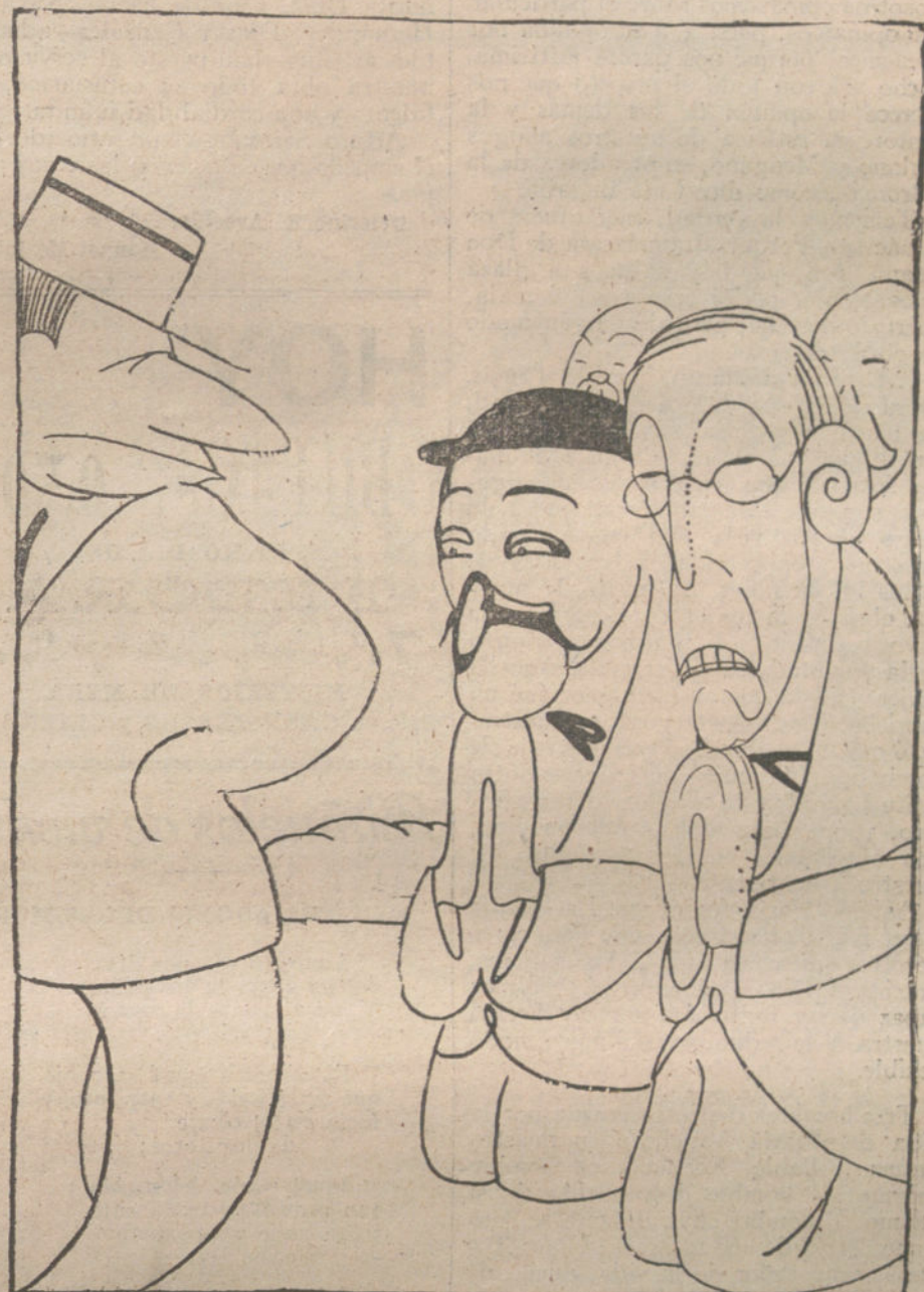
LOS JEFES DE GOBIERNO DE LOS DIFERENTES PAISES AL «SORDAO ROMANO».—Por Dios, Vicente, decídete de una vez, que, preocupada con las tuyas, la opinión no hace caso de nuestras «Notas».

Cuando se siente una tranquilidad inmutable de conciencia, cuando no hay sombra que enturbie ni sospecha que perjudique, el mejor método es dejar hacer y decir, aguantando el ataque con resignación. Precisamente los hombres públicos deben forjarse a golpes de mazo en el yunque de las polémicas, sin esperar de la piedad o el miedo