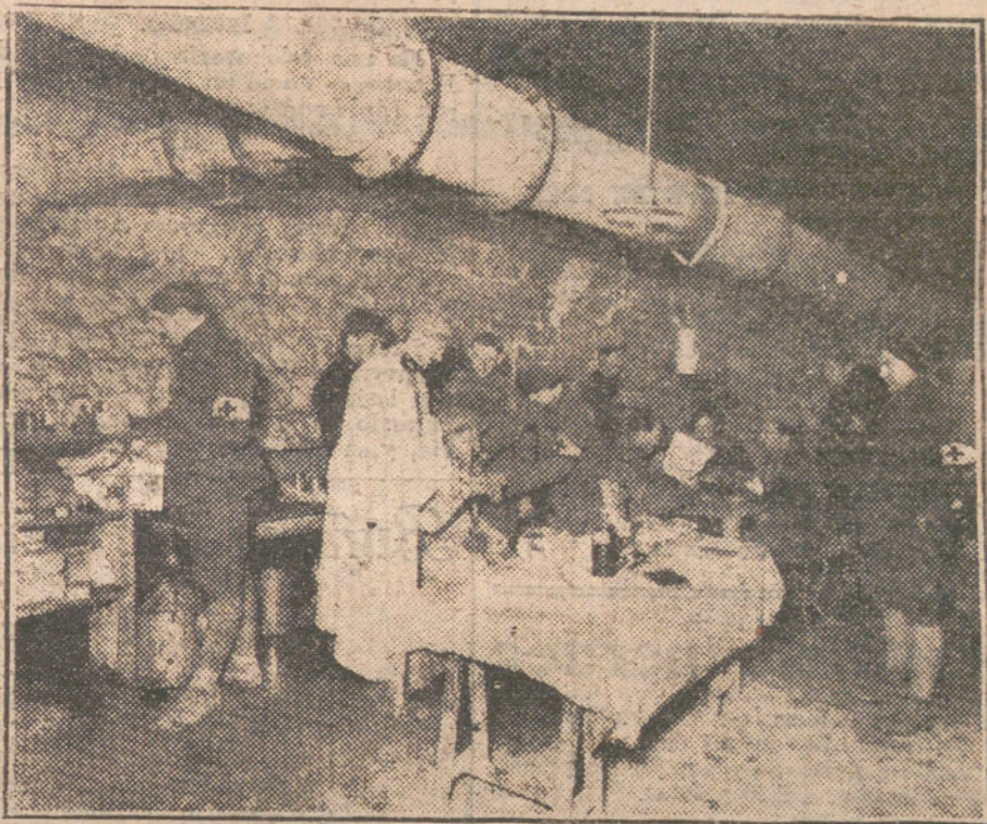
Sanitarios franceses prestando servicio en una ambulancia de las trincheras de Oise

«La Sociedad Altos Hornos de Vizcaya representa el más recio orgullo nacional—escribe desde Bilbao el distinguido cronista—. Sus obreros son un enjambre; las llamas de sus convertidores iluminan las noches con una apariencia de volcán; más del 50 por 100 del humo que ennegrece las casas y que flota sobre la ría, le pertenece por derecho propio; un régimen terriblemente proteccionista la ampara; incontables industrias españolas de ella dependen; sus dividendos son copiosos; su vida es feliz. Sobre todas las otras empresas, Altos Hornos es como una opulenta matrona, de gesto desdenoso. Naturalmente que Altos Hornos no se ha detenido nunca á reflexionar acerca de lo que en otros países hacen las grandes industrias siderúrgicas, que son la más fuerte base del progreso y que de tan íntima manera están ligadas con la vida de las naciones. Altos Hornos tiene su teoría propia acerca de la conveniencia de perfeccionar la labor y acerca de la importancia de que surjan nuevas industrias de derivados del hierro. Con arreglo á estas teorías, el personal de la Empresa se obstina en una labor casi elemental, y las pequeñas industrias, que debían estar subvencionadas por interés egoísta de la Sociedad, luchan con terribles dificultades, no ya para que se les conceda un crédito, sino hasta para obtener, pagando bien y á tocateja, la materia prima que les es necesaria. SOBRE