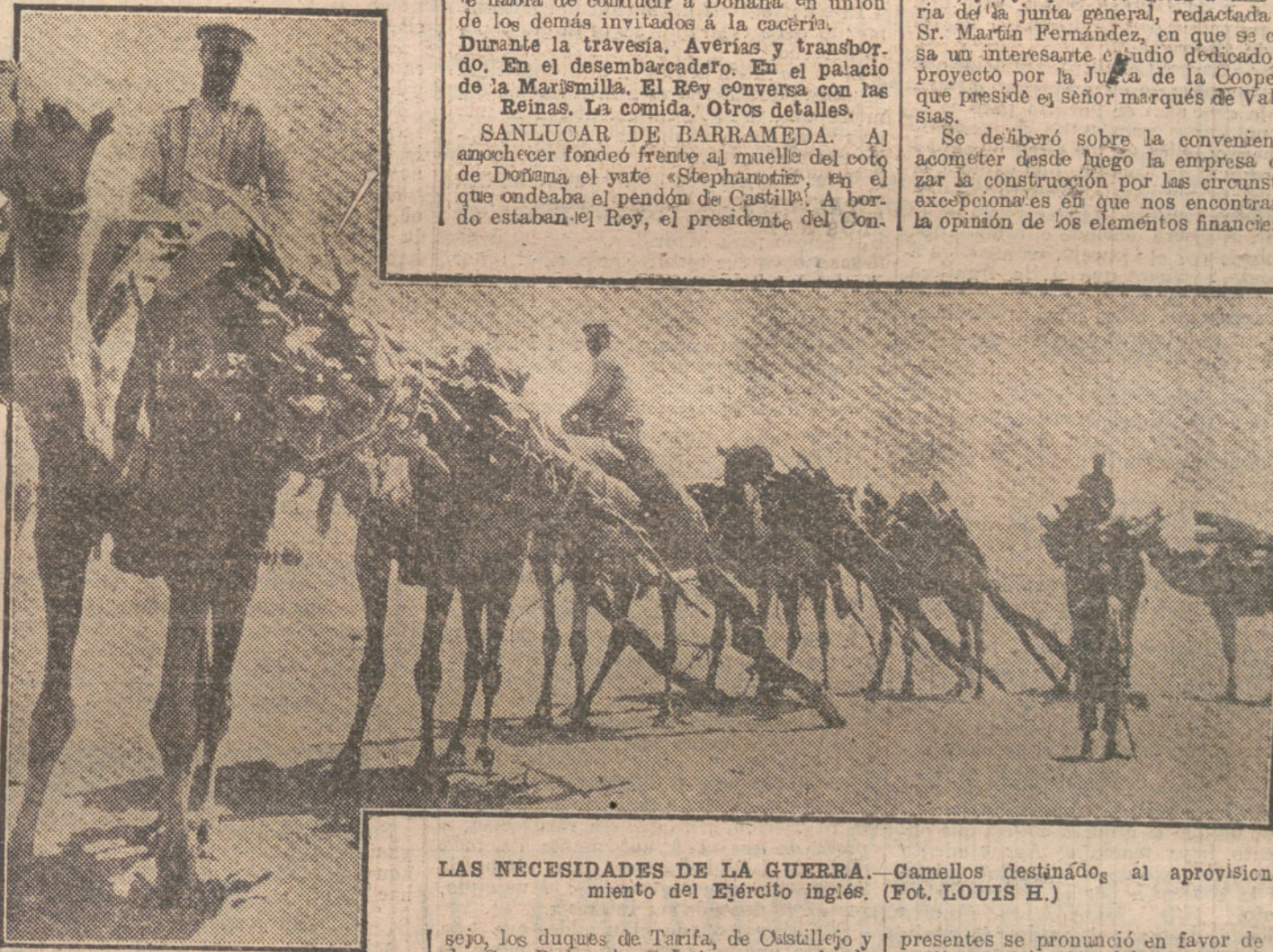
LAS NECESIDADES DE LA GUERRA.—Camellos destinados al aprovisionamiento del Ejército inglés.

Se deliberó sobre la conveniencia de acometer desde luego la empresa o aplazar la construcción por las circunstancias excepcionales en que nos encontramos, y la opinión de los elementos financieros al-