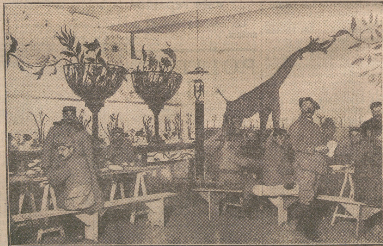
EL HUMORISMO EN LA GUERRA.—Un comedor del grupo automovilista del Ejército del Oise, decorado por las tropas.

Concurridísima la Exposición de carteles para el «Blanco y Negro». Decididamente, esto de los concursos es una gran cosa; no se si despierta la emulación o si alienta el arte; pero el incó-