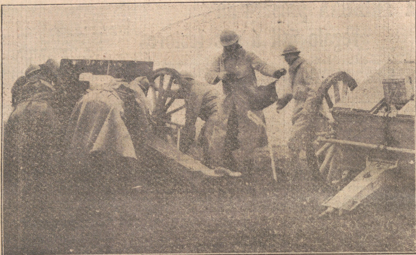
LAS ARMAS DE GUERRA.—Instalación de una batería de campaña en una nueva posición francesa.