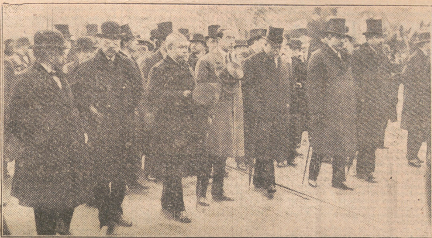
LA MUERTE DE FERRANT.—Presidencia del duelo en el entierro del insigne pintor, verificado ayer tarde.

En audiencia al secretario de Estado alemán, Zimmermann, al ministro de Negocios Extranjeros, Czernin, y el presidente del Consejo de ministros, conde Tisza.