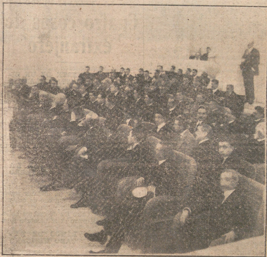
Aspecto del salón de actos del Centro del Ejército y de la Armada durante la celebración de la Asamblea del Tiro Nacional, verificada anoche

campaña, que nosotros, sin ambages ni rodeos, calificamos de exagerada, representan, aunque lo niegue «El Imparcial», una importante fuerza de opinión. «España Nueva» arrastra una gran masa republicana, la más intransigente. «El Debate» tiene vida próspera é independiente, y es a la vez el periódico de la considerable opinión católica, estando apoyado resueltamente por los jóvenes propagandistas católicos. «La Nación» vino a vida a la sombra de los Comités neutralistas, y con elementos propios, y «La Acción», por último, es el órgano decidido del partido maurista.