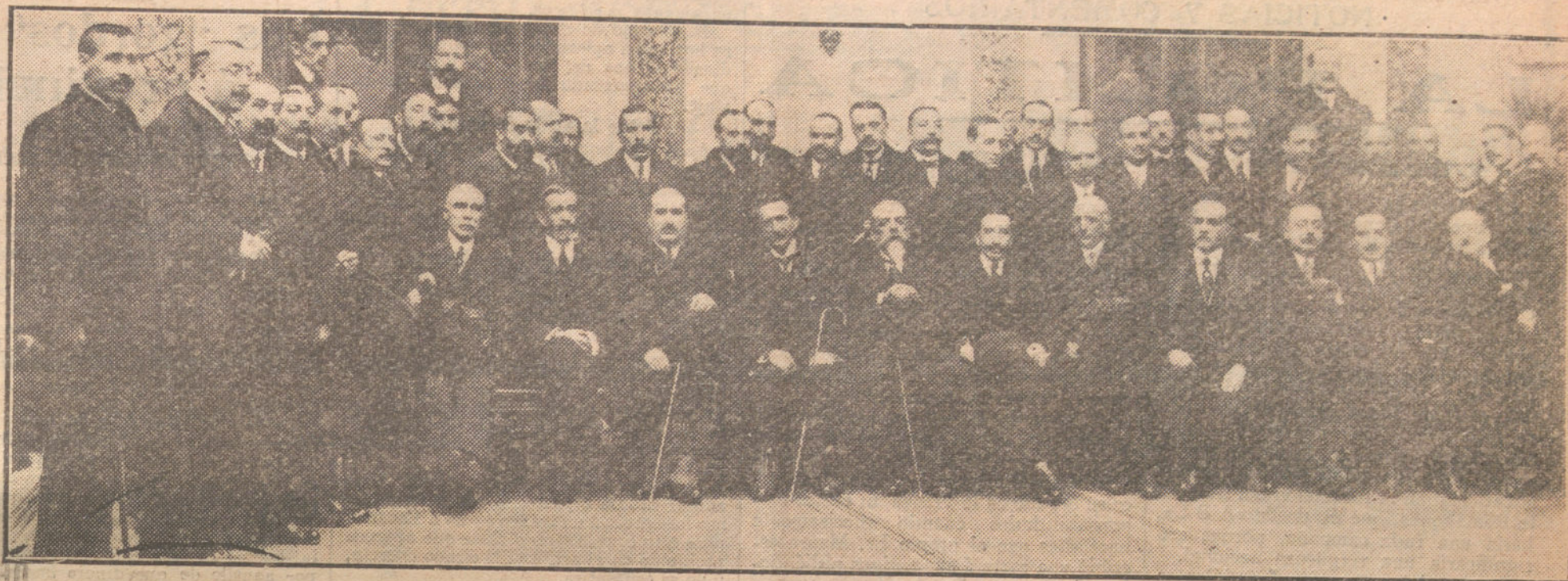
Los alcaldes de las principales capitales españolas, reunidos esta mañana en el Ayuntamiento para acordar la forma en que tienen que hacer entrega a S. M. del álbum regalado como homenaje.