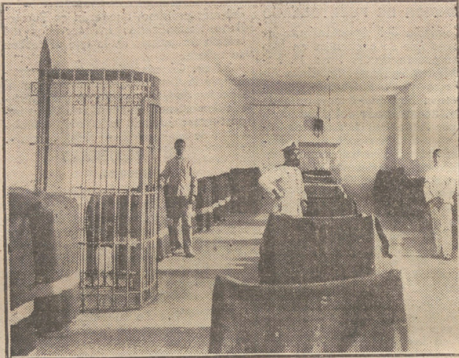
Aspecto de uno de los dormitorios.

El Instituto Criminológico y el Reformatorio de Alcalá.—La mancha gris.—La escuela y el taller.—La bandera española.—El escultor.—El Benjamin de la casa.—Las dos madres