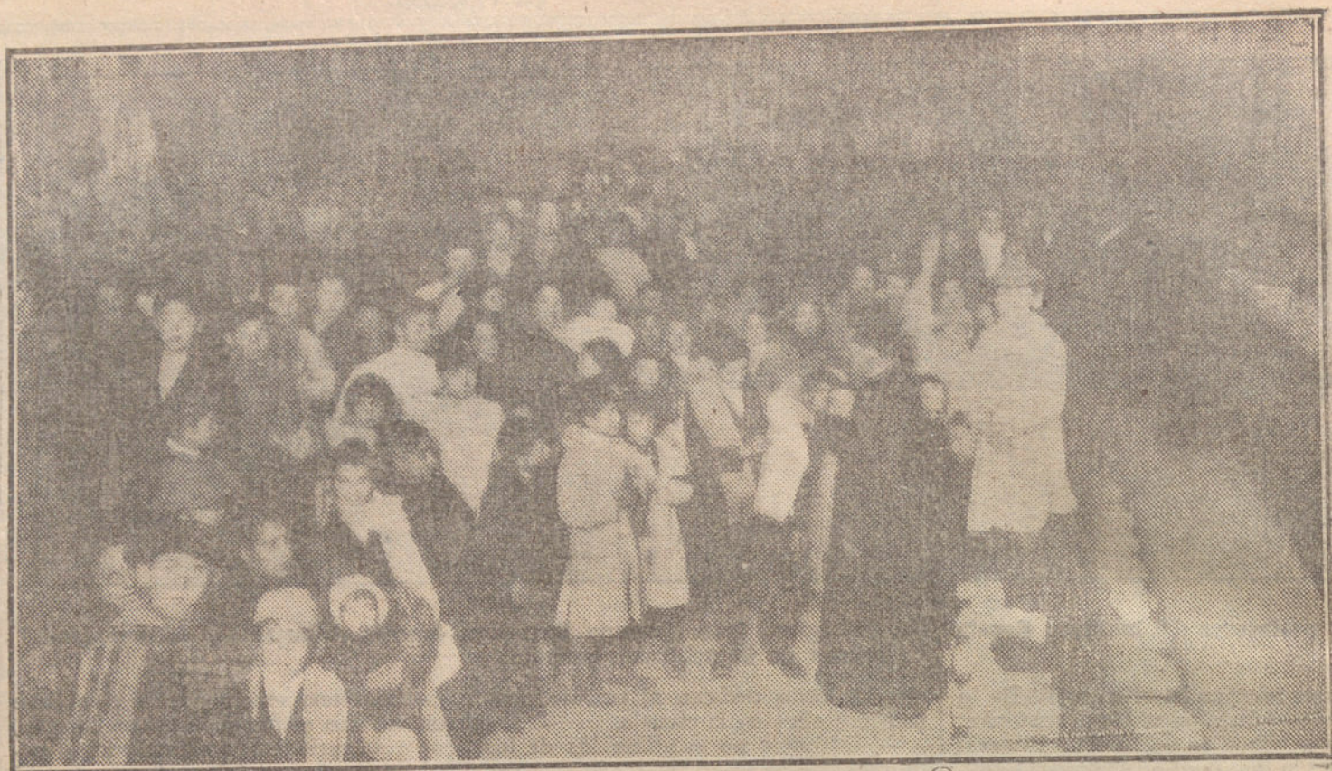
Aspecto de la feria que anualmente celebran los Salesianos á favor de los alumnos pobres.

Melilla: Infantería: Regimiento de San Fernando, 759; Cerinola, 602; Melilla, 996; África, 452; batallón Cazadores de Segorbe, 371; Chielana, 388; Talavera, 382. Caballería: Regimiento de Alcantara, 281; Taxdir, 145; Depósito de ganado, 26. Artillería: Regimiento de Montaña, 630; Comandancia, 199; Parque móvil, 58. Grupo mon-