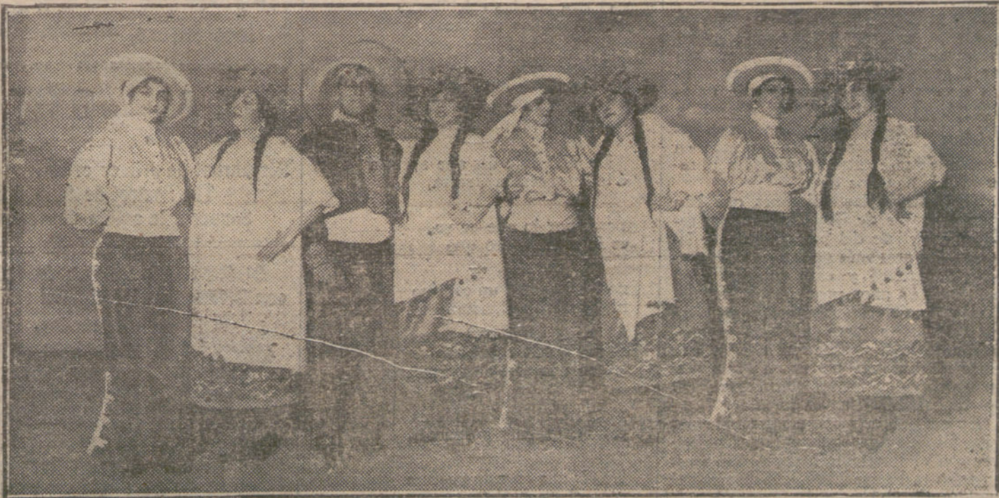
Una escena de «El millón de pesos», obra estrenada anoche en el teatro Cómico.

CADIZ. Esta madrugada fué naufragado, en el arrecife de piedra de San ti Petri, un faluche de pesca, de la matrícula de San Fernando.