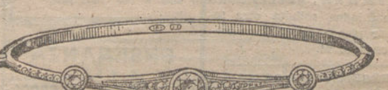
Número 16.—Tres brillantes y diamantes. Pesetas 750.