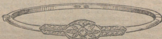
Número 6.—Un brillante y diamantes. Pesetas 275.