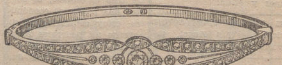
Número 15.—Siete brillantes y diamantes. Pesetas 650.