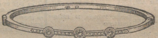
Número 4.—Tres brillantes y diamantes. Pesetas 225.