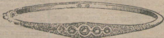
Número 9.—Cinco brillantes y diamantes. Pesetas 350.