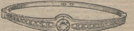
Número 18.—Un brillante y diamantes. Pesetas 1.000.