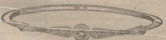
Número 8.—Un brillante y diamantes. Pesetas 325.