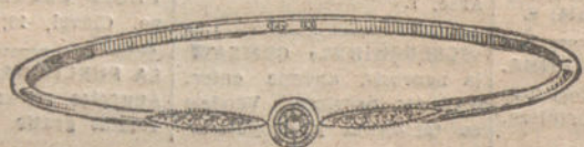
Número 1.—Un brillante y un diamante. Pesetas 150.