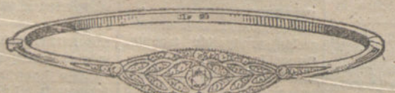
Número 7.—Tres brillantes y diamantes. Pesetas 300.