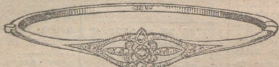
Número 5.—Un brillante y diamantes. Pesetas 250.