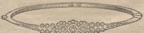
Número 11.—Tres brillantes y diamantes. Pesetas 450.