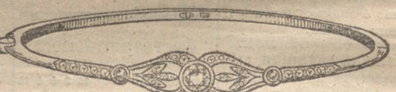
Número 12.—Tres brillantes y diamantes. Pesetas 500.