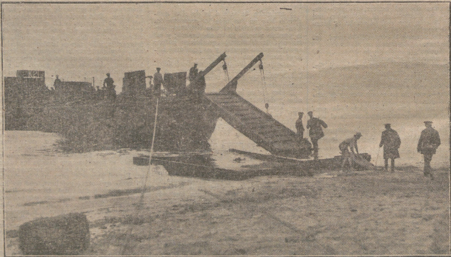
Barcaza destinada al aprovisionamiento de los buques de guerra ingleses, prestando servicio en una playa belga.

En Sanidad ascenderán el mes próximo a comenzar por la antigüedad de 30 de Junio de 1913; con la de Septiembre del 12 ascenderán en Veterinaria; con las de Julio y Junio de dicho