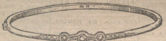
Número 3.—Tres brillantes y diamantes. Pesetas 200.