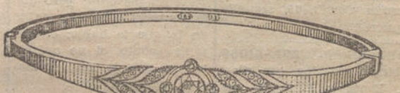
Número 14.—Cinco brillantes y diamantes. Pesetas 600.