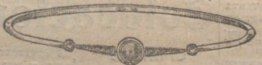
Número 2.—Dos brillantes, perla y diamantes. Pesetas 175.