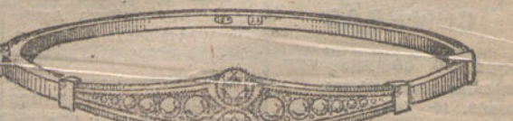
Número 17.—Diez y seis brillantes. Pesetas 800.