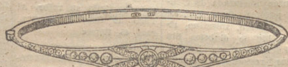
Número 10.—Nueve brillantes y diamantes. Pesetas 400.