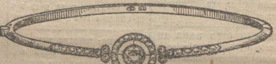
Número 13.—Siete brillantes y diamantes. Pesetas 550.