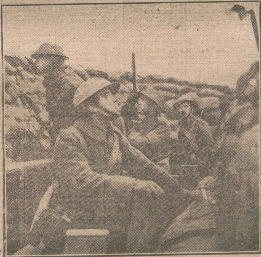
LA VIDA EN CAMPAÑA.—Soldados franceses haciendo observaciones por un periscopio de trinchera.

Ya no habrá que remontar el canal y acercarse a las costas británicas, para sufrir allí las molestias de inspecciones y requisas vejatorias. Se podrá ir di-