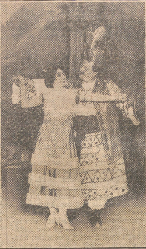
Dos escenas de la obra «El rajá de Bengala», estrenada anoche en el teatro de Apolo.