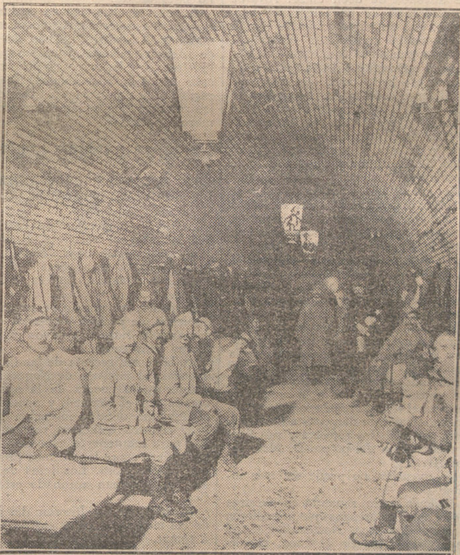
LA VIDA BAJO TIERRA.—Soldados franceses en uno de los subterráneos de la ciudadela de Verdun.

En los hogares españoles, los momentos que atravesamos son de una gran inquietud. Las madres españolas presienten que la garra extranjera viene, codiciosa de sangre, á arrancarle á sus hijos para que mueran por una cau-