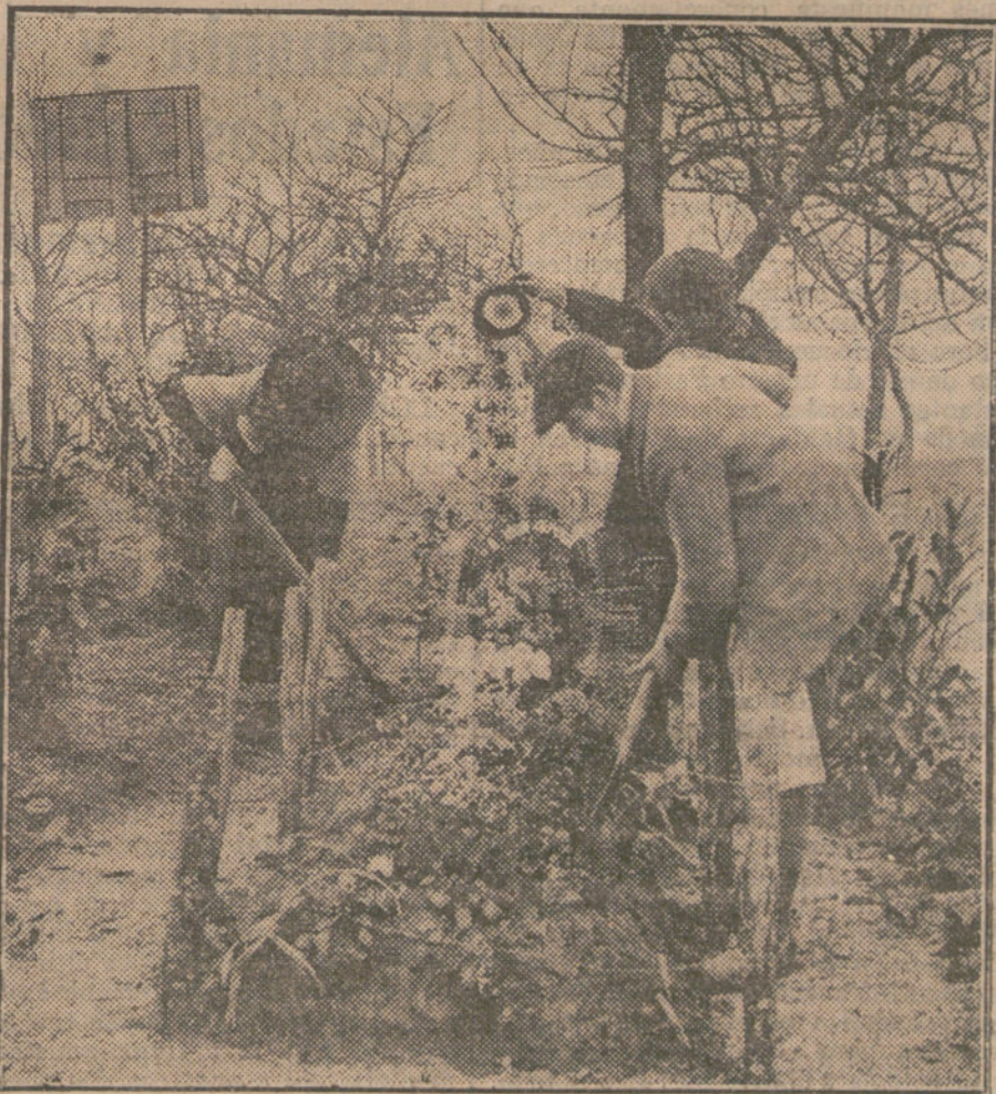
LAS VICTIMAS DE LA GUERRA.—Aldeanos franceses arreglando las tumbas de los soldados sacrificados en la lucha.

¿Puede un periodista español leer con tranquilidad estos juicios sin que la pluma le dicte los más duros comentarios? No; en España nos dividimos desde ahora en neutralistas y en intervencionistas. Las palabras «francófilo» y «germanófilo» no tienen ya justificación en la Prensa española en la literatura de la guerra europea; son esas filias y fobias demasiado poco para discutir este hondo problema, en que se ventila la existencia de nuestra nacionalidad. Nuestro artículo de anoche, que tanto efecto ha causado a la opinión, y por el que recibimos de todas partes las más calurosas felicitaciones, no estaba inspirado en ninguna clase de simpatías, sino en el amor a la Patria; es el tributo leal y desinteresado, de dolor que un hijo