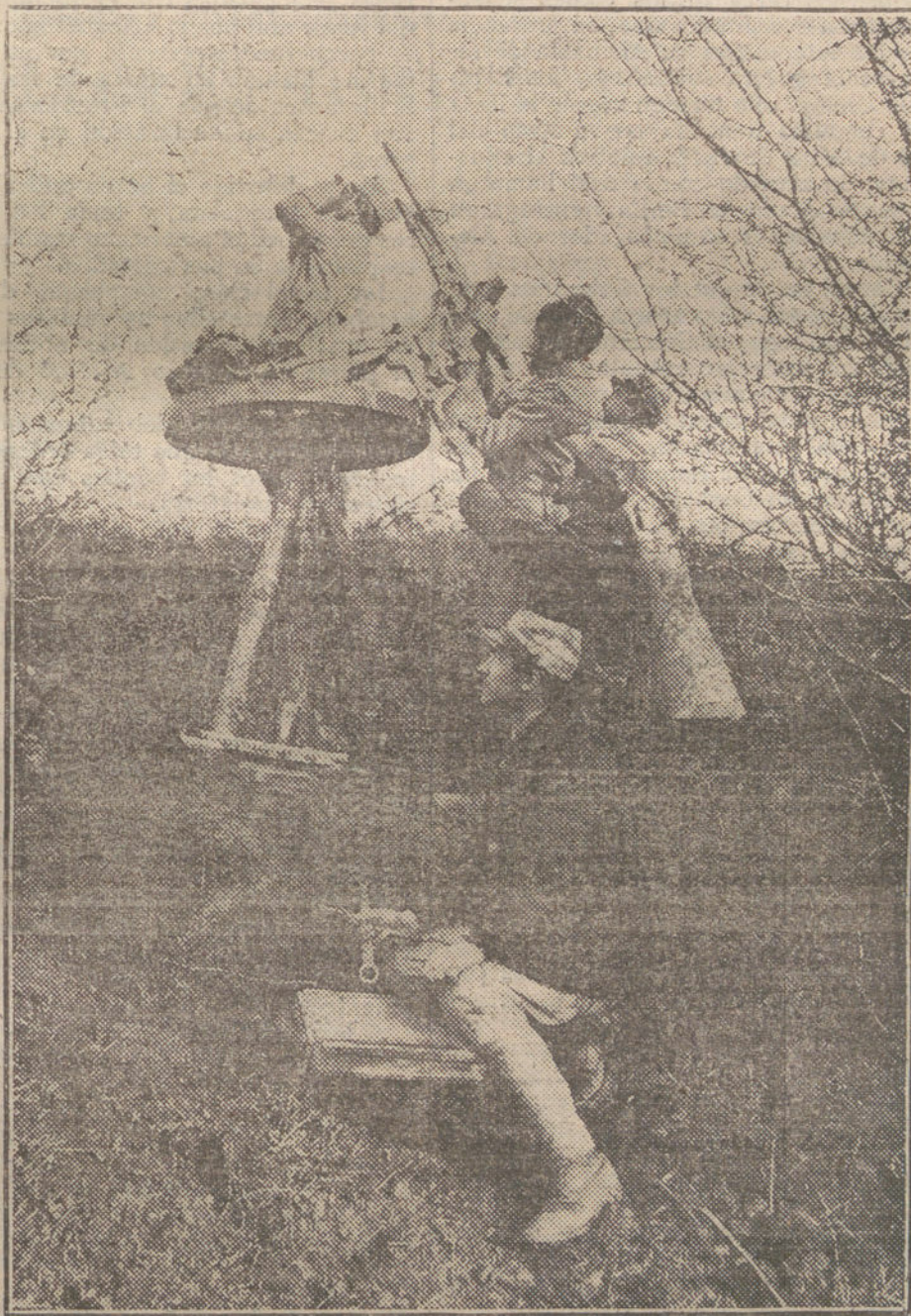
Puesto de observación, con cañones contra aeroplanos, en el frente francés.

beral» que en España no hay nadie partidario de la guerra; pero pide al Gobierno resoluciones enérgicas, violentas y decisivas para secundar los propósitos bélicos de Wilson apoderándose de los barcos alemanes refugiados en la hidalga hospitalidad de nuestros puertos y limitando zonas en las fronteras, donde no puedan establecerse los súbditos alemanes que viven en España confiados en la neutralidad del país.