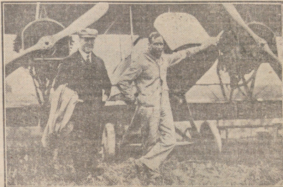
El primer aeroplano usado para el reparto del correo, que conduce diariamente números del «New York World» de Nueva York á Washington en tres horas y cuatro minutos.

Hay «cambios naturales», al decir de los toreros, y «cambios de rodi-