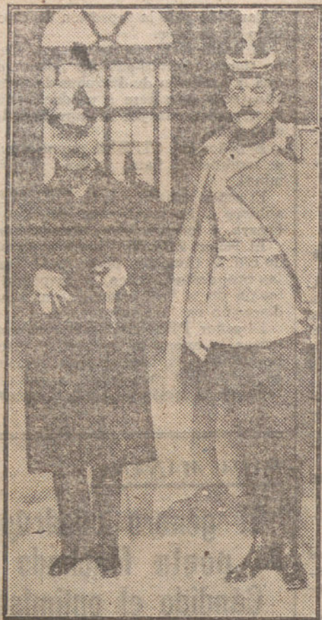
El nuevo ministro saliendo de Palacio.