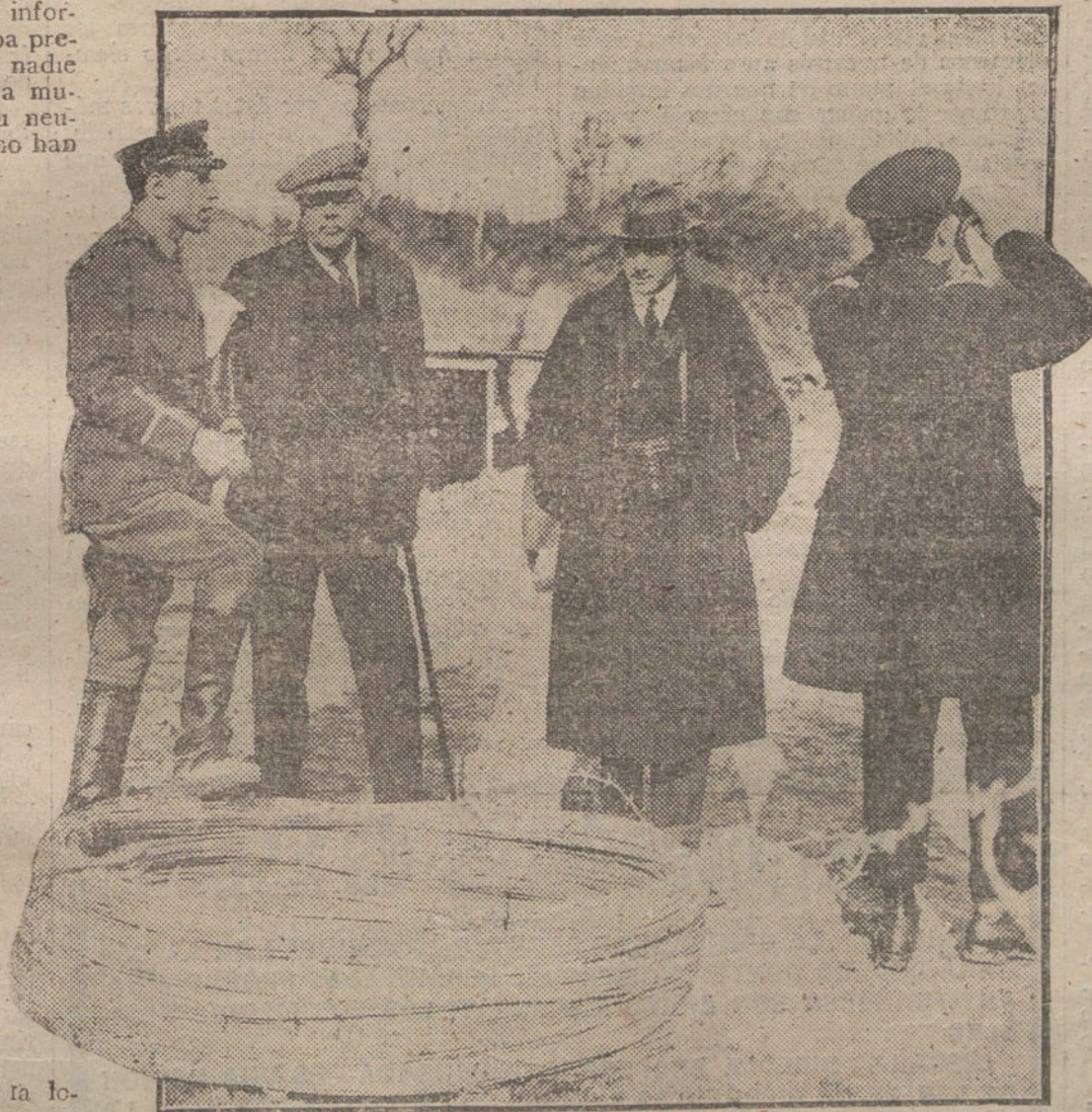
Representantes del Parlamento inglés durante una visita á las primeras líneas del frente de Flandes.

Norteamérica puede hacer la guerra contra Alemania con unos cuantos millones, sin riesgo grande para la integridad de su solar, y desde luego sin que su acción influya en contra de los intereses militares alemanes. Con todo, Norteamérica no podría ser forzada á enviar un importante cuerpo expedicionario á los campos de batalla europeos. Norteamérica tiene la potencia y la fuerza necesarias frente á la Entente para concurrir con entera libertad de su exclusiva conveniencia, limitando el alcance de su colaboración en la guerra. España, no; España tendría que hacer todo lo que la Entente le exigiese. España sería un juguete de Inglaterra y de Francia, no sólo en la guerra, sino después de