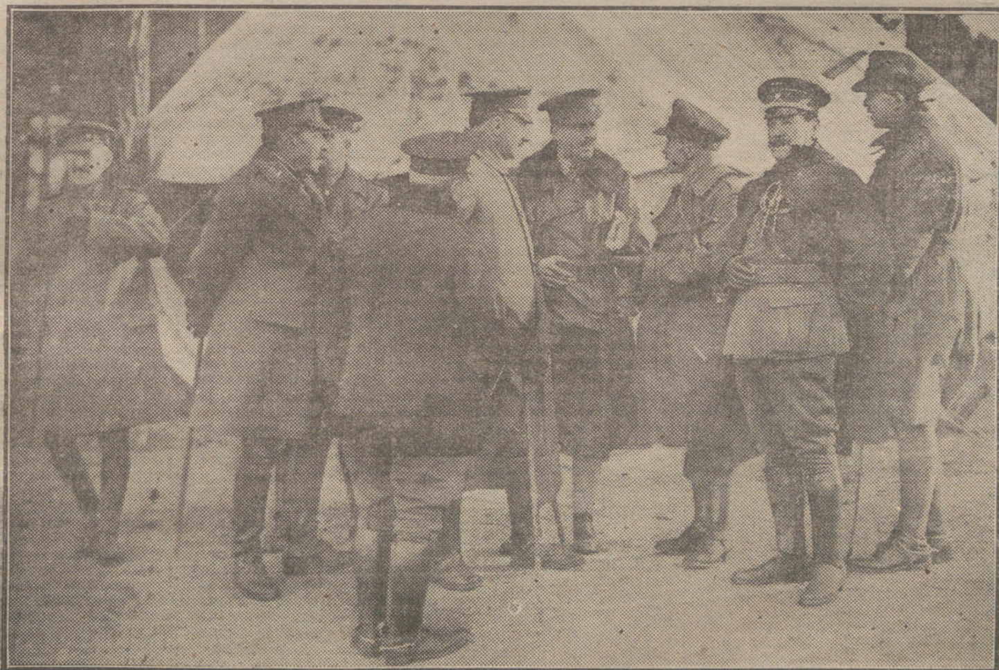
La Comisión de militares españoles que visitó el frente francés, conversando con los oficiales ingleses en un campamento del Norte de Francia.

El acto tendrá lugar el día 25 del actual, y oportunamente se anunciará la hora y local en que haya de tener lugar.