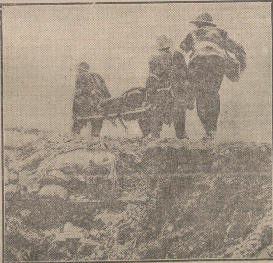
A ESO QUIEREN ARRASTRARNOS LOS INTERVENCIONISTAS