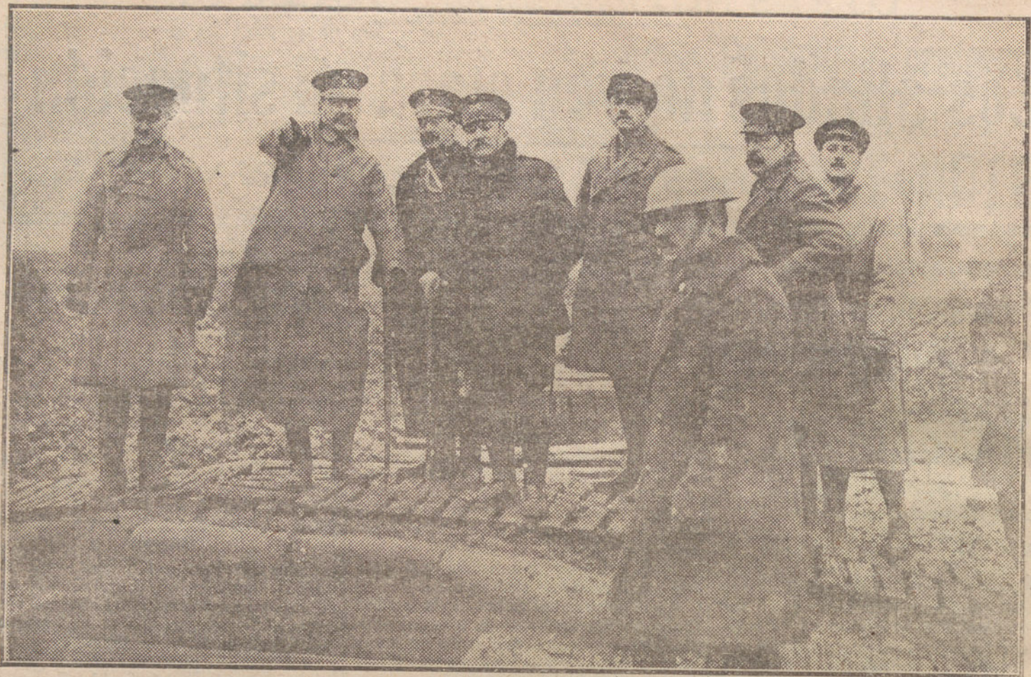
Los generales Sres. Primo de Rivera, Anido y Aranzaz visitando las primeras líneas del frente francés.

España, cuya juventud nace pujante de vida y llena de optimismo, necesita de libros como los de Marden, y el Sr. Burell, como ministro de Instrucción pública, haría una obra patriótica declarando obligatorias en la escuela las obras de este gran educador de la juventud, que se llama Marden.