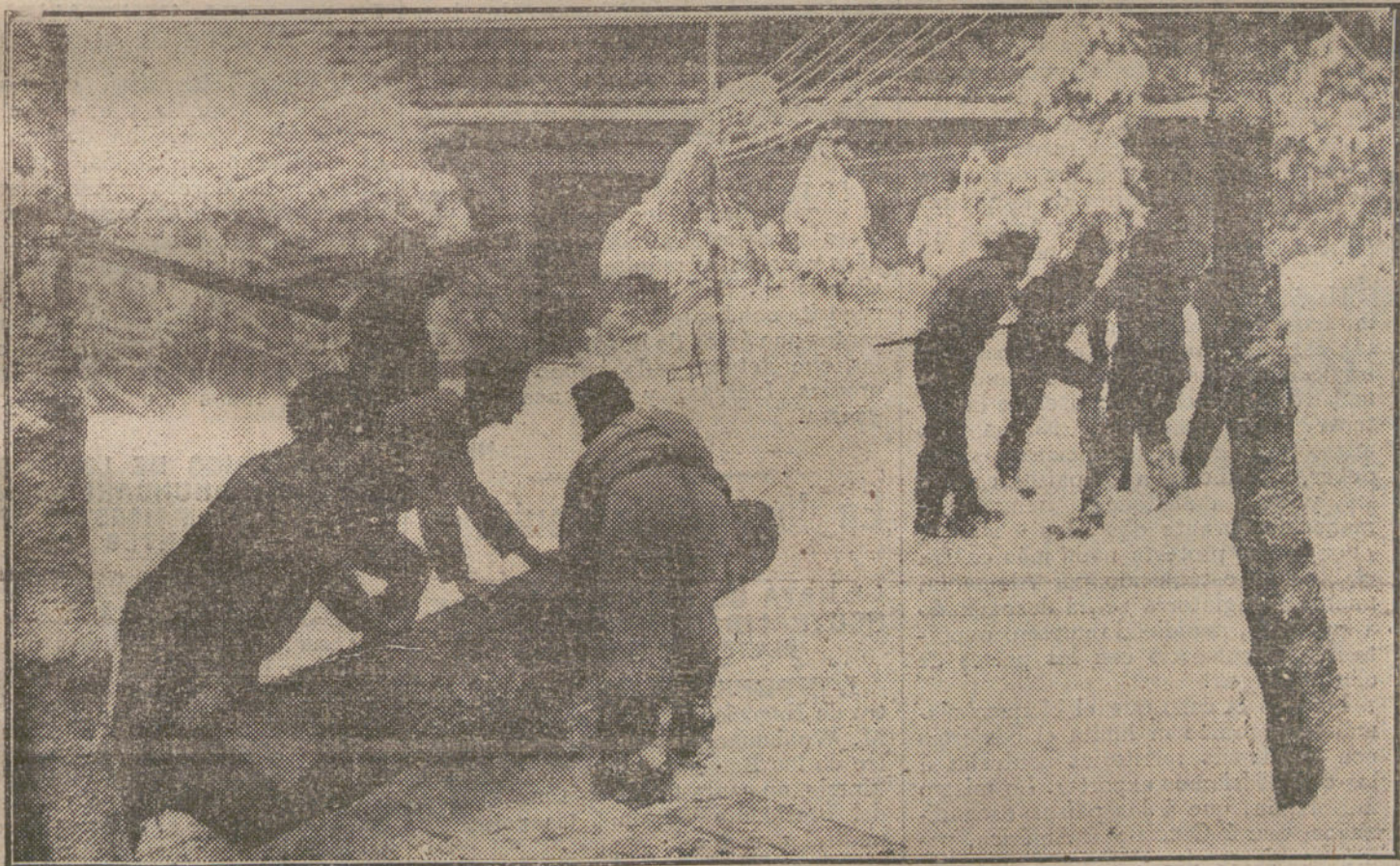
LA GUERRA EN INVIERNO.—Soldados transportando troncos y árboles por un bosque nevado.

la justicia. Pero no hubo entonces mano de ninguno que buscara una lanza para defender á vuesa merced, ni voz que se alzase, como se alzó la de vuesa merced tantas veces, gritando: «¡Alto! ¡Téngase todos, si todos quieren quedar con vida!»