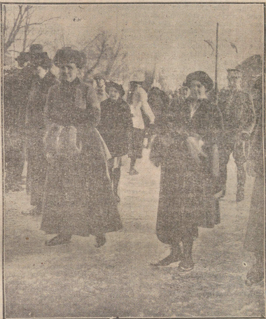
LA FIESTA DE LA NIEVE EN HOLANDA.—La Reina Guillermina y su hija la Princesa Juliana, patinando en un canal, durante las fiestas que todos los años se celebran al congelarse el agua de los canales.

»Recuerde que los caballeros andantes que ahora pelean vieron tranquilos la desigual contienda con el enemigo gigantesco, y, cruzados de brazos, se movieron de vuesa merced. Y los unos dicen que tienen armas poderosas y que por su derecho batallan, y los otros cuentan que combaten por la libertad y por