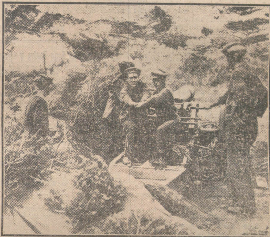
LA LUCHA EN FLANDES.—Marinos ingleses montando un cañón en un paraje de la costa belga.

Contra el Raisuli había ya una predisposición rencorosa. Y se le ha combatido después con demasiada saña. Porque todos sabíamos que el Raisuli no podía comprometerse a otra cosa que garantizar el paso por el Fondak y evitar las agresiones de los kabilanos. Y esto lo cumplía bien. Estaba restablecido el tránsito por los caminos de Tánger y Larache, y nuestras posiciones no sufrían ya el constante