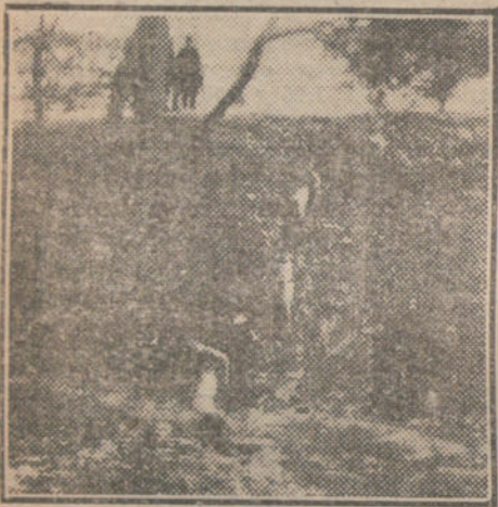
Momento difícil del «Cross Country» del domingo.

He visto el rostro de Prat. Antes de la carrera, cuando, algo nervioso, esperaba impaciente la orden de partir a la conquista del premio regio, su palidez era aterradora. Al mirarle me