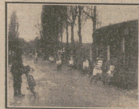
«CROSS COUNTRY» DEL DOMINGO. Paso de los corredores por la Moncloa.

Consistirá el homenaje en una fiesta deportista que seguramente organizarán el Athletic y el importante semanario «España Sportiva» (organi-