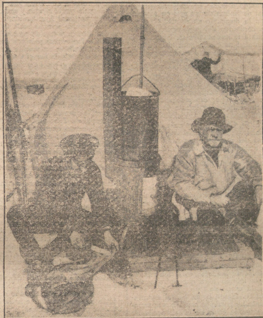
LA EXPEDICION SHAKLETON AL POLO SUR.—El fotógrafo de la expedición, Mr. Hurley, y el teniente Shackleton, a la derecha, delante de su tienda de campaña, calentándose en una estufa de petróleo.

Todos los días publica la Prensa telegramas angustiosos sobre el particular, y al lado de esas quejas amargas que llegan de provincias aparecen