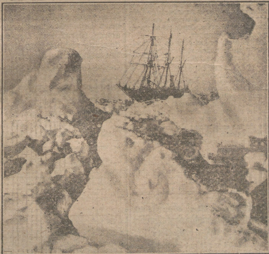
LA EXPEDICION SHAKLETON AL POLO SUR.—Las primeras fotografías publicadas de esta expedición, cuyos supervivientes acaban de llegar a Australia. El grabado muestra un campo de hielo en el que, grandes bloques, pesando más de cincuenta toneladas, están mezclados en indescriptible confusión.

otros despachos diciendo que los navieros tienen amarrados sus buques en Bilbao, seguramente en espera de agravar más el conflicto de las subsistencias.