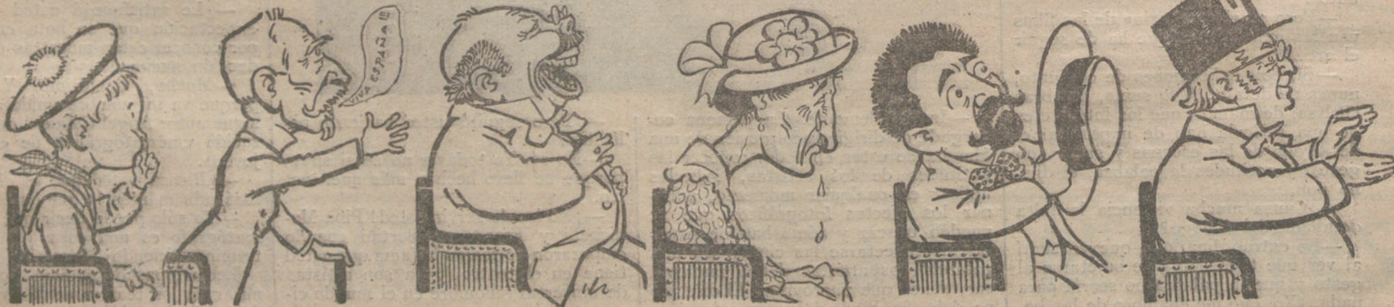
Las películas instructivas.