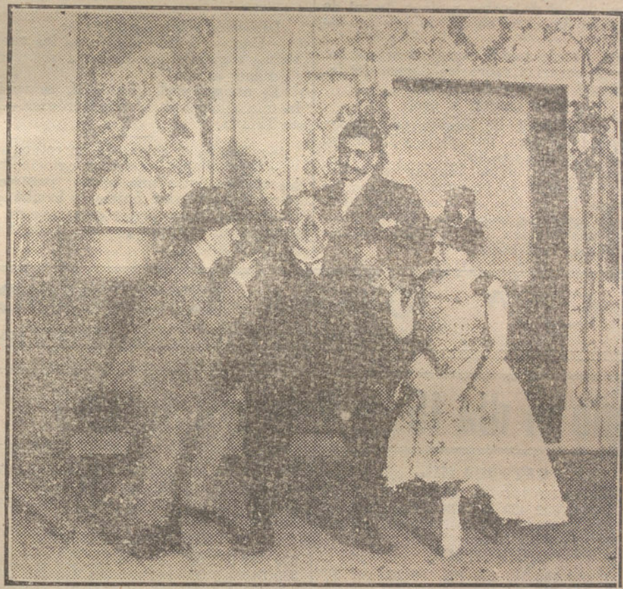
Una escena de «Mantequilla de Soria», obra que se estrena esta noche en el teatro de Apolo.

dad parece haber hecho abdicación de su espíritu ó ideal. Lo que no son afirmaciones concretas, se disimula con un pacifismo extraño, más favorable á los imperios centrales que á la causa de los aliados.