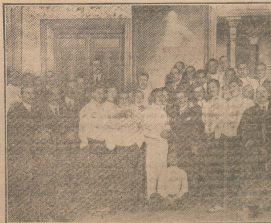
Alumnos del maestro Carbonell que tomaron parte en la fiesta de agnina verificada anoche.