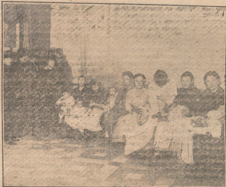
Damas del Comité femenino de Higiene popular, examinando á los niños presentados en el Concurso organizado por dicho Comité en el distrito de la Latina.

Nuestros temores nacen de que los navieros propietarios de los barcos bilbaínos se crean también propietarios de la vida de los tripulantes y que al hipotecar el material marítimo vayan más allá de su conciencia, exponiendo á una muerte indudable á súbditos españoles. Contra eso nos levantamos, no sólo nosotros, sino el propio «Liberal»,