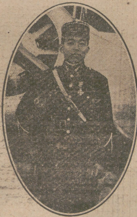
El teniente chino Tsu, aviador que presta sus servicios con gran heroísmo en el Ejército francés.