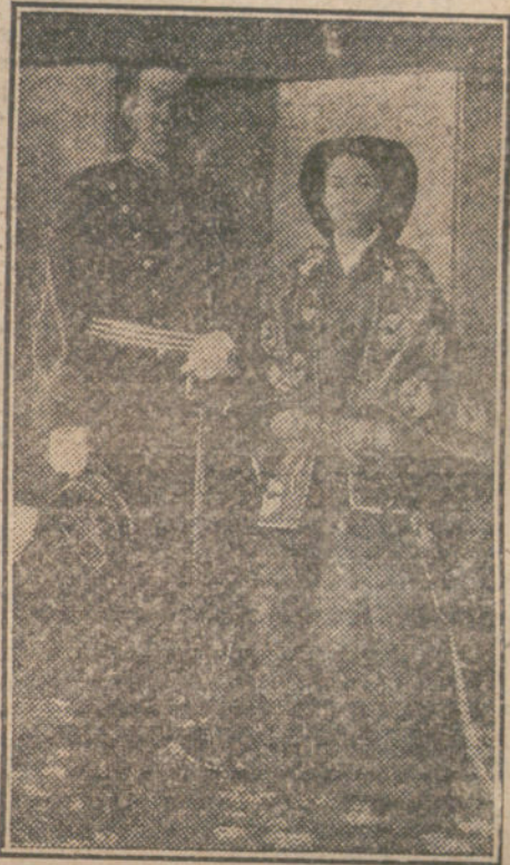
El Príncipe y la Princesa Oyoma, nuevos Emperadores de Mandchuria.

El torete, en su huida, penetró en la Aduana, en donde los soldados que mon- taban la guardia en la Tesorería de Ha- cienda le sujetaron.