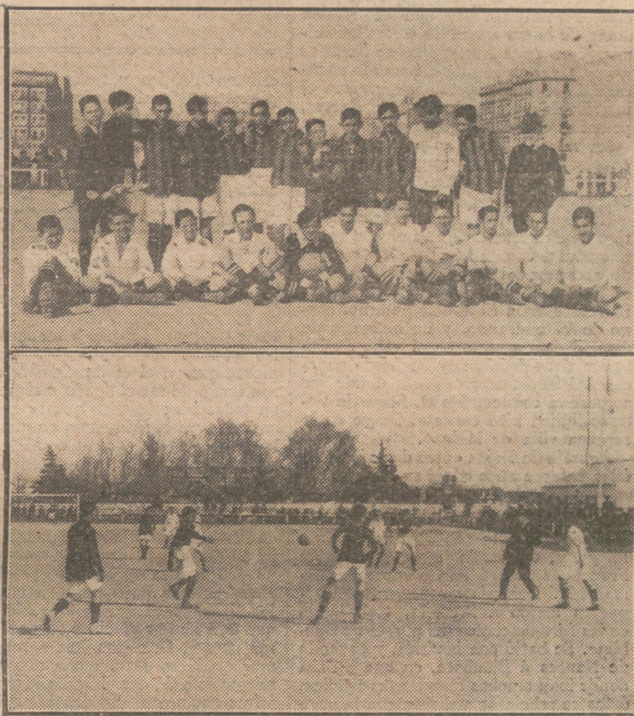
EL PARTIDO INFANTIL FOOT-BALL.—Los equipos Madrid F. O. y Recreativo Español, que jugaron ayer tarde, ganando el primero. Un momento interesante.