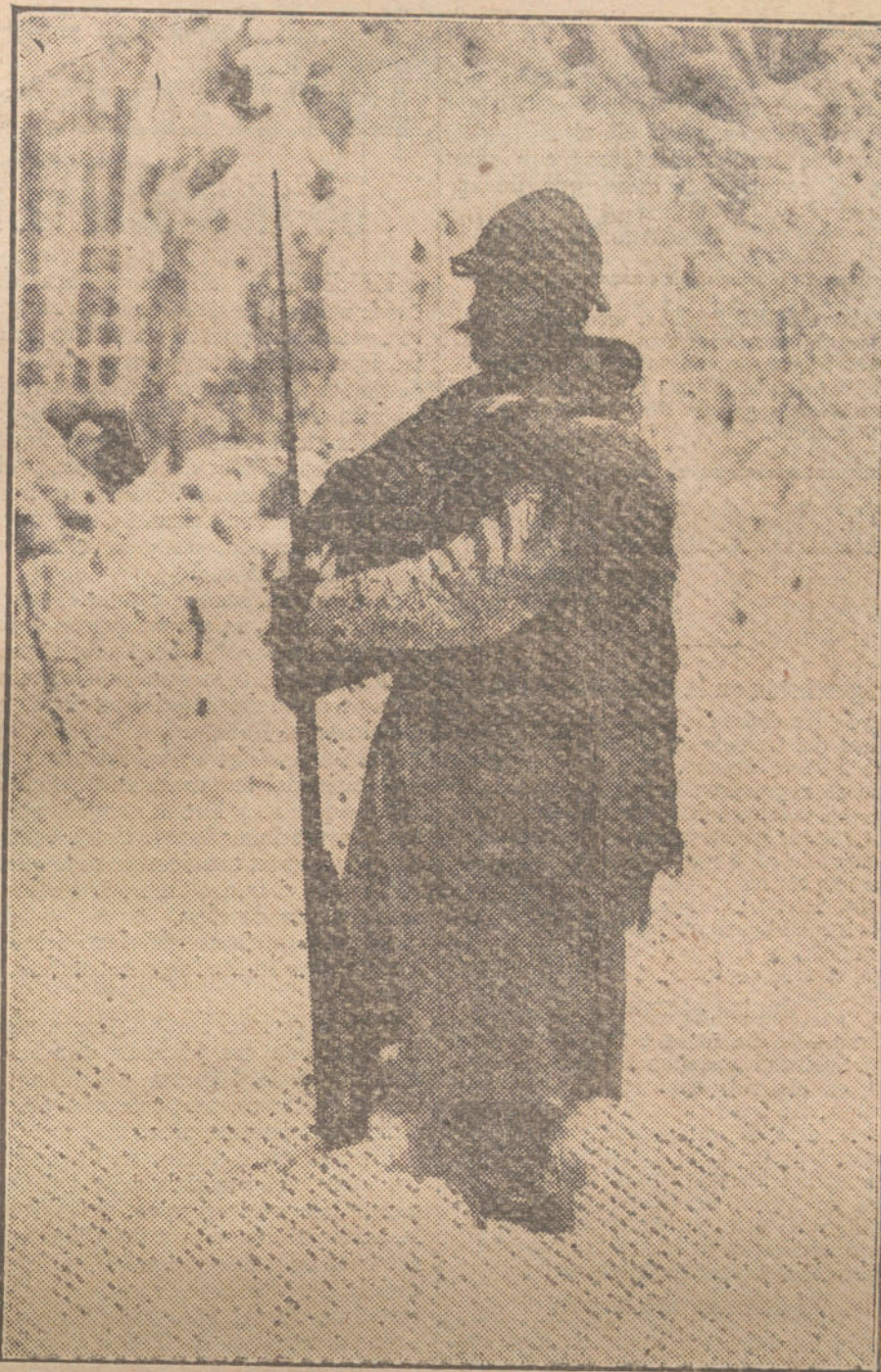
LA LUCHA EN INVIERNO.—Centinela en una de las avanzadas de los Vosgos.

Los maestros de los Liceos de París y colegios preparan la organización del trabajo agrícola, por escolares, así como el empleo, para fines agrícolas, los