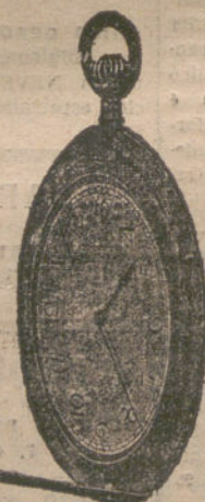
Número 6.358. Ultraplano, abierto.

Proveedor de la Cooperativa del Ministerio de la Guerra