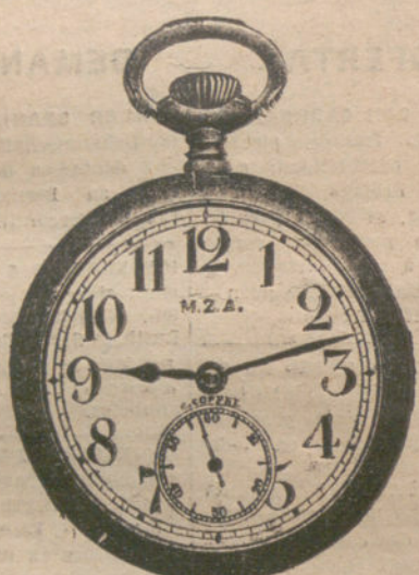
Número 6.319.—Pesetas 175. Altura normal.

Relojes M. Z. A., de alta precisión de Oro de ley