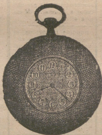
Número 6.353.—Pesetas 300. Ultraplano, forma Imperio.