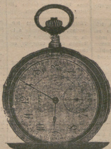
Número 6.358.—Pesetas 400. Ultraplano.