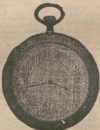
Número 6.352.—Pesetas 300. Ultraplano