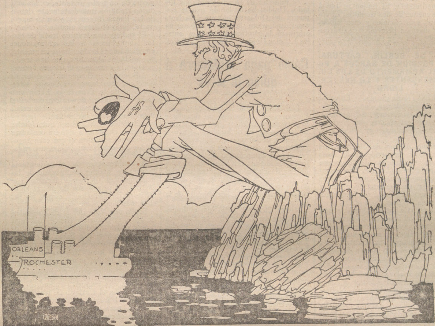
«El «Tío» que á la mar—se va á lavar los pies—que lleve cuidadito—no le pique un pez.»

En Rumania, las baterías de howitzer rumanas destruyeron las obras fuertemente protegidas de Cotelung y el puesto de observación de Vanesul, y dispersaron una columna enemiga, que, avanzando sobre la nieve, trataba de aproximarse á las trincheras que ocupaban al Oeste de Vadini los maltrechos restos del Ejército rumano.