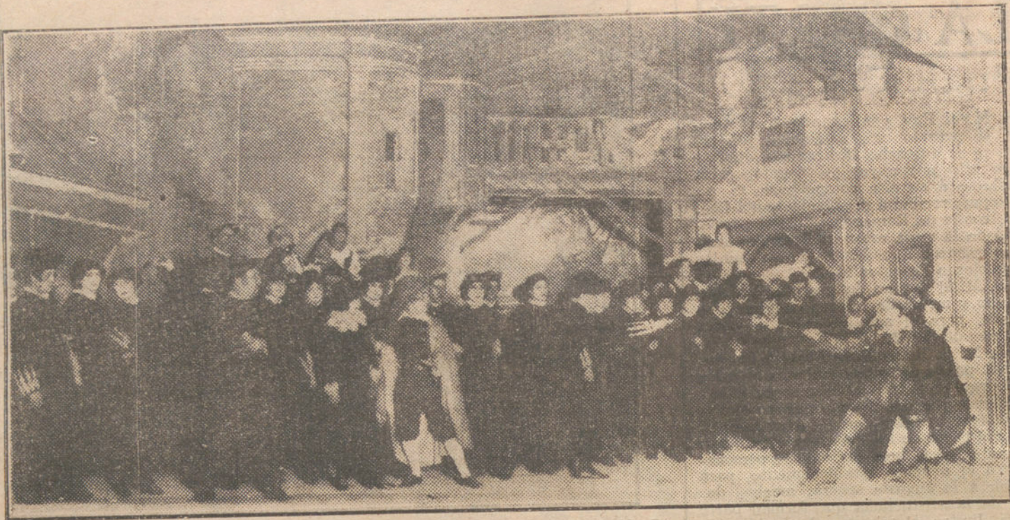
Escena final del primer acto de la zarzuela «El estudiante de Salamanca», estrenada anoche en el teatro de Apolo.