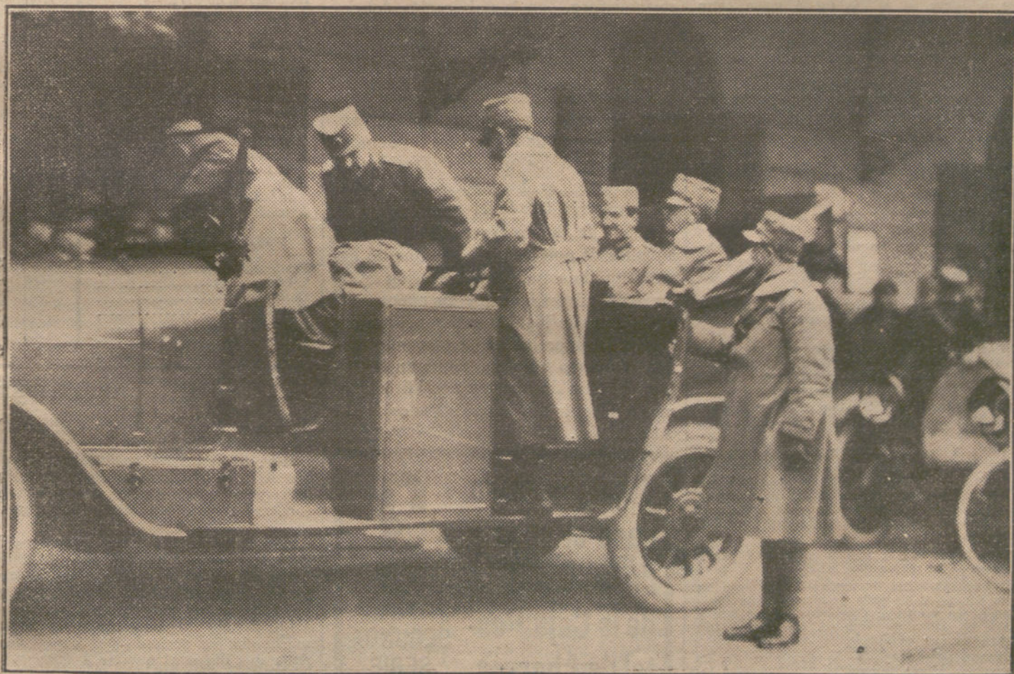
LOS SOBERANOS EN LA GUERRA.—El Príncipe heredero de Servia con el Rey de Italia, al salir de la visita que hizo al Cuartel general italiano.

—Yo, señorito, aunque me esté mal el decirlo, he sido uno de los mozos más populares de Madrid; aquí, donde usted me ve, he tenido mi buena época en Fornos, en el viejo, en el clásico, cuando aún había gente de rumbo que se gastaba los cuartos, sin ofender a nadie, eso sí. ¡Si yo hablara!; había que verme a mí con mis pecheras relucientes como espejos, y mi chaquetita corta, y mis mandiles blancos como la nieve, mi cara siempre bien afeitada y mi paño doblado aquí... ¡Ay, qué tiempos aquellos! Nosotros, nosotros éramos camareros, y no estos señoritos de ahora, con calzon de seda y media colorada y zapatos con hebillas; aquellos años... El hombre habíase embalsamado hablando; su vozecilla de viejo asiático ra-