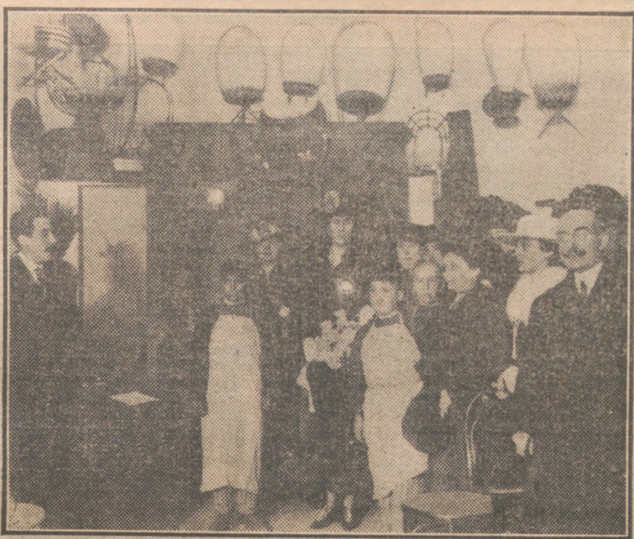
S. M. la Reina Victoria durante la visita que ha hecho esta mañana al Bazar del Obrero.