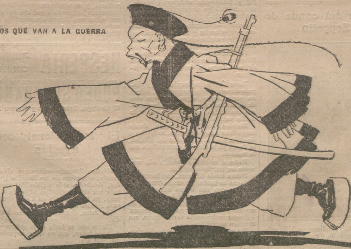
¡Engañado como un chino!