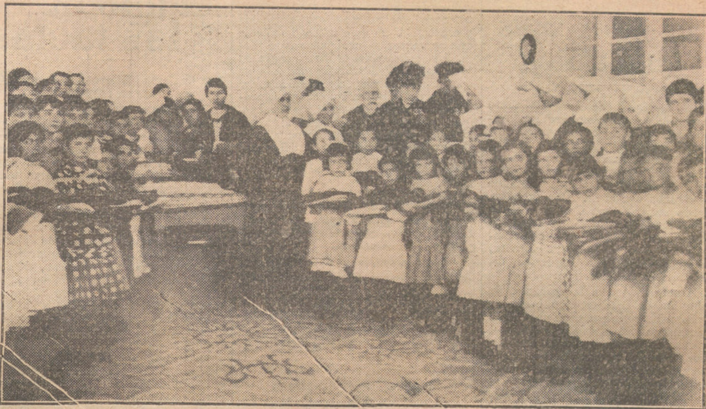
S. M. la Reina madre durante el reparto de ropas á los niños del Asilo de Santa Cristina.

Mediante los fermentos orgánicos que contiene en su mayor actividad, el FOSFOQUINOL regulariza las funciones digestivas; evita la formación de residuos orgánicos ó proteicos, y favorece la absorción del alimento, aumentando su valor nutritivo.