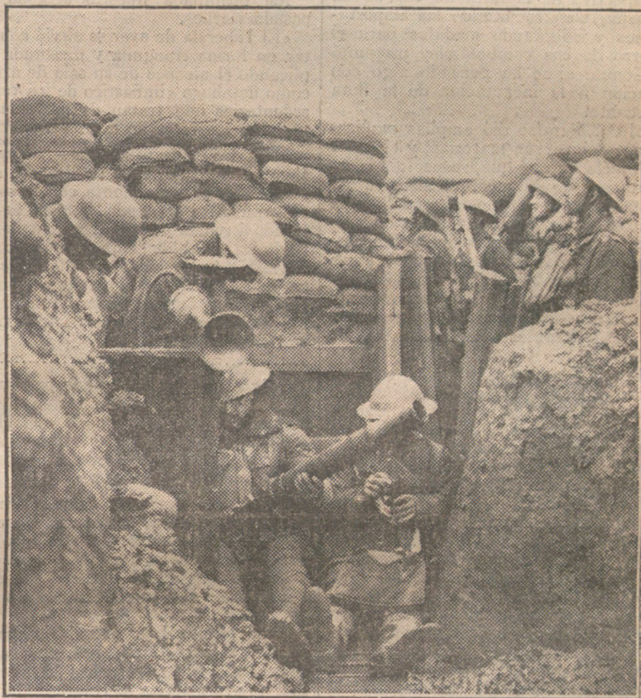
LAS ARMAS DE GUERRA. —Soldados ingleses en una trinchera de Flandes, preparando los fusiles lanza-bombas.

atrás he venido haciendo en mis artículos sobre Marruecos, que han sido sermones en desierto; el vino será uno de tantos productos del suelo marroquí, sabiamente explotado por los franceses, que harán competencia en los mercados importadores a los productos similares españoles.