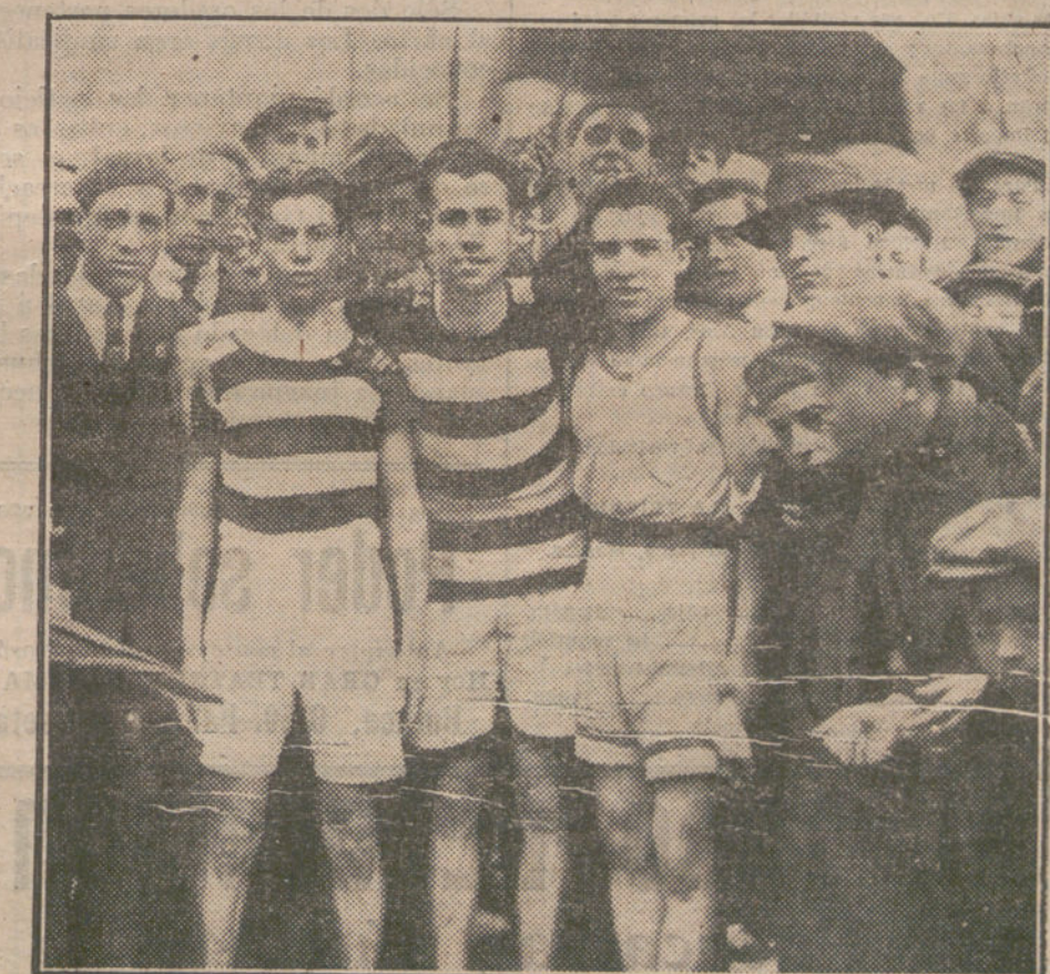
Los ganadores de la carrera pedestre verificada esta mañana y organizada por la Unión Deportiva Castellana.