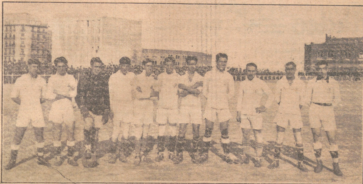
El equipo «Sevilla F. C.», que ayer jugó un interesante partido de foot-bali con el «Madrid F. C.»