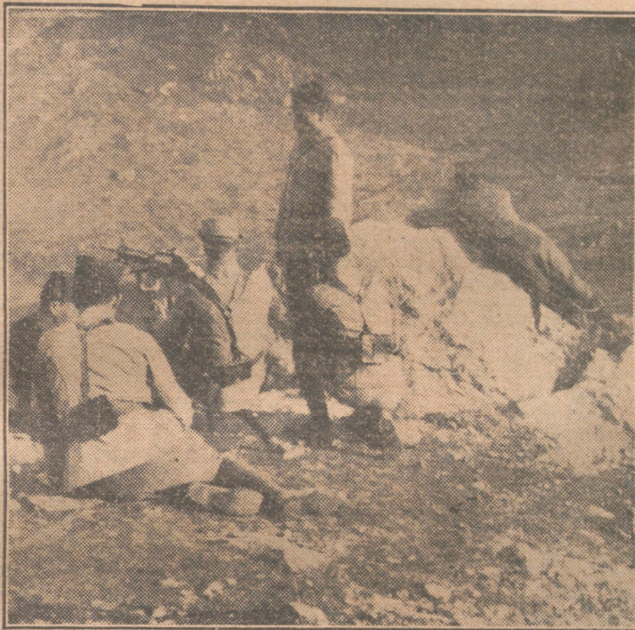
Soldados franceses al servicio de las ametralladoras en una posición del frente macedónico.

Pues bien; el Sr. Barcia, que conocía de antemano el criterio del Sr. Cánovas referente á los lances por cuestiones relacionadas con los extranjeros, en vez de enviar esta carta al Sr. Lezama, estimó más correcto escribirle otra