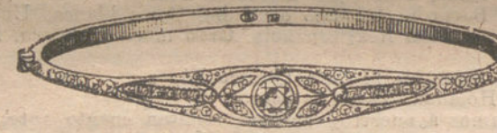
Núm. 7.—Tres brillantes y diamantes. Ptas. 450.