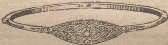
Núm. 3.—Tres brillantes y diamantes. Ptas. 300.