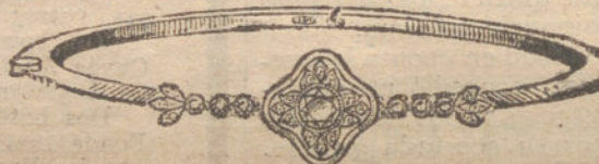
Núm. 6.—Un brillante y diamantes. Ptas. 425.