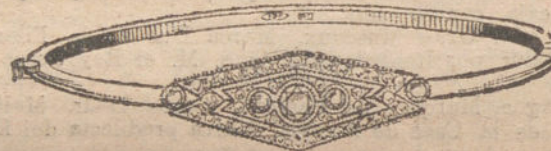
Núm. 5.—Cinco brillantes y diamantes. Ptas. 400.