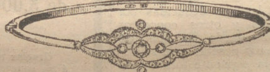
Núm. 4.—Cinco brillantes y diamantes. Ptas. 350.