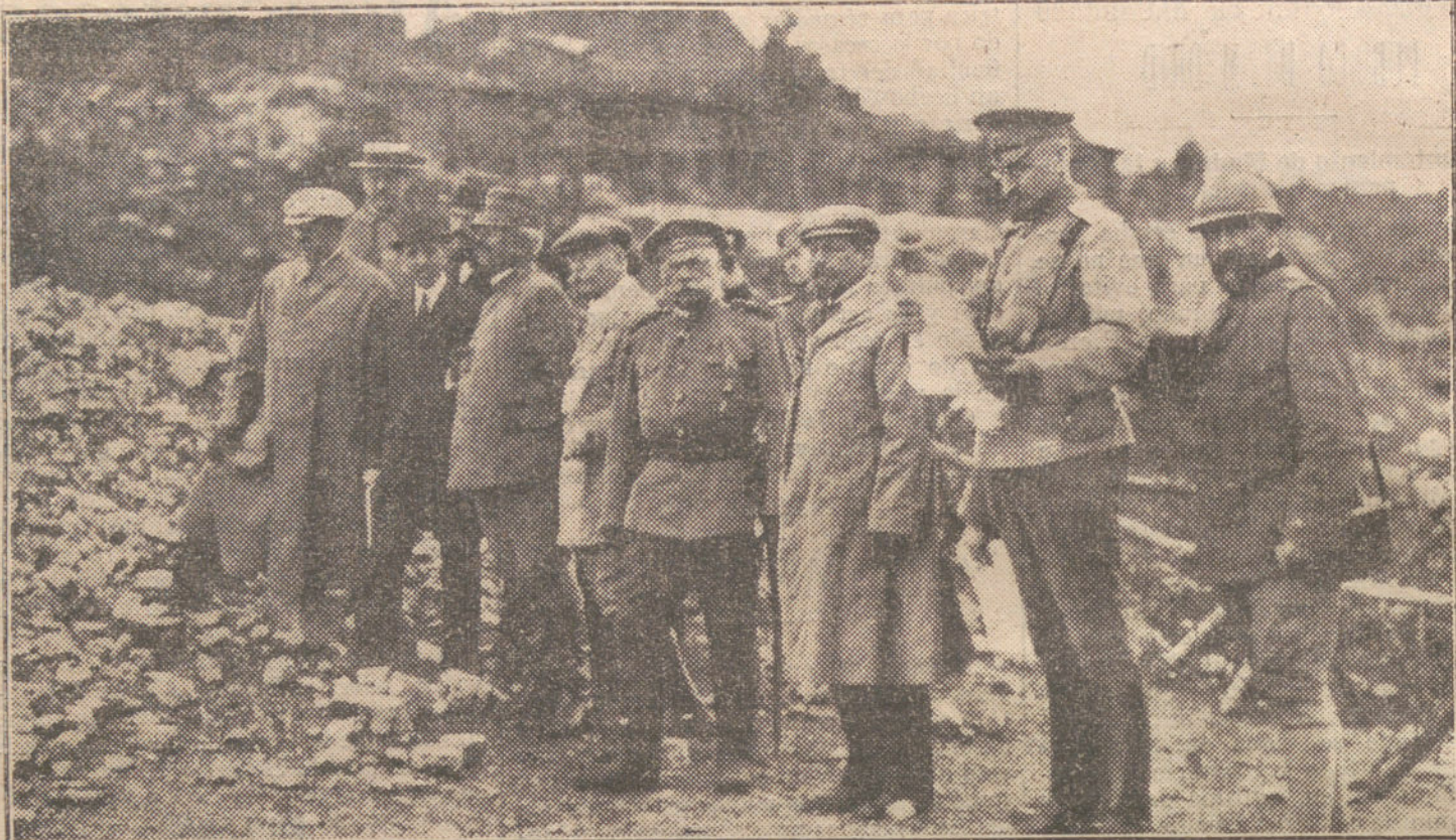
EN EL FRENTE ITALIANO.—La Misión rusa durante su visita á las líneas de fuego del frente italiano.

«La noche siguiente naufragó la ópera «Lucia», cantada por la Andreff, Dagal y Bianchi.»