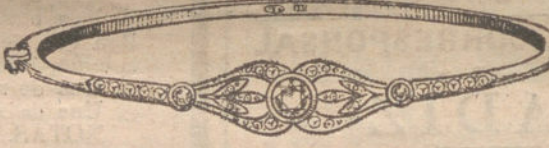
Núm. 8.—Tres brillantes y diamantes. Ptas. 500.

Factura de garantía en todas las compras JOYERIA INTERNACIONAL (NOMBRE REGISTRADO)