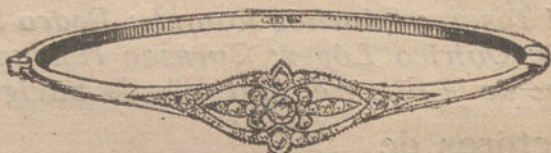
Núm. 1.—Un brillante y diamantes. Ptas. 250.

Monturas de platino fino y oro de ley 18 quilates contrastado oficialmente.