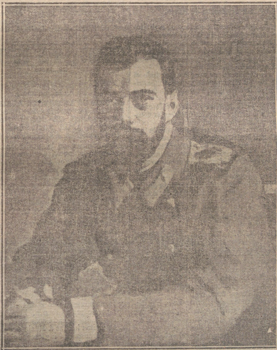
El Zar destronado, Nicolás II.

Rusia asistía al conflicto europeo empujada por una soberbia imprudente, cuyos frutos no han sido otros que los desastres de Polonia y la desorganización interior. El país comenzó bien pronto a darse cuenta de la situación tristísima. Las frecuentes crisis ministeriales, los cambios del alto mando militar, las reuniones y clausuras de la Duma, los «ukases» del Zar, las repetidas manifestaciones públicas ahogadas por la fuerza, la persecución de los periódicos, los extremos de la censura, que tenía incomunicado al Imperio con el resto del mundo, eran síntomas claros de la descomposición política que arruinaba a la nación. El hambre se extendía por todas partes. Sin hogar y sin pan, las familias pobres se entre-