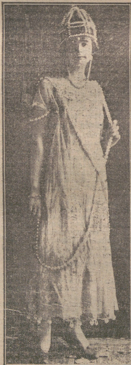
Traje de salón adornado de perlas, según un modelo norteamericano.

En las flores hay vida. Sufren, cual criaturas humanas. Crecen gallardas sobre su tallo, balanceándose orgullosas al ambiente en que se desarro-