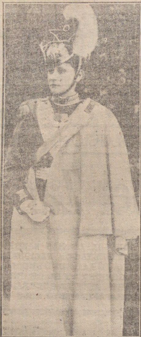
La ex Zarina de Rusia.

Plenamente convencido de la importancia de la decisión tomada, el Comité