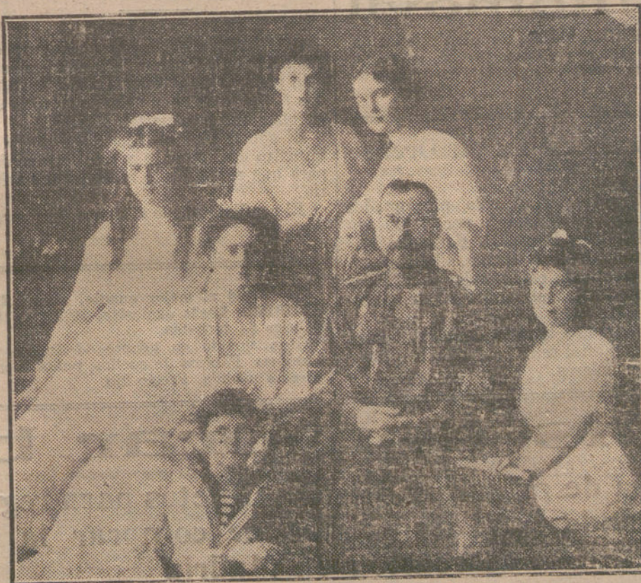
El Zar destronado, con su esposa e hijos