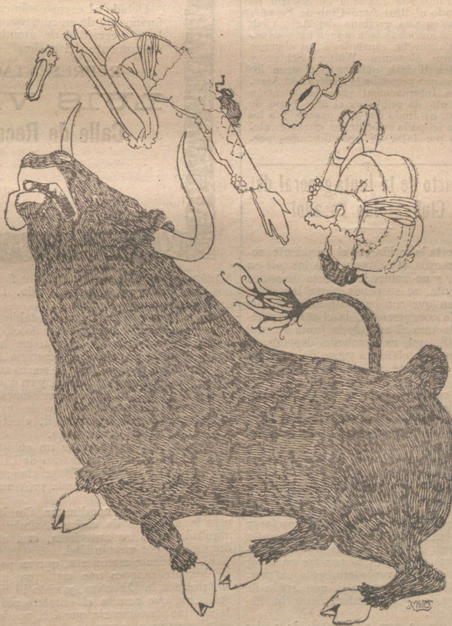
EL RECLAMENTO TAURINO

Madrid, donde tanta afición hay a la música, no cuenta con un Palacio en condiciones para la celebración de conciertos.