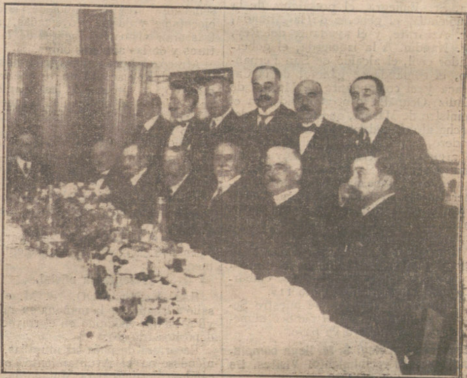
EL MINISTRO DE LA GOBERNACION EN SEVILLA.—Banquete ofrecido por el alcalde y diputados y senadores, en honor del Sr. Ruiz Jiménez.

Desgraciadamente, el cerebro ha sido casi siempre en España una de las fuentes de vida menos explotadas, o explotadas con más equivocada orientación. Para convencerse no hacen falta largas polémicas. Cójase un Diccionario científico, un buen texto de Física, de Química, de Geografía, de Fisiología, de cualquier ciencia positiva, y saltará a la vista la escasez, casi la nulidad, de nombres españoles entre la larga lista de creadores. En el siglo de Leibniz y de Newton, que aquí llamamos de oro para nuestras letras, se discutía en las Universidades españolas si debía haber en