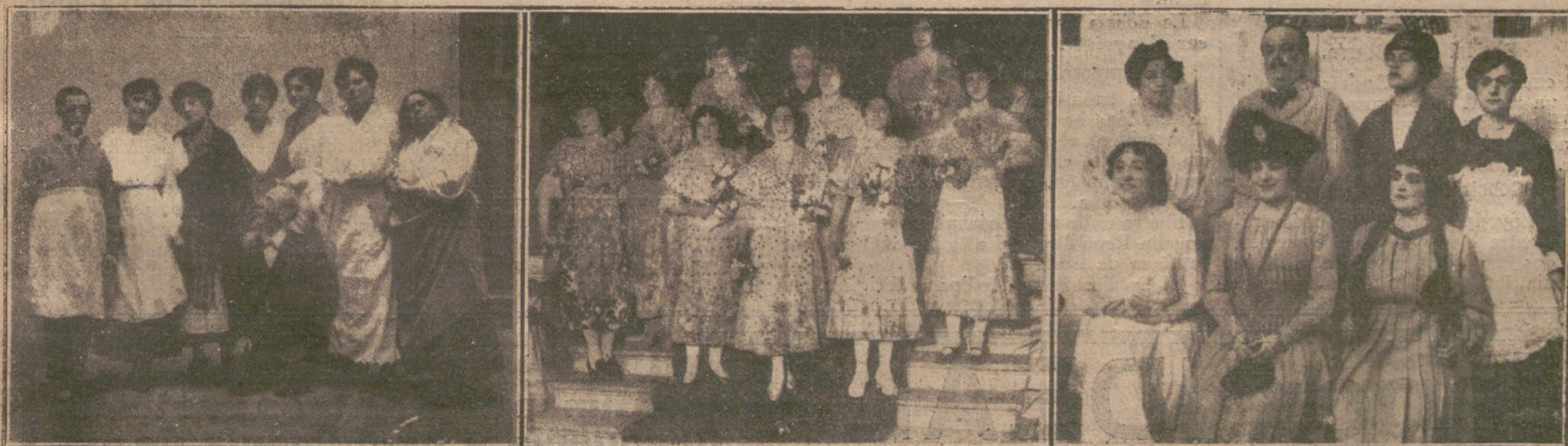
LA FIESTA DEL SAINETE.—De izquierda a derecha: artistas del teatro Lara que interpretaron el sainete de Linares Rivas «El señor Sócrates»; señoritas que repartieron flores en el vestíbulo del teatro de Apolo; artistas de la compañía de Apolo que tomaron parte en la representación del sainete de los hermanos Quintero «La casa de enfrente».

Dos meses hacía que Jorge llegara a casa de su amigo. Tratado como un miembro de la familia, a la cual había conquistado con su carácter simpático, ayudaba a Miguel en las faenas agrícolas, trabajando cuanto más podía, porque no quería en modo alguno ser gravoso. Contribuyó no poco a las distintas reformas introducidas en la finca; cooperó a la buena marcha de los negocios, y llegó a hacerse casi indispensable. Sin olvidar a los seres queridos, su espíritu aguardaba con más tranquilidad el día del retorno al hogar. Habíase, por tanto, operado en el sargento un cambio notable, y a ello habían contribuido poderosamente dos causas: una, el trabajo—fuente para