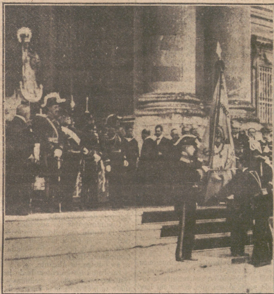
EL REY EN SAN FERNANDO.—S. M. presenciando la Jura de la bandera de los nuevos guardias-marinas.

Y más razonablemente, agrega: «Pero hemos creído, con acierto, á nuestro juicio, que la guerra europea y sus visibles consecuencias aconsejaban atemperar