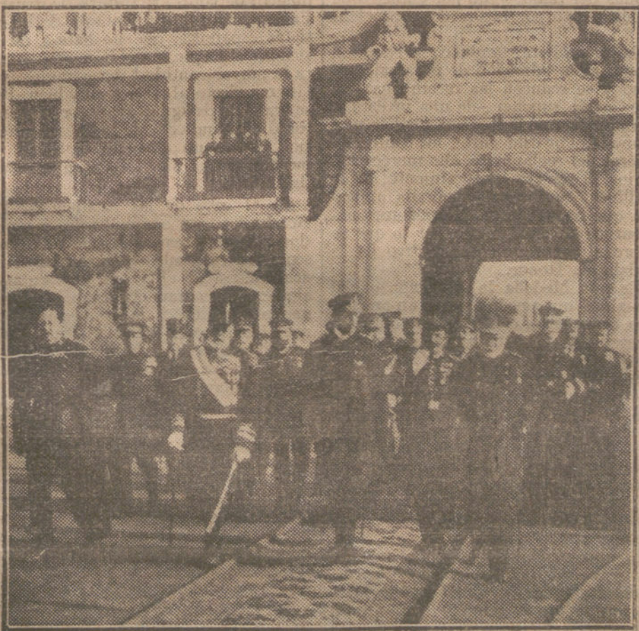
EL REY EN EL ARSENAL DE LA CARRACA.—S. M. saliendo por la puerta antigua después de visitar el arsenal.