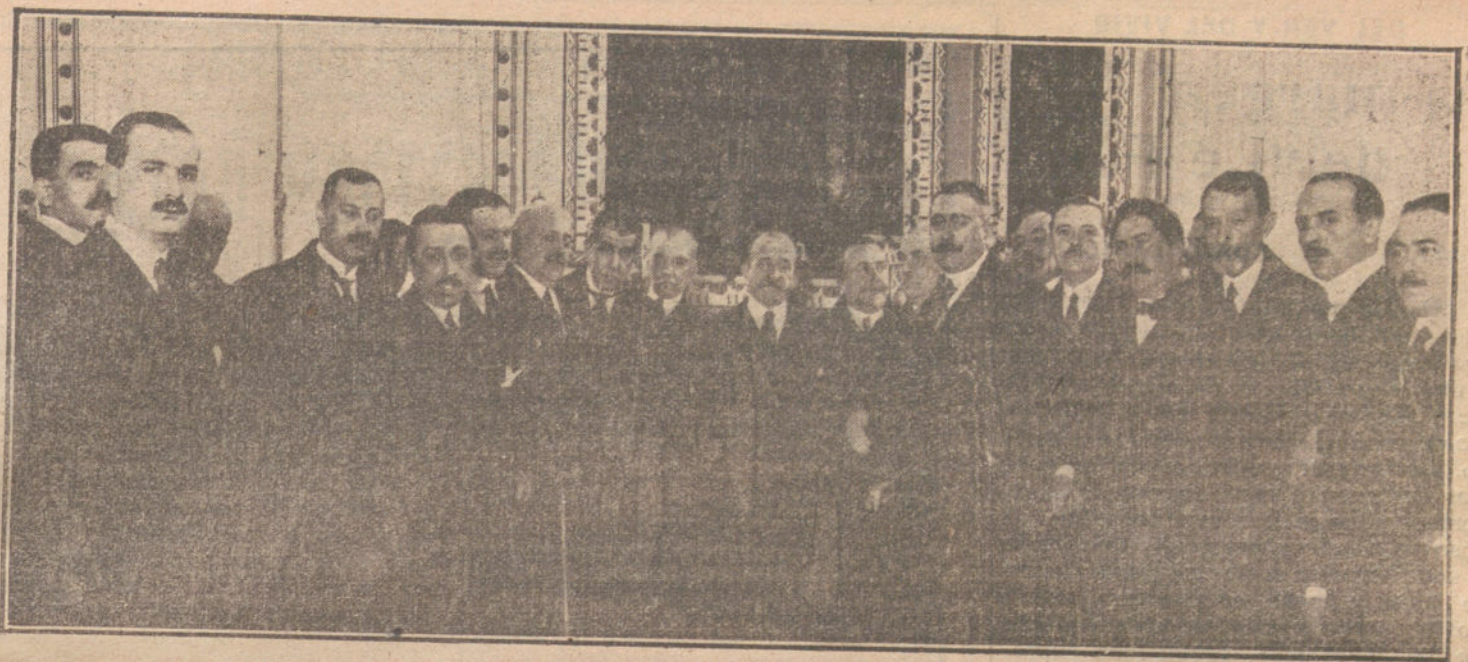
Los comisionados de Málaga, presididos por las autoridades y representantes en Cortes de aquella capital, durante la visita que han hecho esta mañana al presidente del Consejo.

Y para final se representó el sainete de Javier de Burgos, «Los valientes», por Joaquín Pino, Antonia Plana, Bonafé, Díaz, González, Rausell, Moncayo, Mesejo, Llano, Barreto y Sánchez.