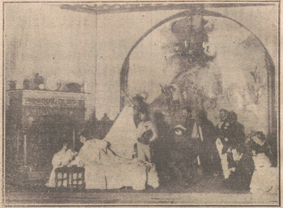
Escena final de la obra «L'Algon», representada anoche en Apolo para presentación de la compañía francesa del teatro de la Porte de Saint Martin.

En el capítulo anterior, Eudore y Mariette se encontraron en el campo, y en este capítulo se encuentran en la choza de Eudore. La lectura de «Le Feu» es una lectura conmovedora, y es una lectura que nos hace sentir la guerra como una tragedia humana.