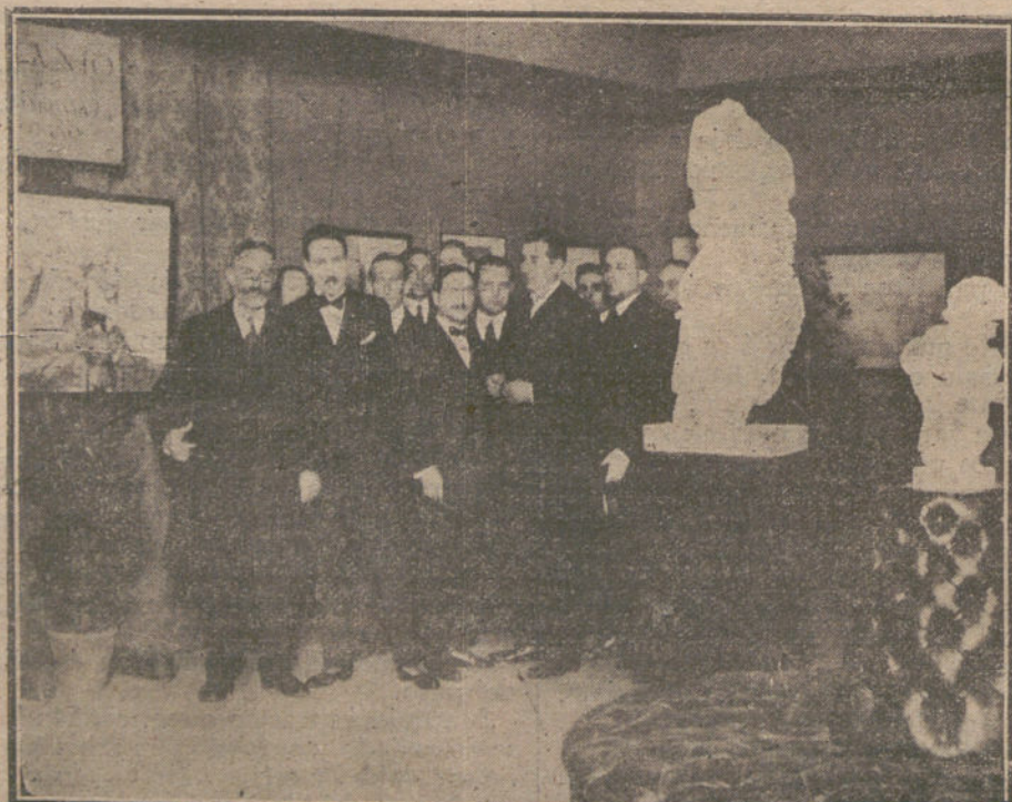
Inauguración de la Exposición de estudios sobre las ciudades romanas españolas, acto verificado ayer en el salón que el Círculo de Bellas Artes tiene en el Palacio Hotel.