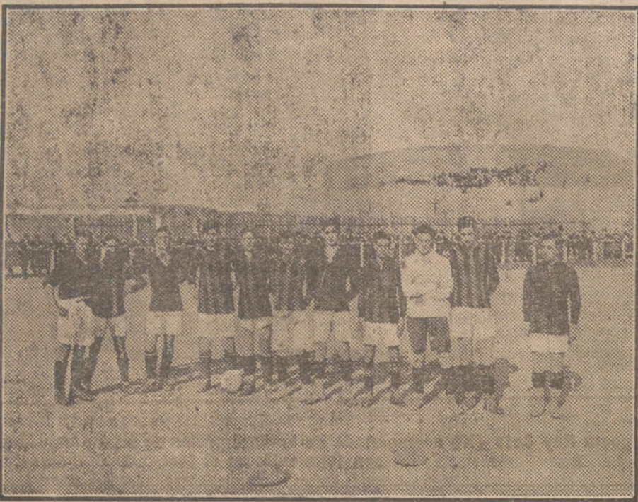
Primer equipo que se constituyó en el Racing Club, campeón de Madrid en el año 1914.

También en provincias, contendiendo con el Arenas, el C. E. de Sabadell (con el que luchó cuatro veces) y el F. C. Barcelona, llamó mucho la atención y recogió laureles merecidos.