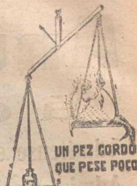
UN PEZ GORDO QUE PESE POCO

Se acaba de publicar el primer número de la revista «Cocina Artística y Ca- sera», que se publicará mensualmente, al precio de 0,50 y obtendrá un tratado de cocina por poco dinero.