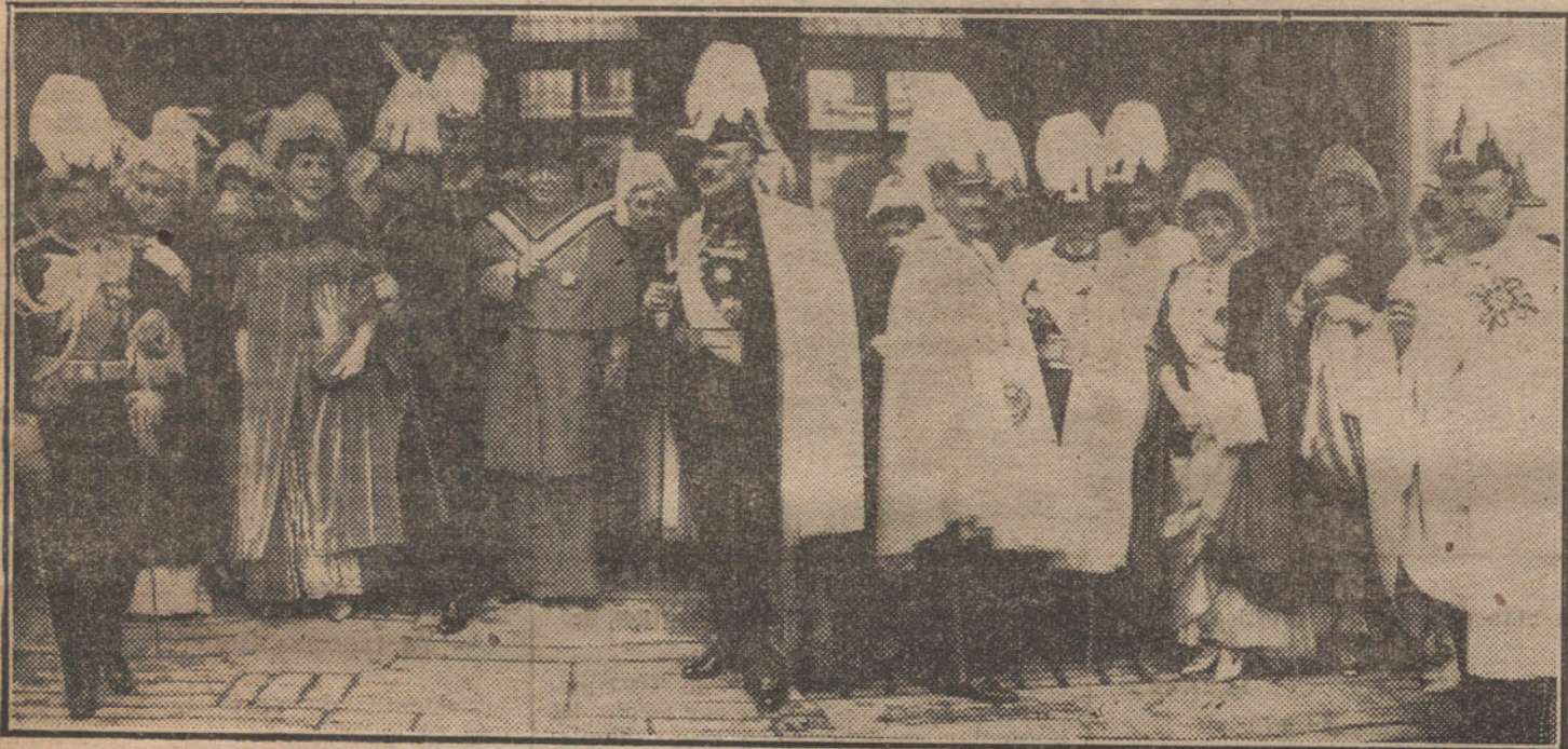
DOMINGO DE RAMOS.—Los aristócratas invitados, saliendo de la capilla pública celebrada en Palacio.

De guardia con S. M. la Reina Doña Victoria estaba la marquesa de Quirós. Concurrieron los siguientes Grandes de España: