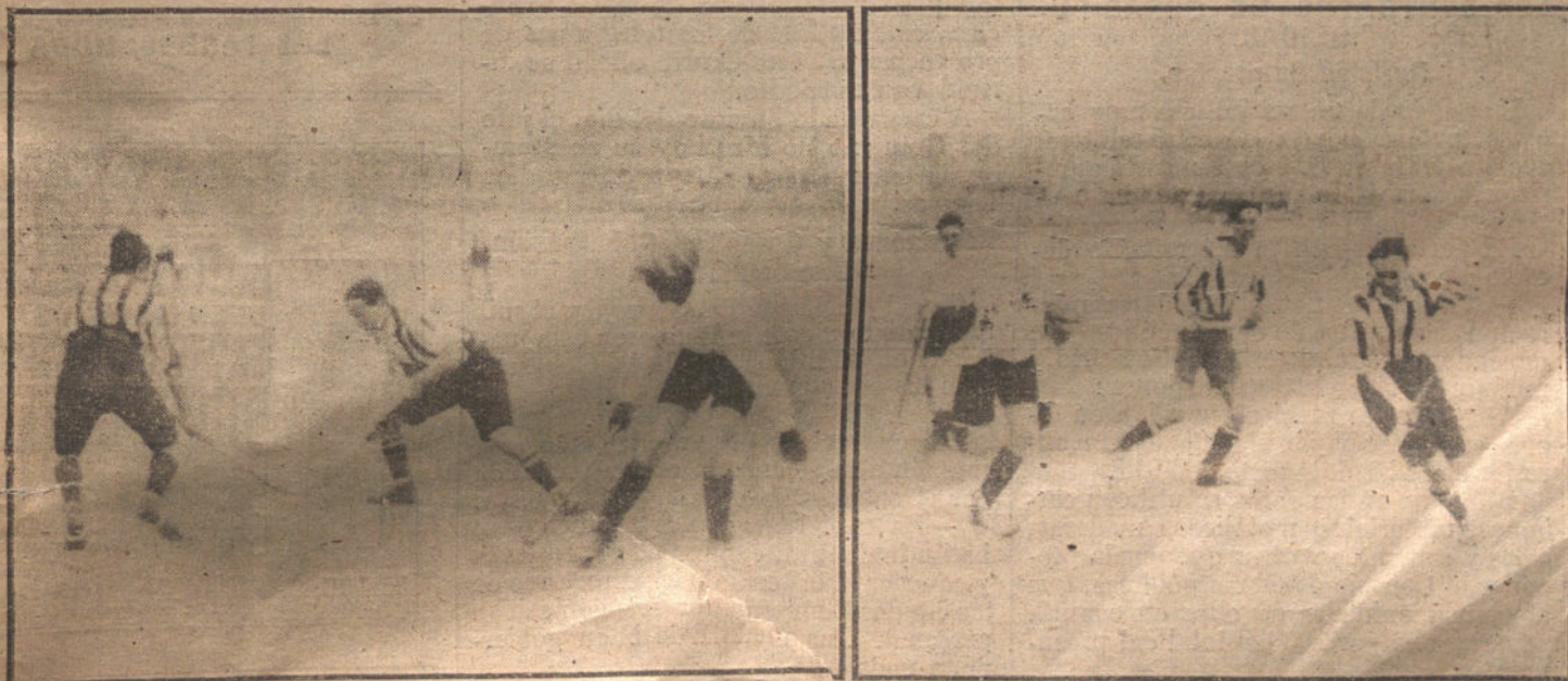
Dos momentos del partido de «Hockey», jugado ayer tarde entre el Real Polo Club, de Barcelona, y el Athletic, de Madrid.

Nuestro querido colega «El Debate» publica una carta de su corresponsal fechada el día 30, y que contiene la siguiente información: