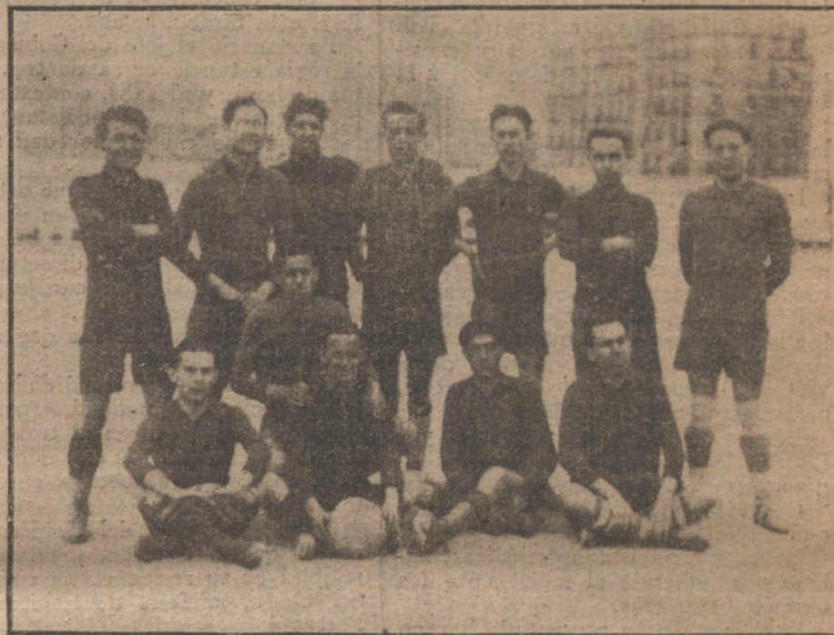
El equipo de la Real Sociedad Alfonso XIII, de Palma de Mallorca, que jugó ayer tarde un amistoso partido de foot-ball con el Madrid F. C.

Lo que quiere decir, que en este aspecto los periódicos de la derecha, dentro del dogma reaccionario, representan muy bien su papel al combatir al Gobierno liberal. La previsión, en realidad, evita el castigo, y entienden los demagogos de la derecha que los deli-