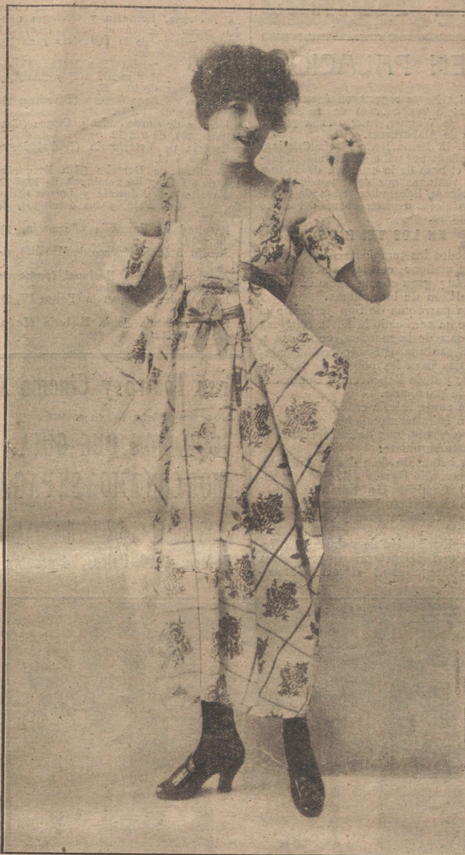
Traje blanco con flores multicolores, originalísimo modelo de la Casa Douillet, de París.