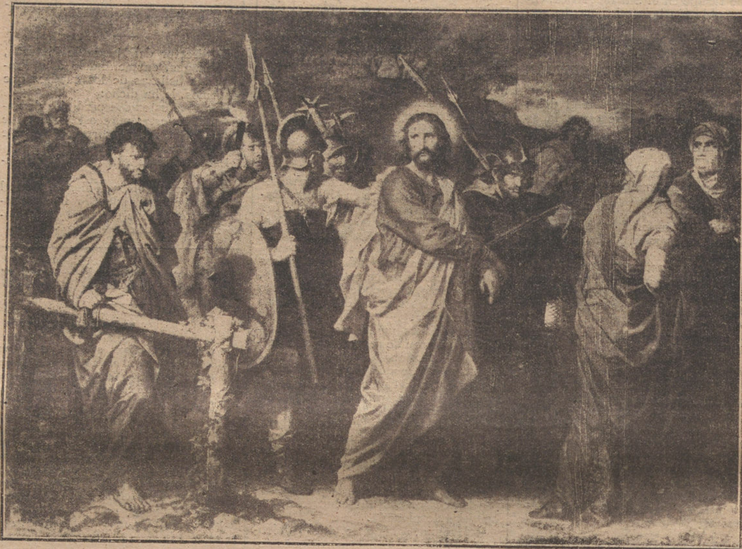
PREDIMIENTO DE CRISTO, cuadro de Hofmann.

PRISION DE JESUS. INCOMPETENCIA Y ARBITRARIEDAD DEL SINEDRIO PARA DECRETARLA Y LLEVARLA A EFECTO. LAS TURBAS QUE LA REALIZARON. LA AUTORIDAD Y FUERZAS DEL PRETORIO FUERON AJENAS A ESTE ACTO DE VIOLENCIA