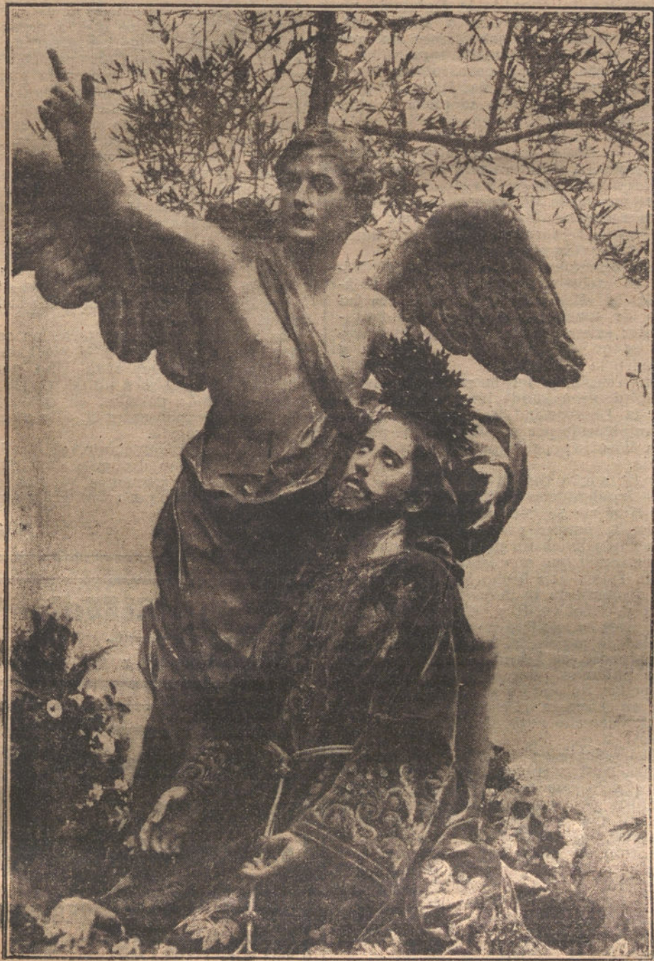
LA ORACION DEL HUERTO, famosa escultura de Salzillo, que se conserva en Murcia.

NUMERO DEL TELEFONO DE LA REDACCION Y TALLERES DE «LA TRIBUNA» (JARDINES, 4, 6 Y 8): 4.444