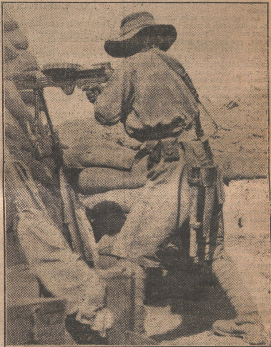
LAS OPERACIONES MILITARES EN FRANCIA.—Soldado canadiense en una trinchera del Sur de Arras disparando una ametralladora.