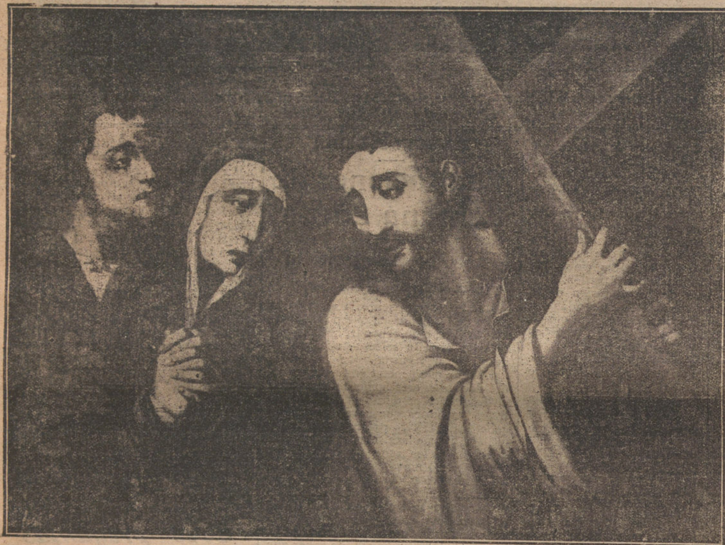
CAMINO DEL CALVARIO, cuadro del «Divino Morales».

EL PROCESO DE JESUS. INJUSTICIA E ILEGALIDAD DE LA INTERVENCION DEL SINEDRIO EN EL PROCESO Y CONDENA DE JESUS. CONSTITUCION POLITICA DE LA REGION DE PALESTINA RESPECTO AL DERECHO ROMANO. ADVOCACION DEL «JUS GLADII» A LA AUTORIDAD ROMANA. MISION DE LOS PROCURADORES Y PRESIDENTES ROMANOS EN TIERRAS DE PALESTINA Y SIRIA. REFUTACION A LA OPINION, QUE NO VE UN ACTO DE USURPACION DE LA JURISDICCION ROMANA EN EL PROCEDIMIENTO SEGUIDO CONTRA JESUS. DEBILIDAD INCOMPENSABLE DEL PROCURADOR PONCIO PILATO