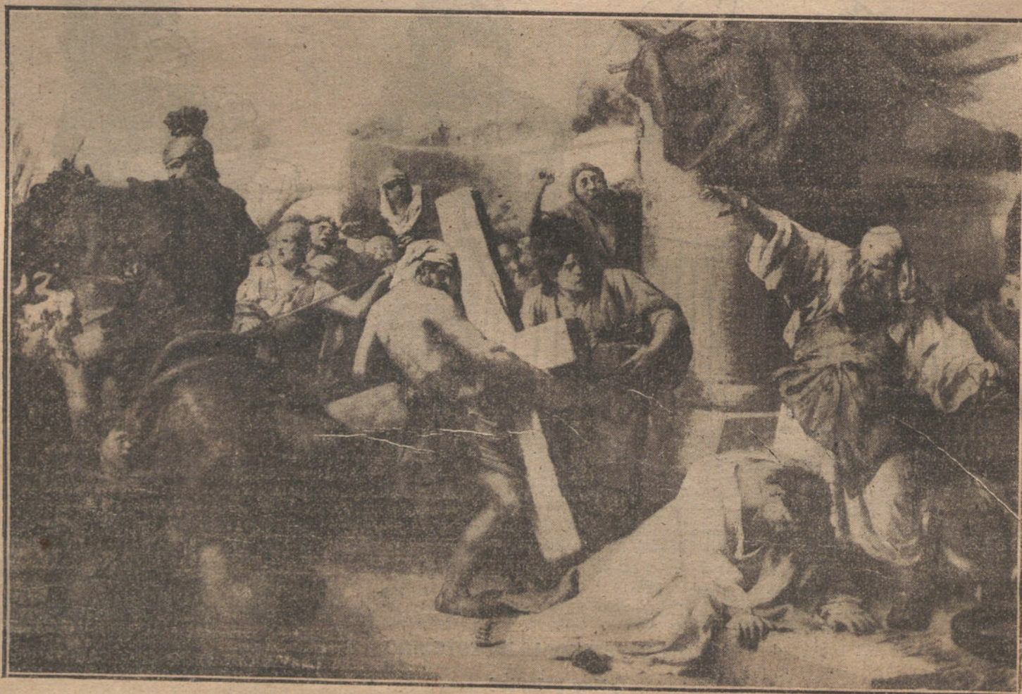
CRISTO ANTE LA CASA DE ANASVERUS, cuadro de Franz Thilo.

Si tenemos en cuenta tales generales principios de la romana legislación no podemos en modo alguno admitir que