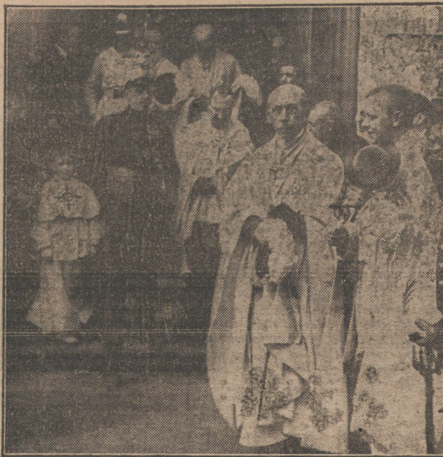
S. M. el Rey saliendo de la iglesia de las Calatravas, donde ha asistido esta mañana á los oficios del día.

«Jesús Nazareno, de la tribu de Judá, convencido de impostor y de rebelión hacia la autoridad divina de Tiberio Augusto, Emperador de los romanos, habiendo sido por este hecho sacado al flego condenado á morir en una cruz por orden del juez Poncio Pilato, sobre la instancia de nuestro señor Hero-