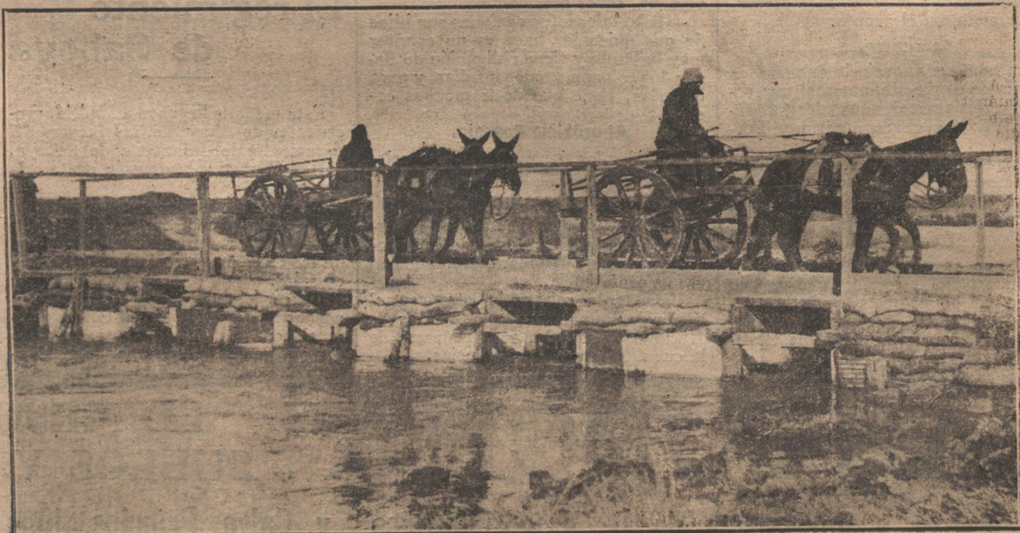
LA LUCHA EN EL FRENTE MACEDONICO.—Convoy de aprovisionamiento cruzando sobre un puente provisional.

¿De quiénes será en definitiva el triunfo? ¿De los idealistas, ó de los prácticos? Con esta disposición de