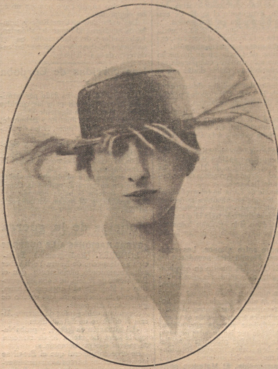
Sombrero de satén, adornado con plumas negras, modelo de la Casa Alice, de París.