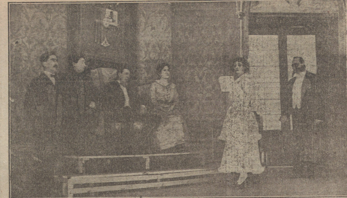
Una escena del melodrama de Julian Moyrón, «La Cabecera del Rastro», estrenado anoche en el teatro Alvarez Quintero.

Nueva temporada... y nueva compañía, mejor dicho, notablemente reformada. La empresa del Coliseo Imperial, que es una de las que más celosas velan por el ade- lantamiento de su teatro y más cariño profesan al favor que el público le dispen- sa, en nada repara, si de obsequiar a su público se trata. A este fin, para corres-