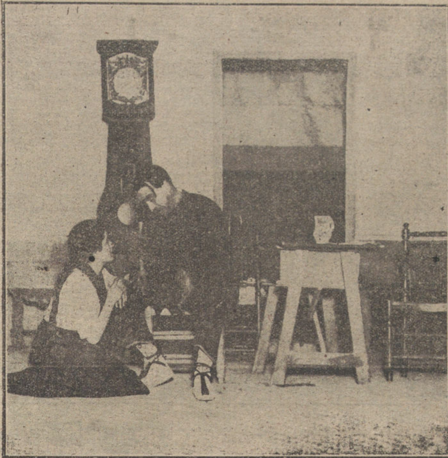
Un momento del drama «La sombra del ciprés», estrenado anoche en el teatro Martín.

Al entrar el repórter en el elegante teatro de D. Tirso, éste pasea por el vestíbulo, cruzadas a la espalda las manos y fija la mirada en el suelo. Falta todavía diez minutos largos para que el sexteto comience a gemir. La luz plena del ves-