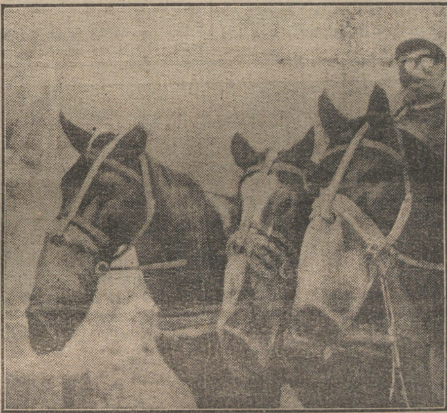
LAS NECESIDADES DE LA GUERRA.—Caballos con hozales protectores contra los gases asfixiantes.