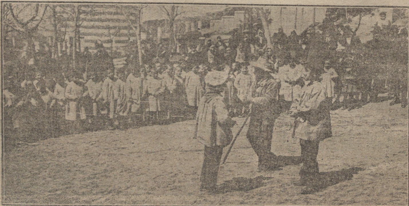
Niños del Asilo de María Cristina representando una comedia al aire libre, con motivo de la Fiesta del Arbol, celebrada esta mañana.