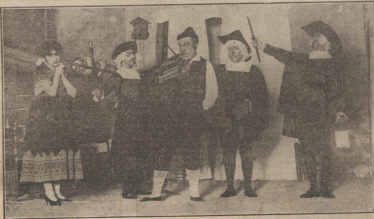
Una escena de «El corregidor y la molinera», obra de Martínez Sierra y Falla, estrenada ayer en el teatro de Eslava.

Sólo es suficiente, para que triunfe un artista que lleva en sí valor positivo que pase el tiempo, que se acepte la innovación por haberse capacitado el público para comprenderla. El tiempo ha pasado. Los conciertos orquestales y de toda índole, la superior educación musical de las gentes para las que ya son familiares Debussy, Strauss, Ravel y Stravinsky, han dado por resultado una adaptación de su oído a las últimas fórmulas. Ya no pue-