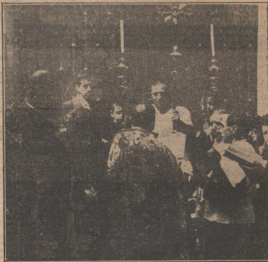
Bendición del templo de la Buena Dicha, cuya inauguración se ha verificado esta mañana.

El gobernador ha dado al molinero orden de que en plazo de doce horas fabrique arroz y sea vendido al precio de tasa, conminándole, en caso contrario, con el cierre del molino.