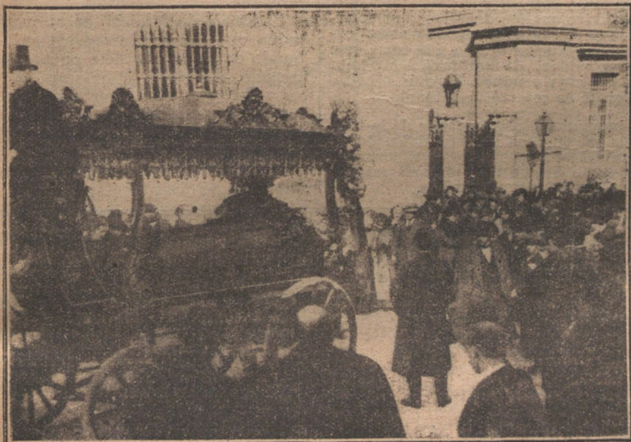
El entierro del ilustre periodista Flores García, al salir del Depósito Judicial.