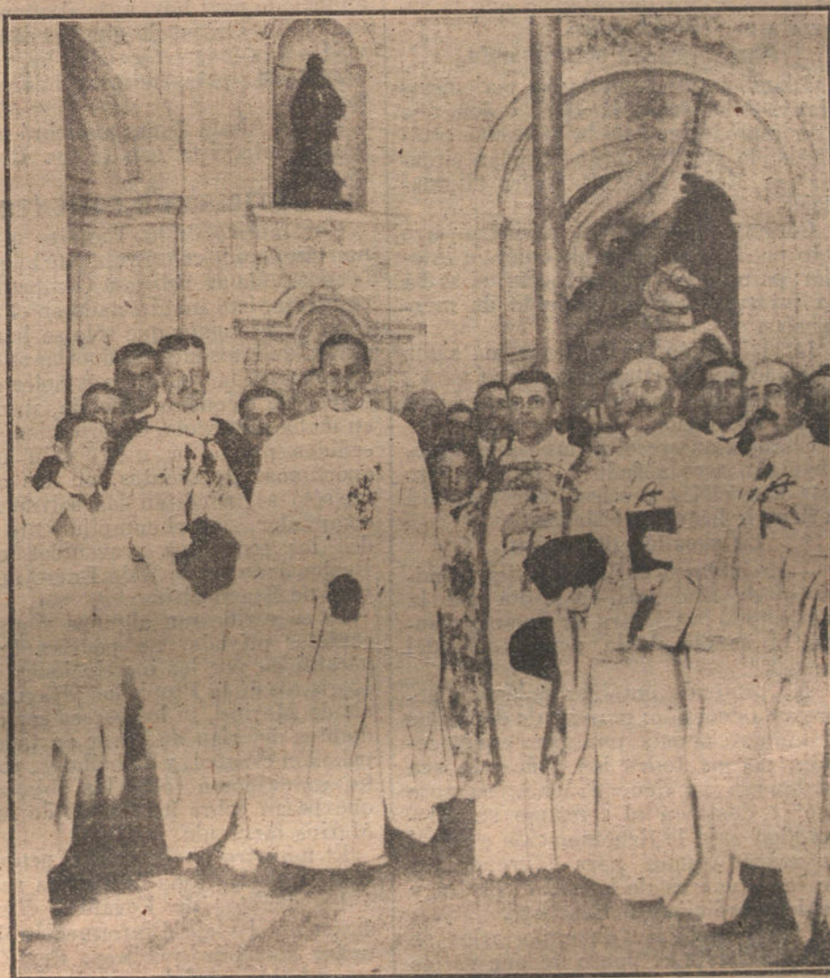
S. M. el Rey y S. A. el Infante Don Fernando con el Capítulo de la Orden Militar de Santiago, al término la ceremonia religiosa, verificada en la iglesia de las Comendadoras.

Tampoco puede haberla por disensos en las resoluciones del Gobierno. Todas ellas han sido adoptadas después de maduro examen y sin discrepancias fundamentales. De la política del Gabinete frente á las actuales circunstancias son solidarios todos los ministros, y éstos con el presidente del Consejo. Si esa política justifica una crisis, ésta no puede ser parcial: debería ser total. Y tampoco es su hora. La