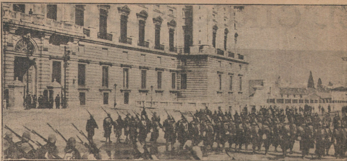
Fuerzas del regimiento de Sahoya, llegadas hoy a Madrid, desfilando ante S. M. el Rey.

el Ayuntamiento, la Junta de la sucursal y otras personalidades, y les acompañaron hasta la Casa Consistorial, donde se celebró una recepción.