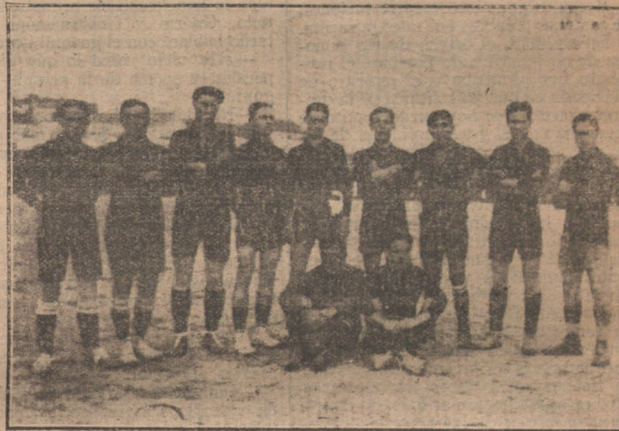
El equipo de foot-ball de Badalona, que jugó ayer tarde con el Racing, de Madrid, y hoy con el Athl. Bc.

En uno de los párrafos se dice á los obreros que la suspensión de garantías es la solución dada por el Gobierno á la carestía de las subsistencias y á la crisis del trabajo. Esto se afirma días