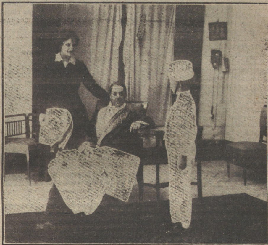
Una escena de «El glorioso difunto», comedia estrenada anoche en el teatro de la Princesa.

Mucho habría que alabar aquí a las mujeres por su talento práctico, que completa y redondea el tedio de los hombres, para venir a parar a que la mujer hace mucha falta en los consejos de la familia y de la sociedad, además de tener tanto derecho como el hombre para participar de ellos. Porque si en el hombre aventaja el discurso y la cabeza, aventaja en la mujer el corazón y los sentimientos, y el humano ser no es cabeza tan sólo, sino más todavía corazón. He advertido cien veces que en casos apurados en que a fuerza de devanarse los sesos el hombre se hallaba cada vez más enredado y perplejo, la mujer dió de repente el corte más discreto con una razonada y con la mayor sencillez del mundo. La inteligencia sola no sirve a veces más que para