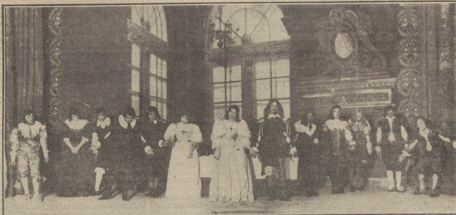
Escena final de la obra «Domando la tarasca», estrenada ayer en el teatro de Eslava.

—Sí, señor Muñoz; es usted el único hombre con el cual nos permitimos es-