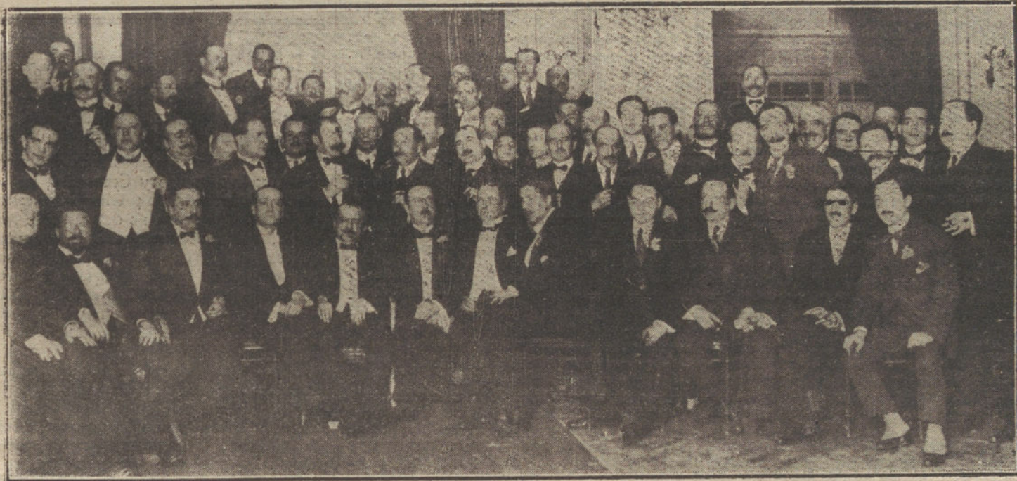
Grupo de asistentes al banquete con que fué obsequiado el popular fotógrafo Campúa.

No es hora esta de ceder derechos, sino de reclamar lo que legítimamente nos pertenece, en una y en otra ribera del