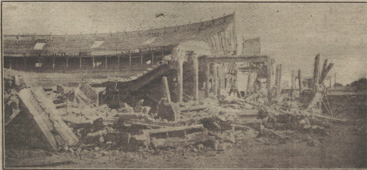
Estado en que quedó la Plaza Monumental de Sevilla, después del hundimiento, ocurrido en ocasión de hacerse las pruebas de resistencia.