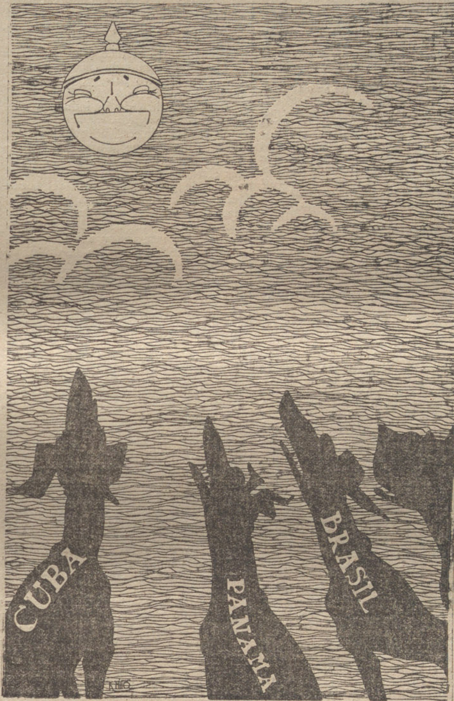
FRASE HECHA Ladrarle á la luna.

Los turcos consiguieron en la orilla septentrional del Diala que una división de jinetes británicos retrocediese 15 kilómetros, mientras más al Nordeste, otro regimiento de Caballería in-