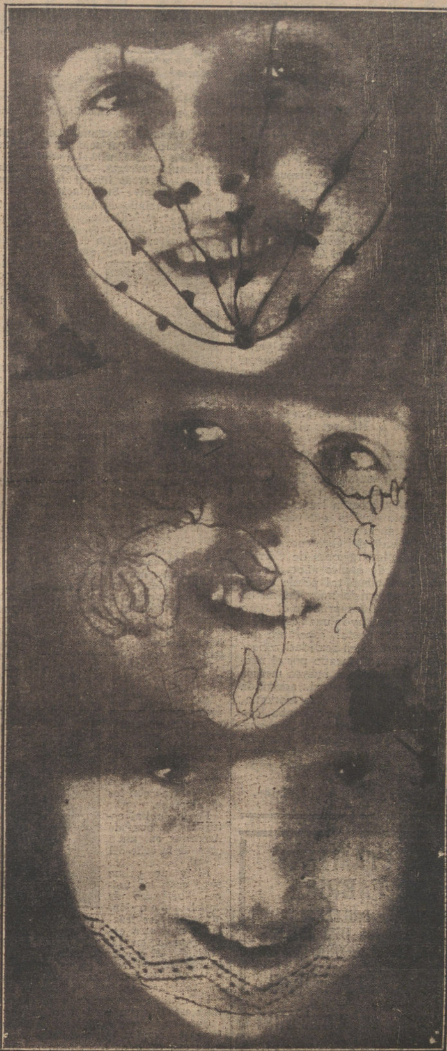
Últimos y originales modelos para velos, creación de una casa norteamericana.

al exclusivo objeto de que la personalidad del marqués de la Sonora quede anulada, y sosteniendo el Banco de España que los valores á que yo hice referencia son los mismos que hoy disfruta la Escuela de Pilotaje, incorporada en Málaga al Instituto; demostrar que no hay acciones procedentes de los antiguos Bancos de San Carlos y San Fernando; que están pendientes de conversión á las del actual Banco de España; que no hay dividendos ó intereses atrasados que estén sin cobrar desde hace más de un siglo, y, sobre todo, que ni éstos ni aquéllas tienen por qué revertir en favor de nuestro augusto Soberano, ni deben pasar tampoco á poder del Estado, para que los aplique, según disponen las leyes, á obras de beneficencia ó instrucción.