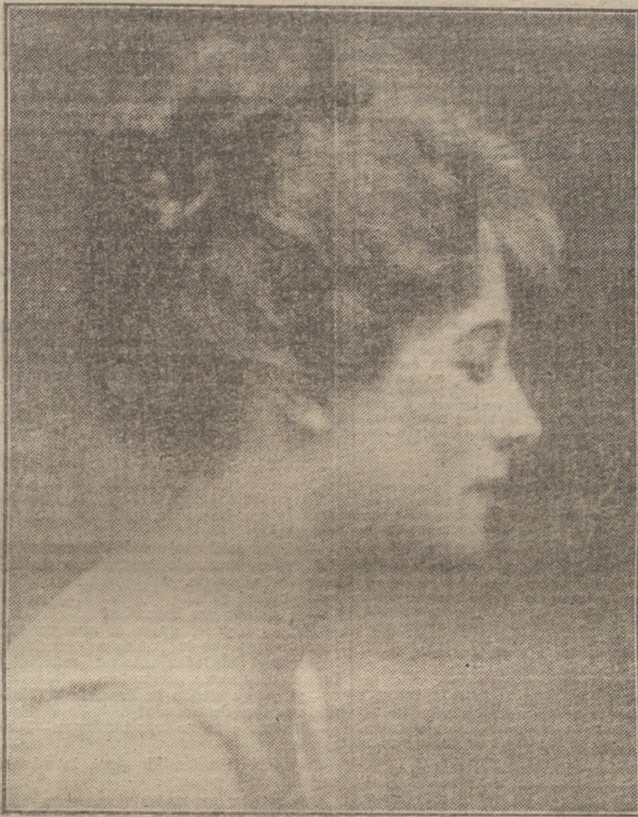
ALMA TAYLOR, la estupenda actriz inglesa, una de las principales artistas de la cinematografía en el Reino Unido.

en cinematógrafos, y son contadísimos los que, excepto circunstancias especiales, abandonan su género para cultivar otros cualesquiera.