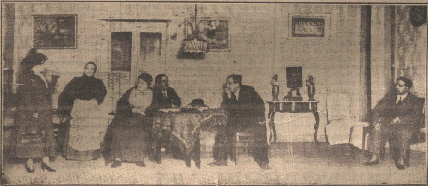
Una escena del segundo acto de la obra de Arniches «La venganza de la Petra», estrenada anoche en el teatro Cómico.