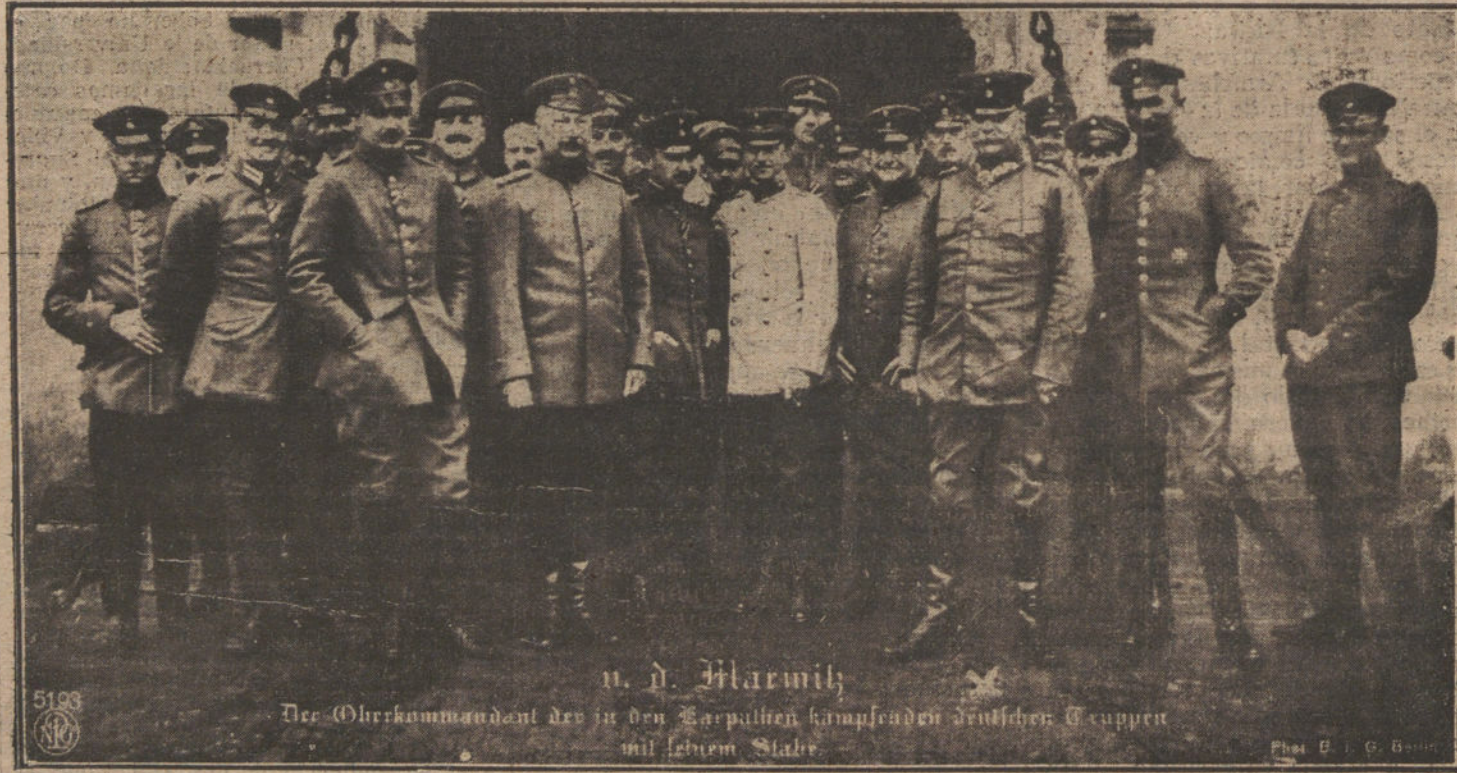
Von der Marwitz (X), comandante en jefe de las fuerzas alemanas que combaten en los Carpatos, con su Estado Mayor.

Aquí ya se ha visto claramente la tendencia de desviar la cuestión, entremezclando unas acciones con otras,