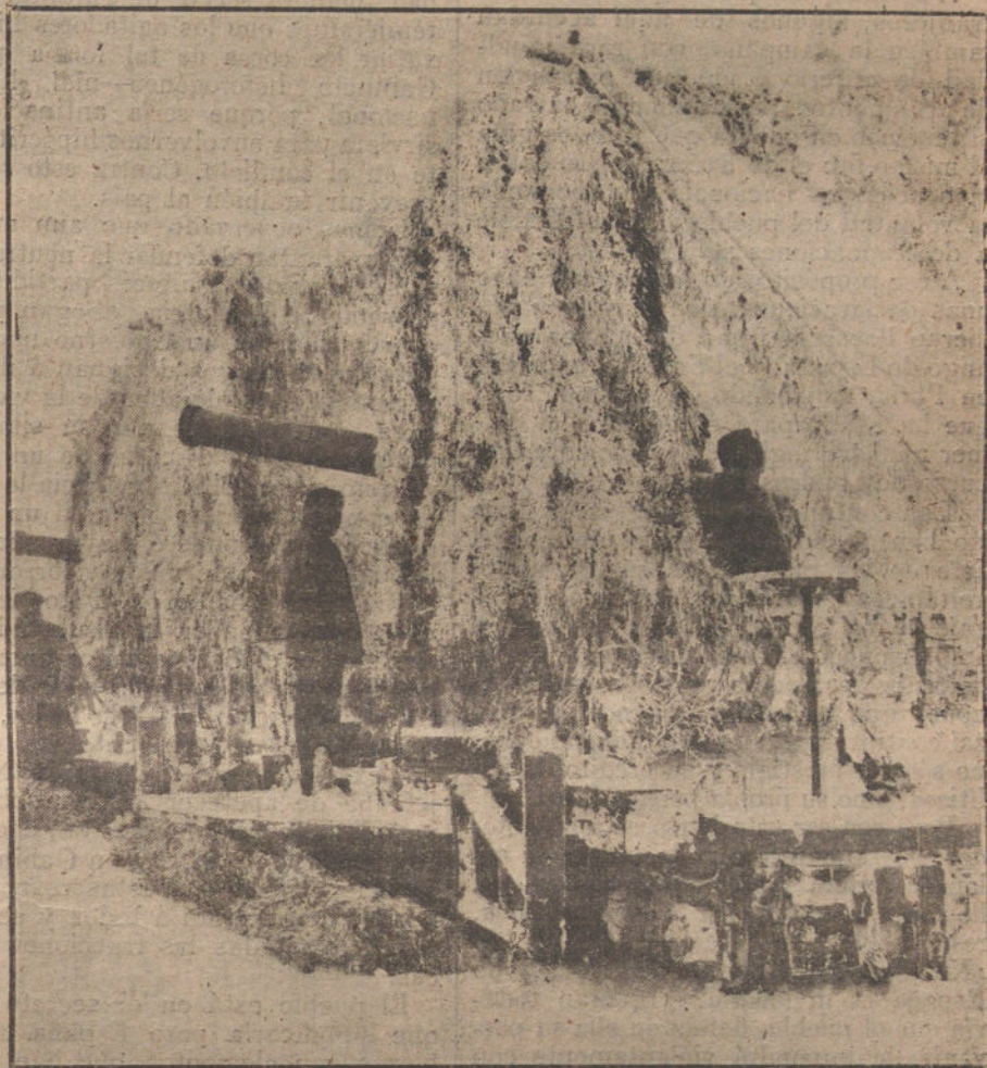
LAS NECESIDADES DE LA GUERRA. Cañones de sitio sobre plataformas móviles, y ocultos entre ramajes y nieve.

¡No habíamos caído en la solución! Y cediendo también todo Marruecos. ¿Para qué nos sirve esta pesadumbre sobre el reino? Gastos y disgustos. ¡Pues a evitarnos tantos gastos y tantos disgustos!... ¡A regalar todo lo que nos moleste, todo, todo, todo...! Esta generosidad es ya en nosotros bien antigua. Es una de las glorias que envanece nuestro abolengo histórico. Así