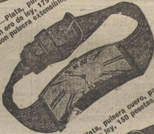
Núm. 1.944.—Plata, pulsera cuero, pesetas 75. El mismo, en oro de ley, 150 pesetas.