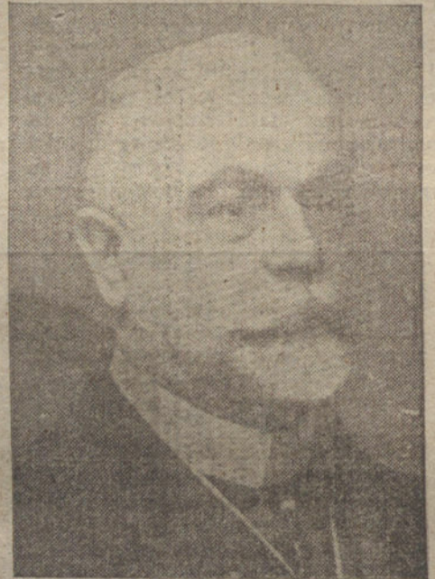
El general Miranda, que por tercera vez continuará al frente del ministerio de Marina.

El presidente dimisionario le manifestó que su deseo era el de que todos sus amigos que hoy ocupan altos cargos, continúen desempeñándolos como si él siguiera siendo el jefe del Gobierno.