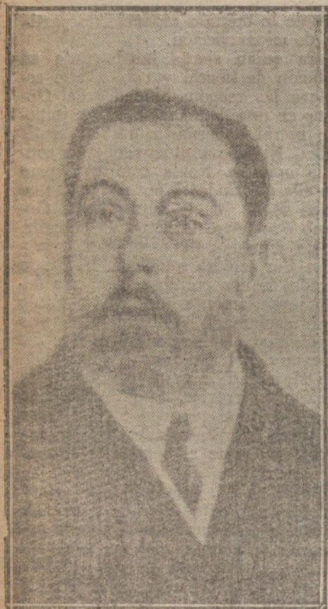
D. Julio Burell, que pasa á ocupar la cartera de Gobernación.