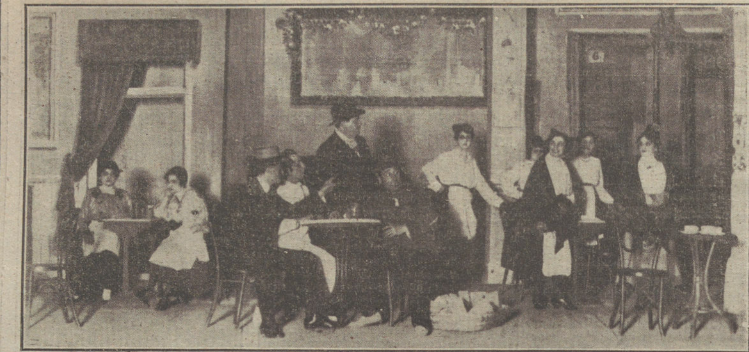
Una escena del sainete «El marido de la Engracia», que se estrena esta noche en el teatro de Apolo.

Fueron tema de las anteriores Asambleas anuales el derecho de destilar la cosecha; penalidad á los sofisticadores de vinos; indemnizaciones reclamadas por los Sindicatos á los adulteradores; creación de Estaciones enológicas, Escuelas de viticultura y otros establecimientos; elevar el precio de 2,50 pesetas por grado y hectolitro; establecimiento de Cooperativas; fundación de un negocio estadístico en la «Unión»; maestrario de viticultura; elevación de la tributación in-