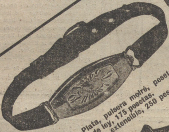
Núm. 1.933.—Plata, pulsera molré, pesetas 85. El mismo, en oro de ley, 175 pesetas. Idem id., con pulsera extensible, 250 pesetas.