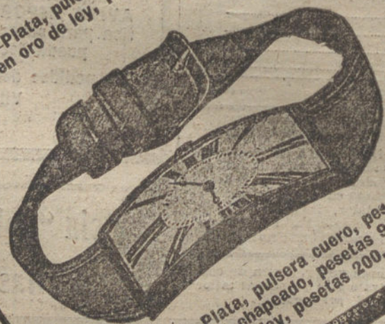
Núm. 1.265.—Plata, pulsera cuero, pesetas 80. El mismo, en oro chapeado, pesetas 90. Idem id., en oro de ley, pesetas 200.