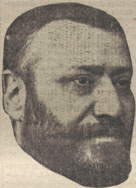
D. José Francos Rodríguez, nuevo ministro de Instrucción pública.

Añadió S. M. que habiendo escuchado durante estos días la opinión de los hombres más importantes de la política, no necesitaba nuevas consultas y resolvía encargar de la formación de nuevo Gobierno al señor marqués de Alhucemas.