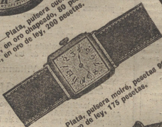
Núm. 190.—Plata, pulsera moiré, pesetas 90. El mismo, en oro de ley, 175 pesetas.