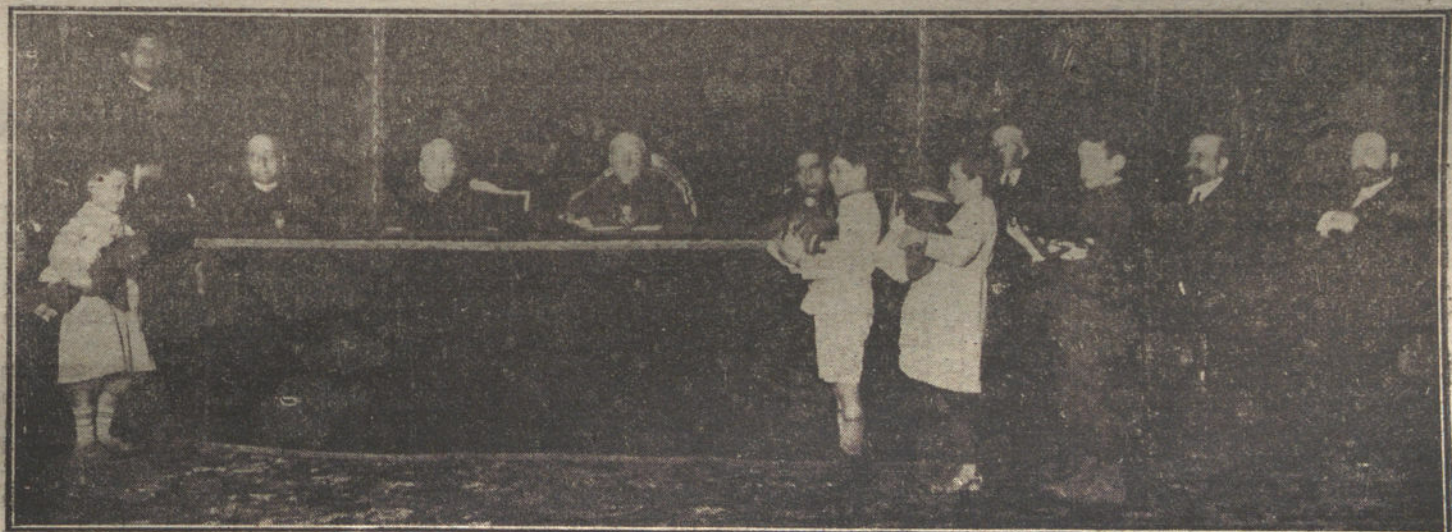
El ilustrísimo señor obispo de Murocia presidiendo el reparto de premios para restear el tercer centenario de la fundación canónica de las Escuelas Pías.

El bautizo de la hija de los duques de Medinaceli tendrá efecto en el Real Palacio el 27 del corriente.