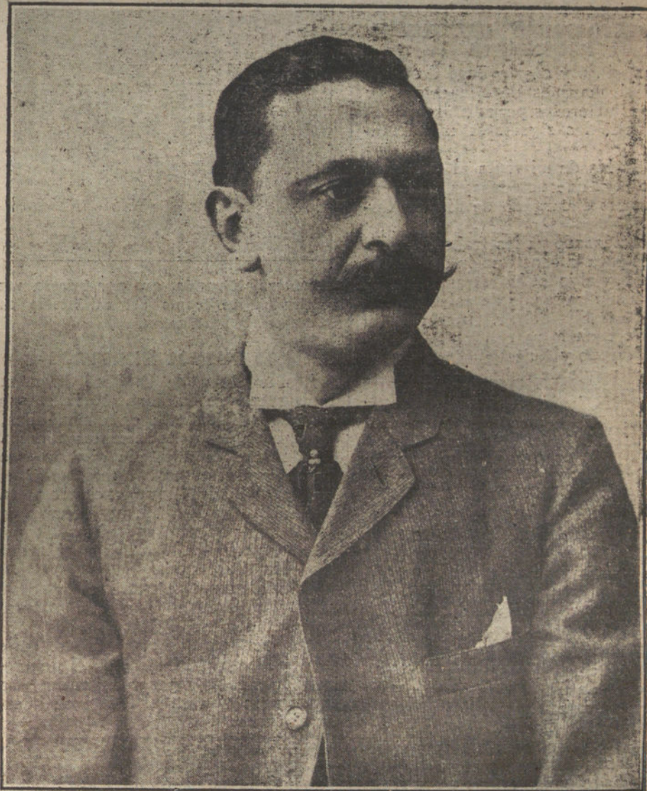
D. Manuel García Prieto, nuevo presidente del Consejo de ministros.

solita confianza autorizándome en todo momento para proceder como á mi juicio mejor conviniere á los intereses del país. Pero lealmente reconozco después de haber recogido con patriótica ansiedad las manifestaciones de la conciencia pública algunas surgidas del propio partido que me honra con su dirección y jefatura que hoy una gran