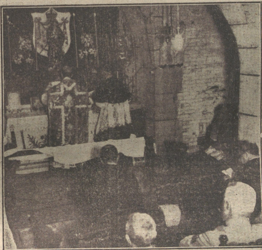
VISITA DE LA MISIÓN DE OBISPOS FRANCESES Y ESPAÑOLES A LA CATEDRAL DE VERDUN.—Los obispos españoles durante la celebración de la misa.

El segundo maquinista asegura que vió un trozo de cable á cuyo extrem