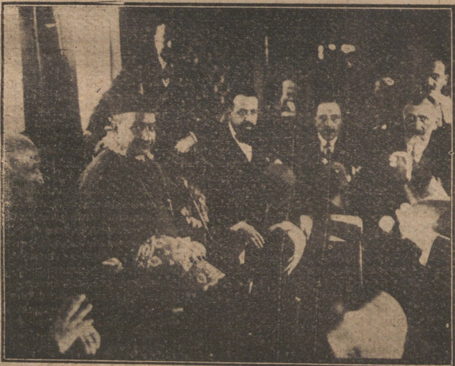
ENTRADA EN MADRID DEL NUEVO OBISPO.—El nuevo prelado en el vagón del tren especial que le condujo a Madrid, conversando con los representantes del Ayuntamiento madrileño, que fueron a recibirle en Pozuelo.

Las tropas alemanas asaltantes regresaron con los pocos supervivientes como prisioneros, con ametralladoras, un lanzaminas y demás material. También en el sector de Arras, así como entre el Ancre y Somme, cogieron las patrullas alemanas prisioneros y botín. Fuerzas enemigas utilizadas en un ata-