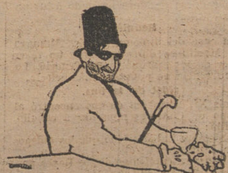
LEAL DA CAMARA, con su traje pombiano, según Bartolozzi.

Ultimamente, el admirable caricaturista y escritor portugués Leal da Camara, en un libro que acaba de publicar, dedica uno de los más bellos capítulos a Pombo, y en su visión de los cenáculos madrileños es en ese en el que se queda y es el que destaca más entrañablemente en sus recuerdos: «En Pombo—dice Leal da Camara—buscaba-se o silêncio para melhor pensar entre o chapeus afurilados dessa época romântica e cavalheiresca.»