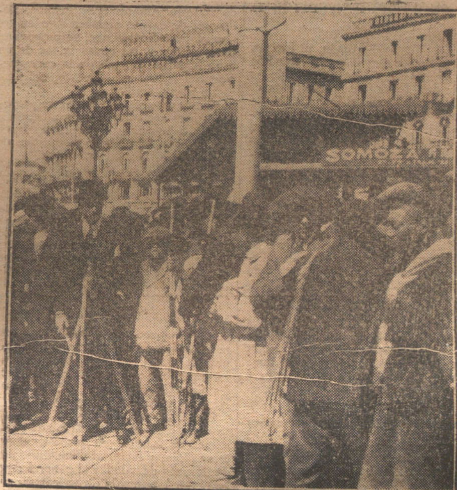
Momento de comenzar las obras del Metropolitano, acto verificado esta mañana en la Puerta del Sol.