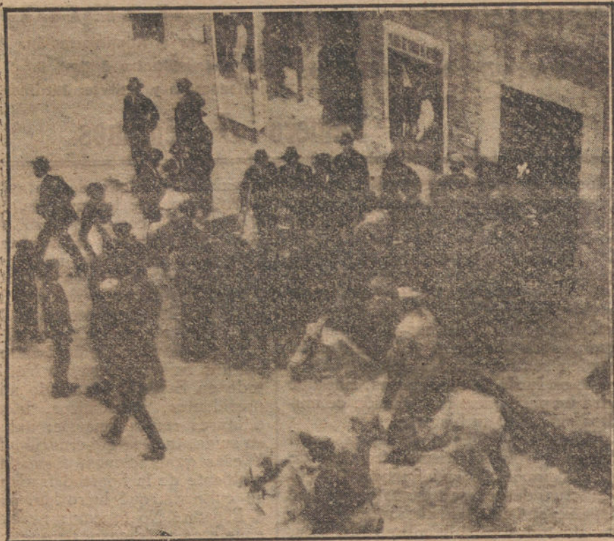
El diestro Florentino Ballesteros (X) saliendo de la capilla de la Plaza de Toros momentos antes de empezar la corrida, en la cual tan gravísima cogida ha sufrido

A las siete y media de la tarde, después de cerrada nuestra última edición de ayer, dominada un tanto la postración en que había caído el torero de Zaragoza, al ingresar en la enfermería de la Plaza, se decidió trasladarle a su domicilio.