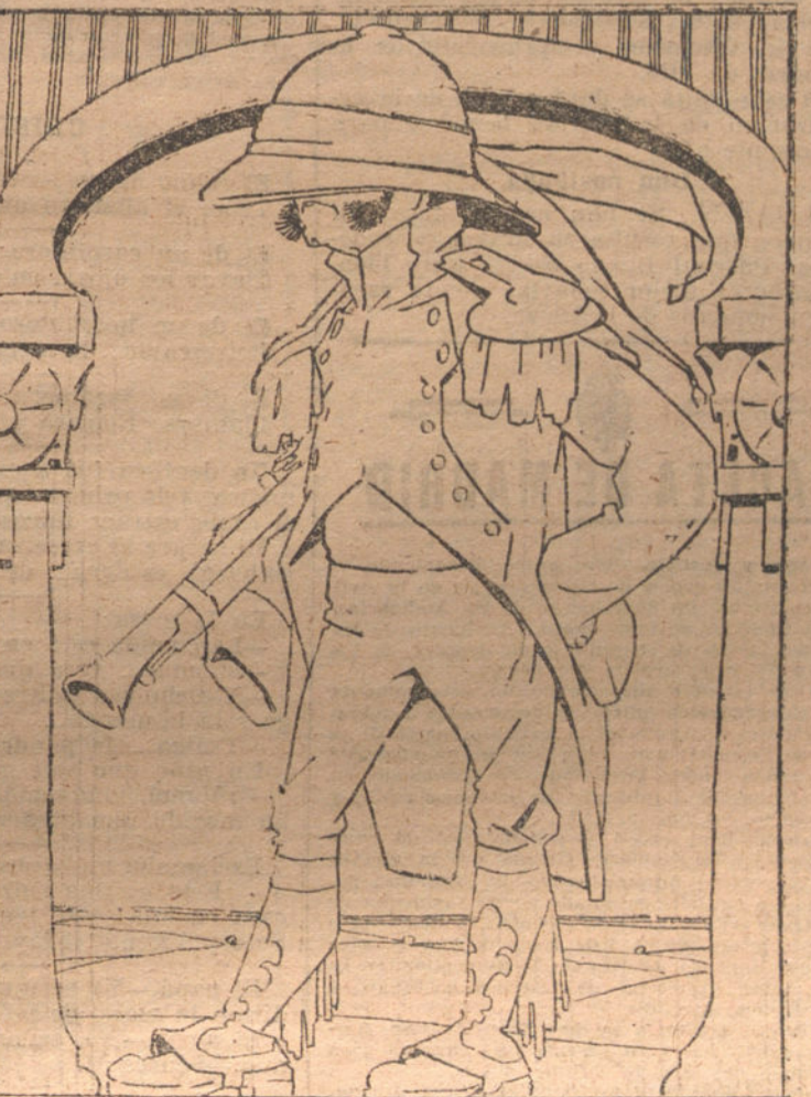
España, vista por los intervencionistas, que la prefieren vestida según los patrones franceses é ingleses. (Caricatura de AGUSTIN.)