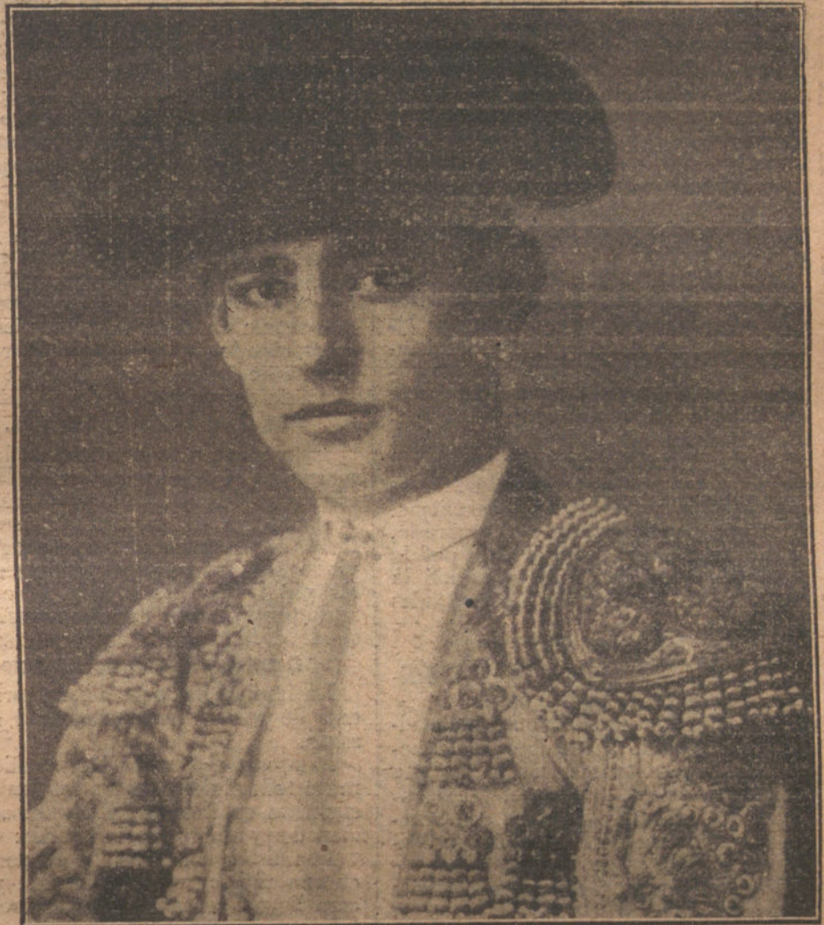
Ultimo retrato de FLORENTINO BALLESTEROS, el desgraciado torero aragonés que murió anoche a consecuencia de la cogida del pasado domingo en la Plaza de Toros de Madrid.

Pretexto tan flaco y torpe como el que hoy se quiere buscar a la caída de Romanones, achacándola a intrigas políticas y a manejos oscuros. No; el conde de Romanones ha caído por su mismo descuido, arrollado por su propia labor, arrastrado por el fracaso, por el miedo, por la desorientación, por todo ese sistema que le hacía vivir pendiente de las exigencias extranjeras y atado a compromisos aparentes. Ha caído aniquilado en una lucha con sus propias