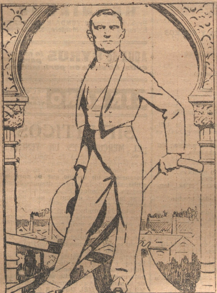
España, tal como la ven en el extranjero los que la consideran un pueblo libre é independiente.