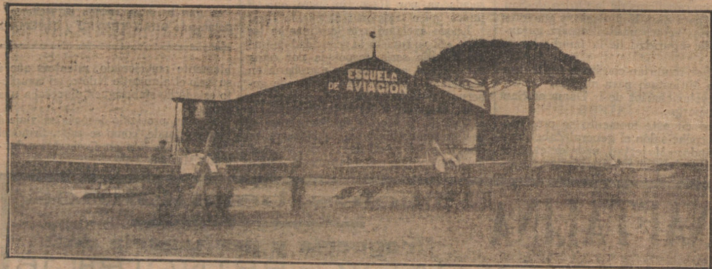
Una escuadrilla de aeroplanos de la Escuela Catalana de Aviación, de Barcelona, en que se preparan estos días varios «breves».