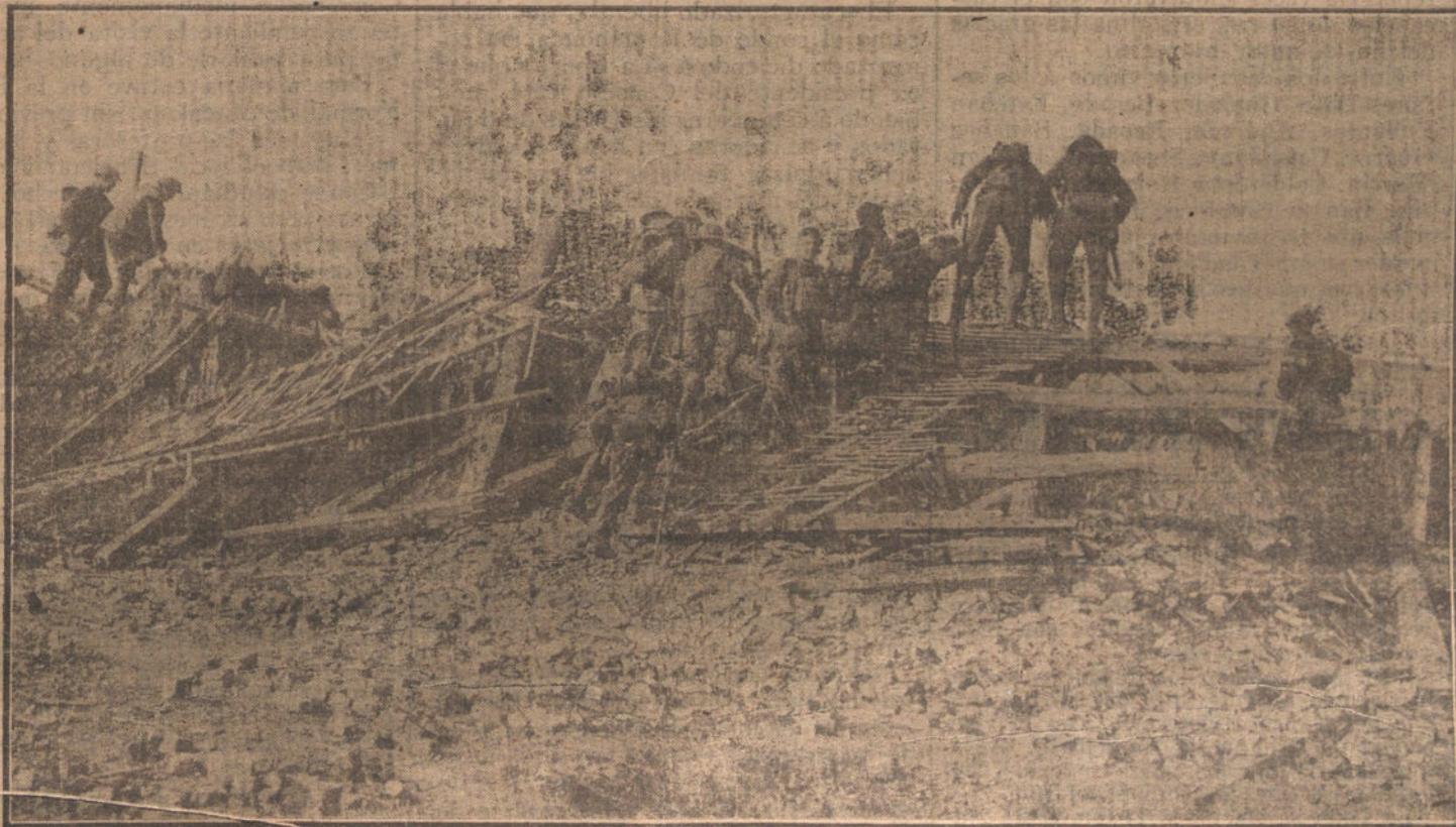
LAS ULTIMAS OPERACIONES EN EL NORTE DE FRANCIA. Soldados ingleses escalando un puente destruido, sobre el Somme, cerca de Peronne.

La opinión ha dado su voto de una manera categórica contra el intervencionismo, y son inútiles para hacerle variar de conducta las absurdas maniobras de dentro y fuera. ¿A título de qué se pretende torcer nuestro camino rectilíneo? Porque miramos á un futuro espléndido, no podemos entretener la vista en esos tratados misteriosos invocados por el conde de Romanones, ni en los artículos de la Prensa francesa. En nuestro solar están las próximas semillas de la cosecha próxima. Cuando llegue el esquileo, no habremos de agradecer á nadie su ayuda, ni avergonzarnos de haber servido intereses ajenos. Lo nuestro será nuestro, muy modesto y humilde si se quiere, pero fabricado con la cultura española, con la industria española, con el arte español, con el dinero español, con el esfuerzo y actividad de una raza que cuando sólo era española dominó al mundo, y cuando se dejó influenciar por Francia é Inglaterra quedó postergada injustamente.