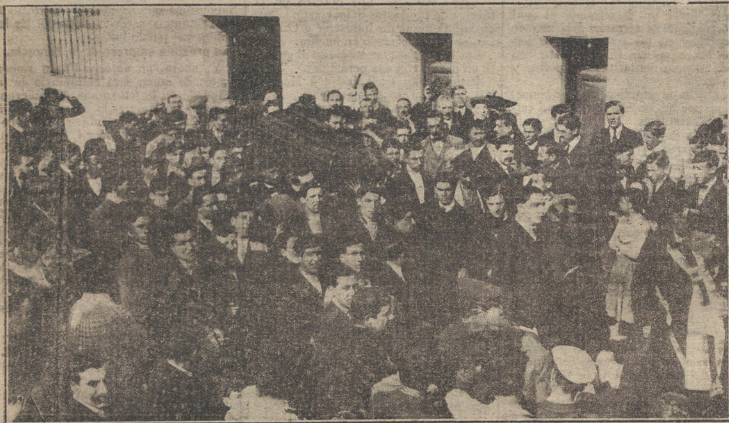
Momento de sacar el féretro de la sala de autopsias del cementerio de San Lorenzo.