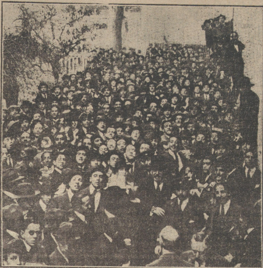
El ministro de Instrucción pública, Sr. Franco Rodríguez, durante la visita girada esta mañana a la Universidad Central.

Recogidos éstos y trasladados a la Clínica de urgencia del barrio de Argüelles, fueron asistidos por los docto-