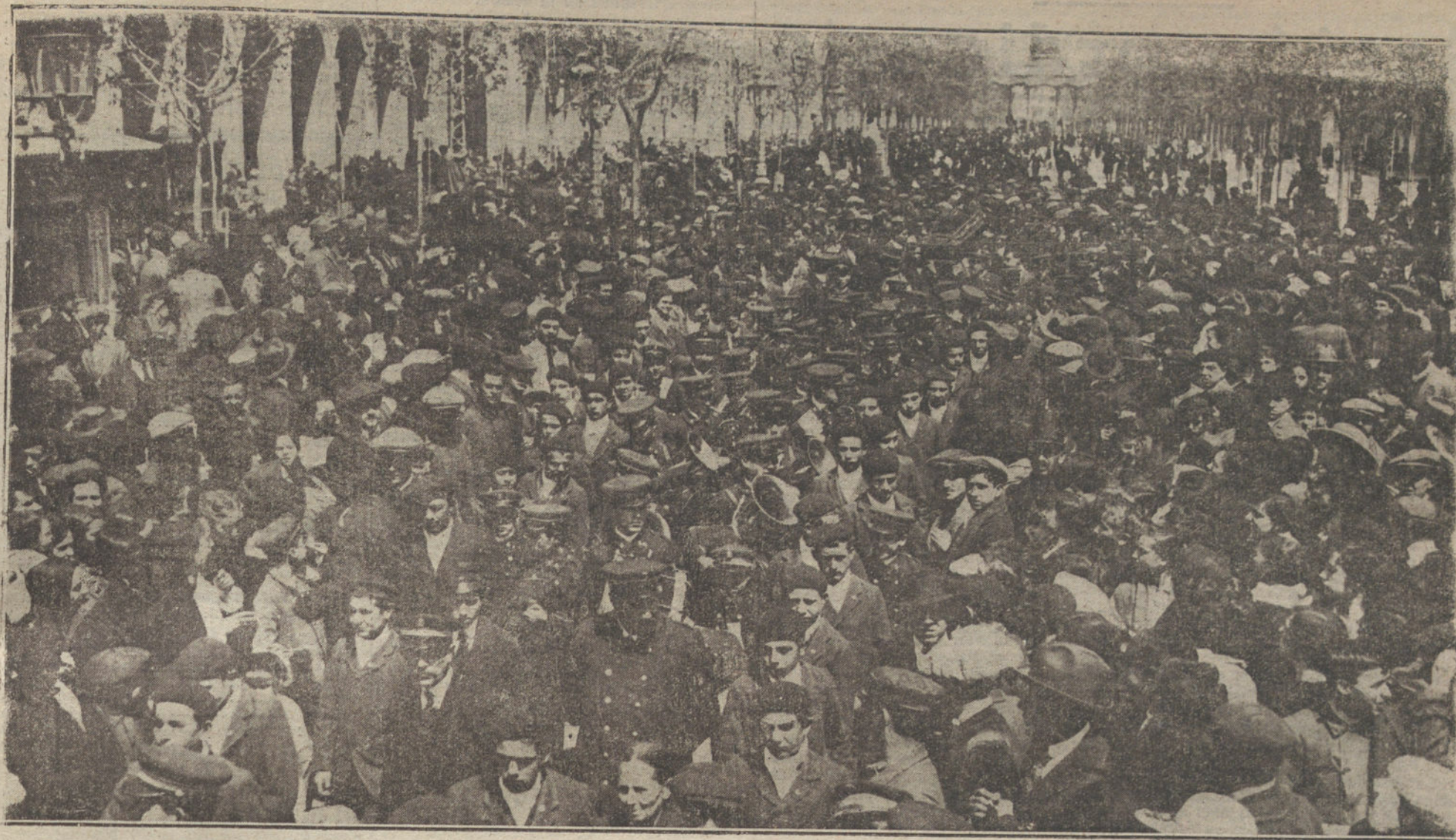
EL ENTIERRO DE BALLESTEROS EN ZARAGOZA.—La imponente manifestación de duelo al cruzar por el paseo de la Independencia. (Fot. VIDAL, enviado especial de LA TRIBUNA)

que siempre existe un personaje que no hace más que tonterías, ó de sentimentales idilios, acaso un poco cursis, en los que la felicidad de dos amantes resplandece al llegar el desenlace.