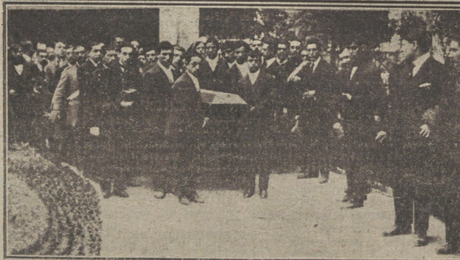
EL ENTIERRO DE BALLESTEROS. Los asilados del Hospicio, en el que estuvo el infortunado torero, al salir para formar en el cortejo fúnebre. Debajo, los asilados trasladando el féretro a la capilla.