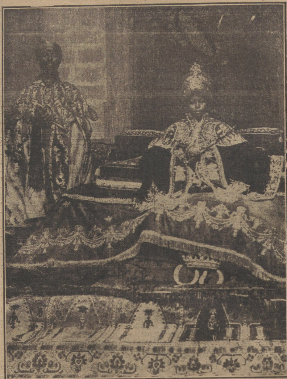
La nueva Emperatriz de Etiopía Zéodriton, casada recientemente con el Príncipe heredero Tafari.