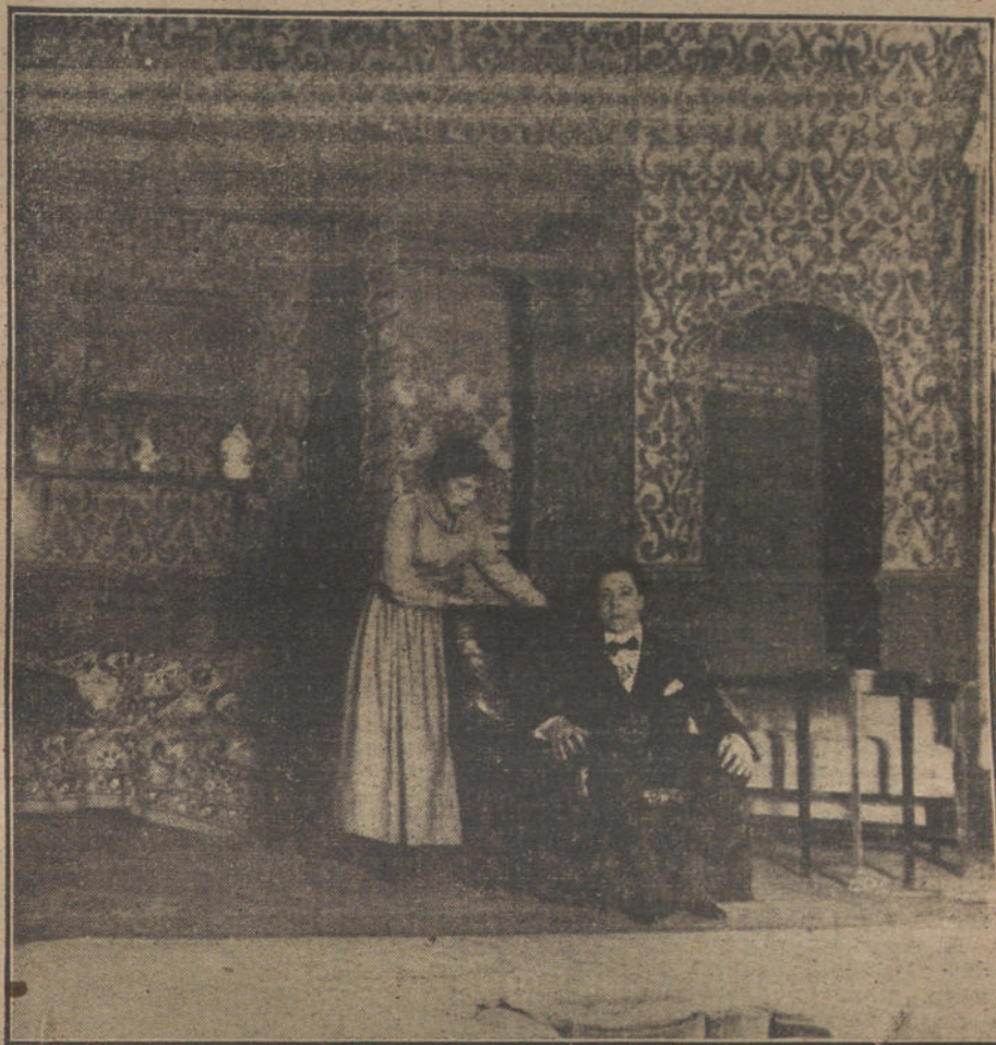
Una escena de «Casa de muñecas», obra estrenada anoche en el teatro de Eslava.

A estas alturas no caben engaños. La alianza con Francia, y «de rechazo» con Inglaterra, nos llevaría á todo, «menos á la paz y al progreso, que he-