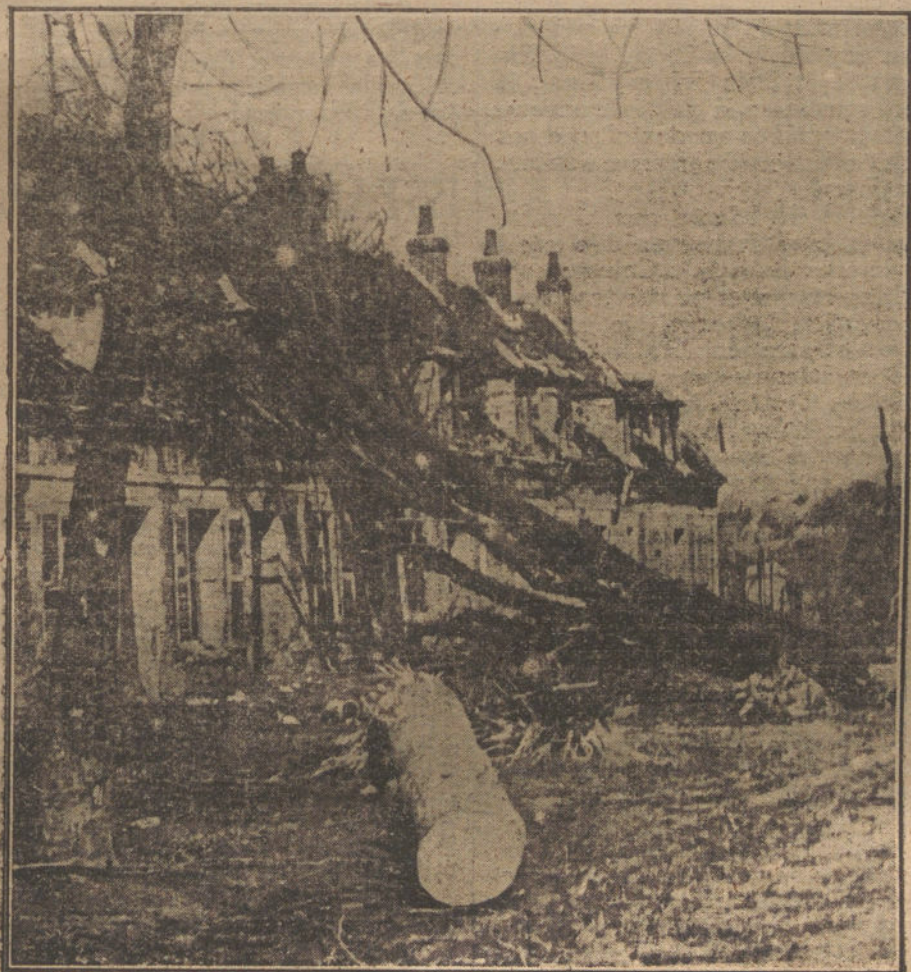
LOS DAÑOS DE LA GUERRA.—Destrozos causados por la guerra en el una localidad del Norte de Francia.

Noticias de Roma acusan mejoría en el estado de la señorita de Villaurrutia.