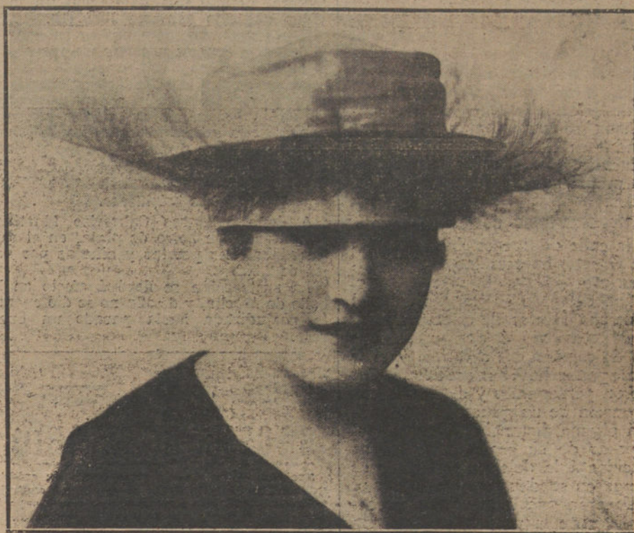
Sombrero de satén blanco, guarnecido de un arco de plumas negras, presentado por la casa «Alice», de París.