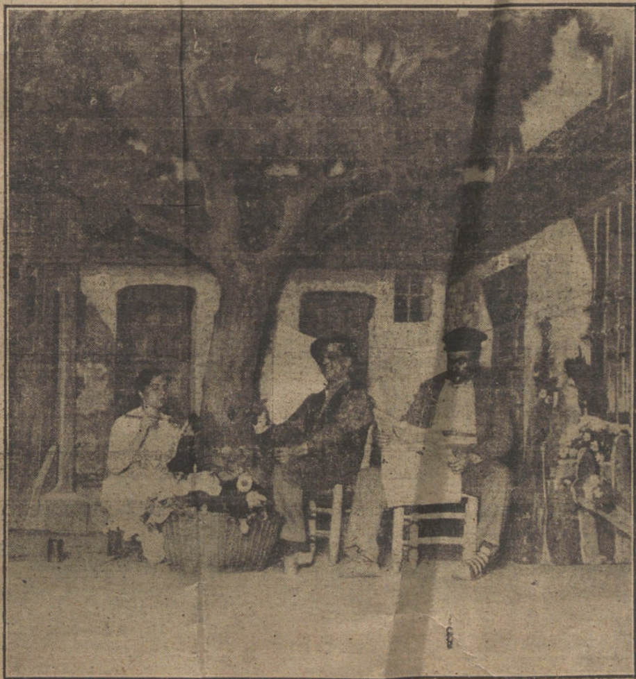
Una escena de «La Peque resulta grande», obra de los Sres. Torres y Asensio, estrenada ayer tarde en el teatro de Eslava.

mos menester para restañar las tremendas heridas del desastre colonial». Los que piensan como Poincaré, buscan, insensatos, el engrandecimiento de su patria, en la guerra de revancha por la Alsacia y Lorena. Nosotros no soñamos ya en Cuba y Filipinas, que, libres, viven felices. «Queremos la paz», y al pretender que termine de un modo ó de otro la aventura de Marruecos, ¿habríamos de consentir que fuéramos la tea de la discordia en Europa? No y mil veces no. «Como republicanos», como patriotas, protestamos de los designios imperialistas del régimen y machacaremos en el yunque hasta hacer penetrar en la conciencia nacional estas verdades y provoquen la protesta que detenga la infamia.