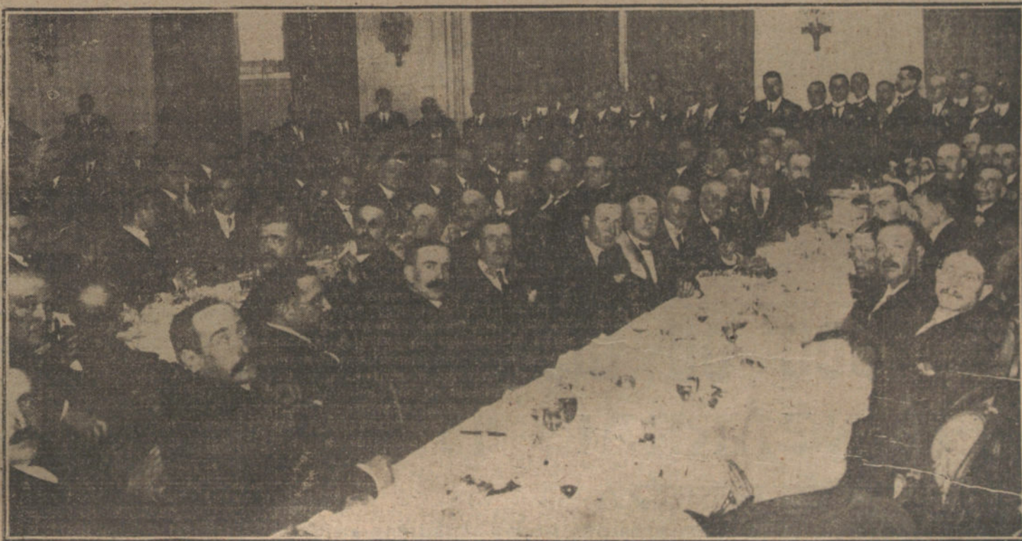
Aspecto del comedor del Ritz durante el banquete celebrado ayer tarde en honor del ministro de la Guerra.

Los pasajeros de tercera y cuarta habían reunido en aquel espacio de su cubierta, protegido por el piso de la cubierta superior y por el muro blanco del castillo central. Allí los más afortunados,