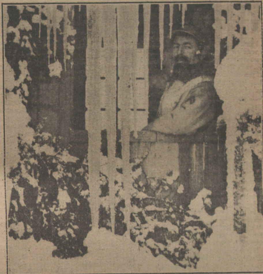
Un puesto de centinelas entre la nieve en el frente de Alsacia.

Por primera vez, después de los pasados desastres, la opinión consciente impone su voluntad, y por primera vez