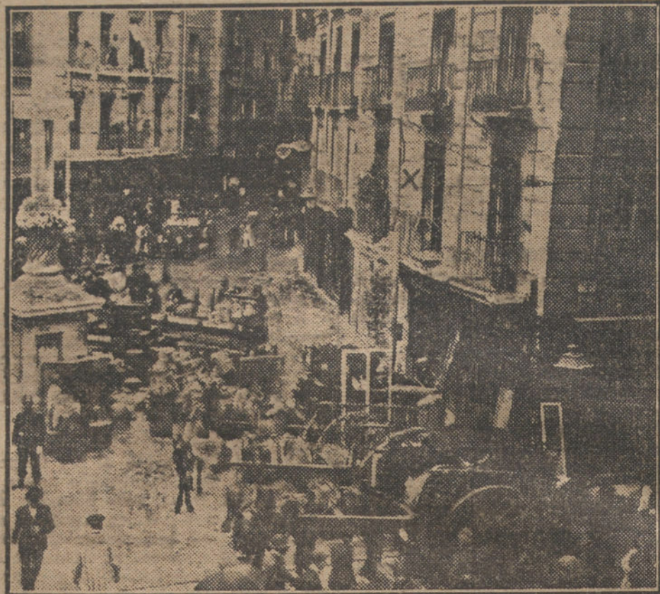
Trabajos del Cuerpo de bomberos para desalojar las casas (X) de Puerta Cerrada que han comenzado á hundirse esta mañana.

Reconocimiento pericial. Peligro inminente. Los bomberos desalojan las viviendas. Cincuenta inquilinos en la calle. Medidas de previsión.