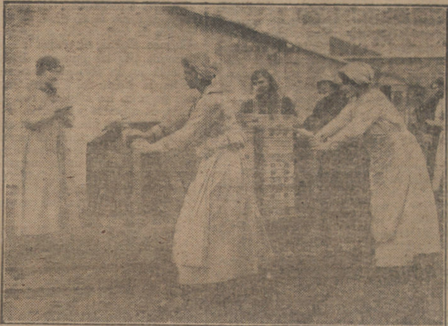
Mujeres francesas trabajando en una fábrica de municiones.

En el frente macedónico, los soldados búlgaros contraatacaron por dos veces unas posiciones que los ingleses ocuparon, tras reñida lucha, tres días ha; también dieron los germanobúlgaros