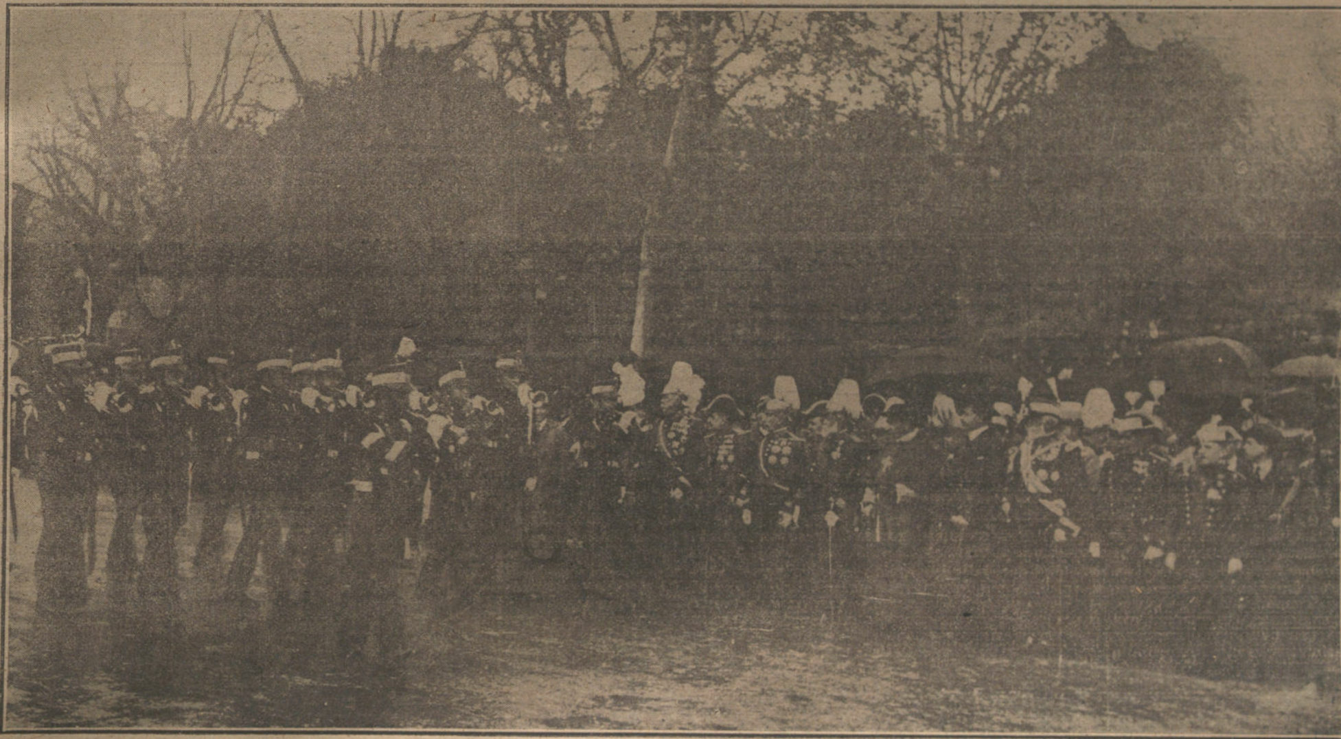
LA FIESTA DEL 2 DE MAYO EN MADRID.—Las fuerzas de Veteranos desfilando ante las autoridades, durante el acto celebrado esta mañana en el paseo del Prado.

BILBAO. Como en años anteriores, se celebra éste la fiesta de la Independencia.