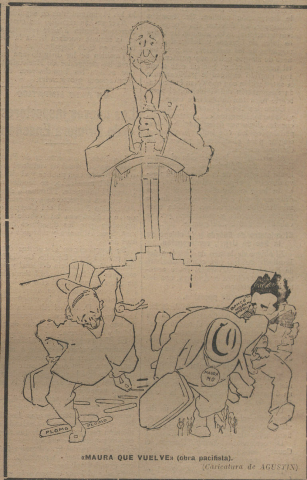
«MAURA QUE VUELVE» (obra pacifista).