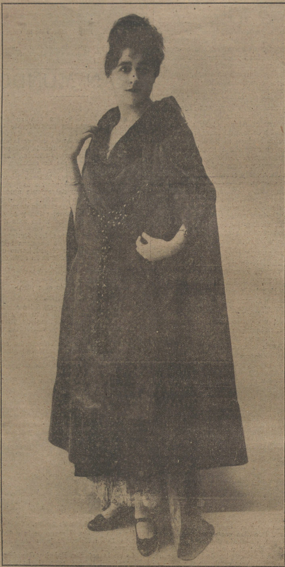
Elegante salida de teatro en brocatel negro con adornos de oro, presentado por la Casa Douillet, de París.

cionando las indicaciones del estado civil facilitadas por el obrero, a fin de que puedan comprobarse debidamente.