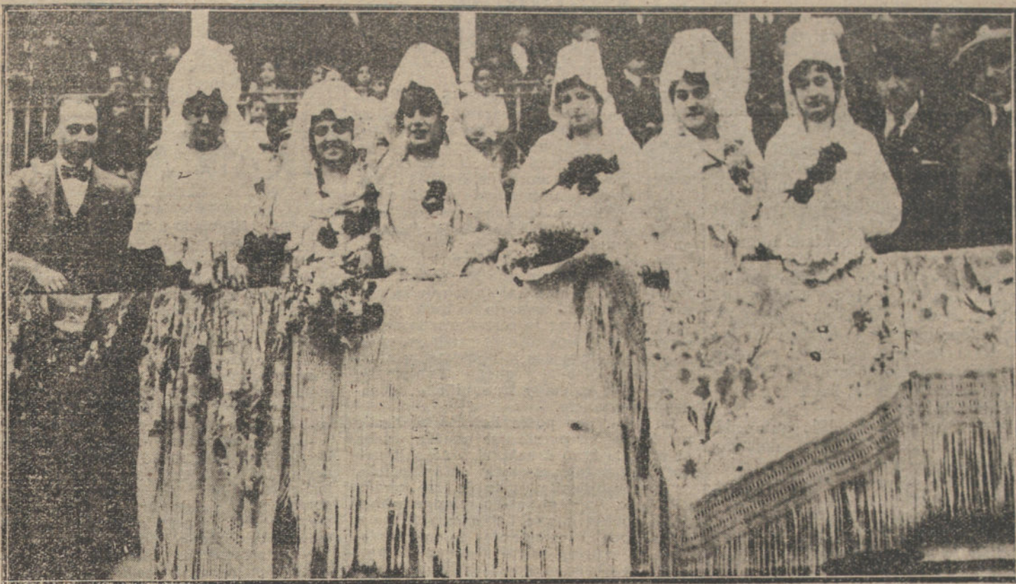
Bellas presidentas de la becerrada de los dependientes de comercio, verificada esta mañana en el circo de la carretera de Aragón.