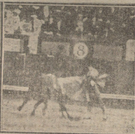
Fortuna toreando de capa al tercer toro.