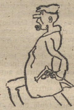
Cocoluche - Por José Lucas - 9 años