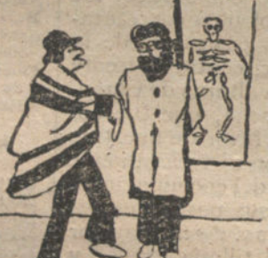
El Doctor: Y Usted ¿Que tiene? El Enfermo: ¡Ay Doctor! Un dolor de muelas muy grande en esta pierna. - Por Salmatón - 12 años