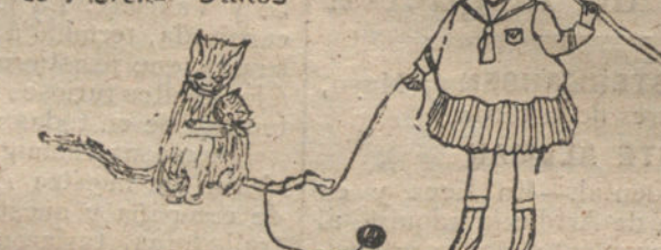
Caso imprevisto - Por Pilar Verdú - 14 años - Yecia