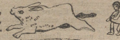
Mi hermanito cazando - Por Gregorio Alonso - 8 años