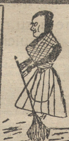
La portera de mi casa barriendo la escalera - Por Elisita Arroyo - 9 años