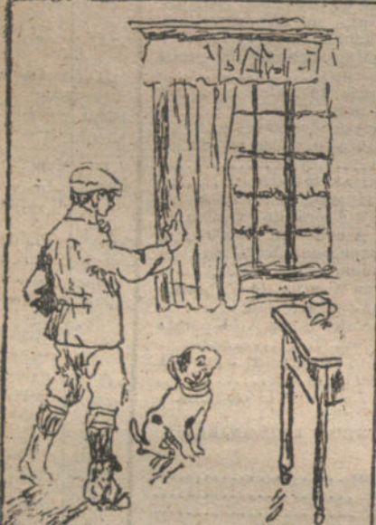
Jomando a mi perro - Por Rafael Martín-Coro Cases - 10 años