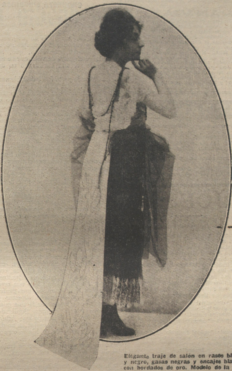
Elegante traje de salón en rasos blanco y negro, gasas negras y encajes blancos con bordados de oro. Modelo de la casa Buzenet.