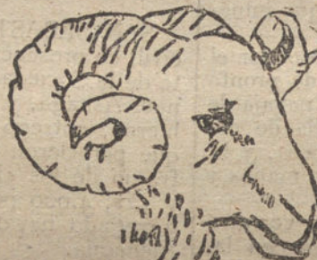
Cabeza de Carnero - Por Luis González Mangado - 9 años