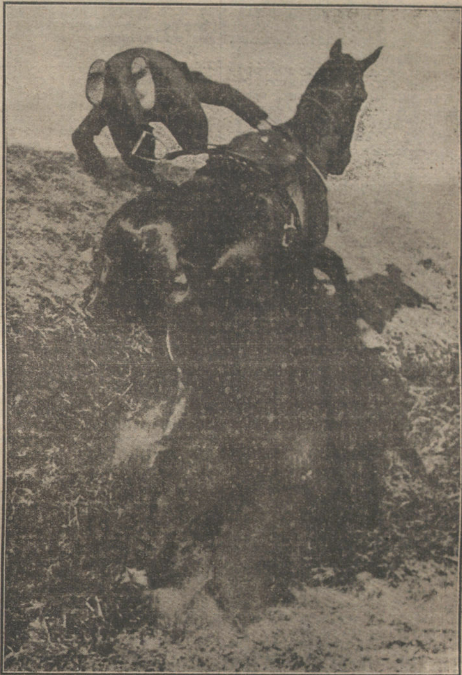
Momento interesante de una caída durante las pruebas del Concurso hipico, celebrado ayer tarde en el Hipódromo.