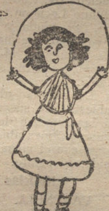
Una niña de mi Colegio jugando a la Comba - Por Elisa Arroyo - 9 años