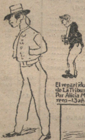
Un maleta - Por Vicente Mayor - 9 años