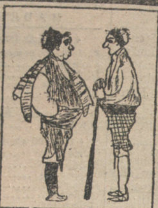
Dos Baturros - Por Pilar Miquel - 9 años