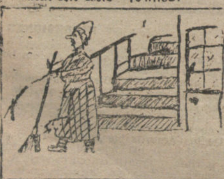
La portera barriendo la escalera - Por María de Córdoba - 10 años