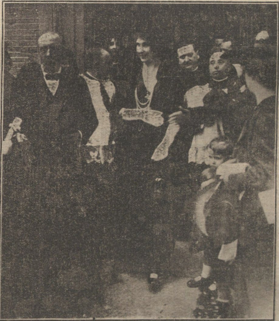
S. M. la Reina Victoria saliendo de visitar el convento de la Encarnación.