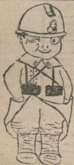
Un soldado Francés - Por Angelita Dolla - 10 años