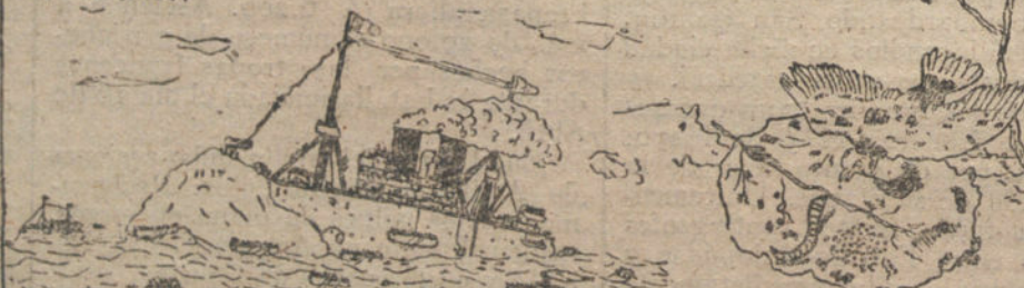
El puerto del "Príncipe de Asturias" - Por Juan Izasaola