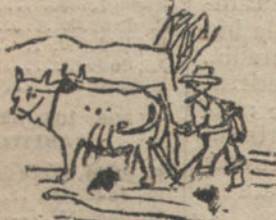
Los animales - Por Miguel Lucas - 17 años