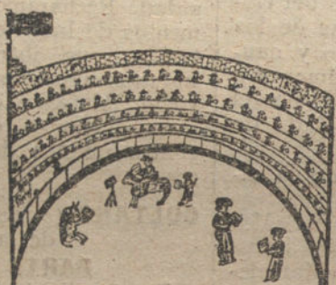
El Reglamento de los Toros en Práctica - Por Alfonso Soto Alcorta - 11 años