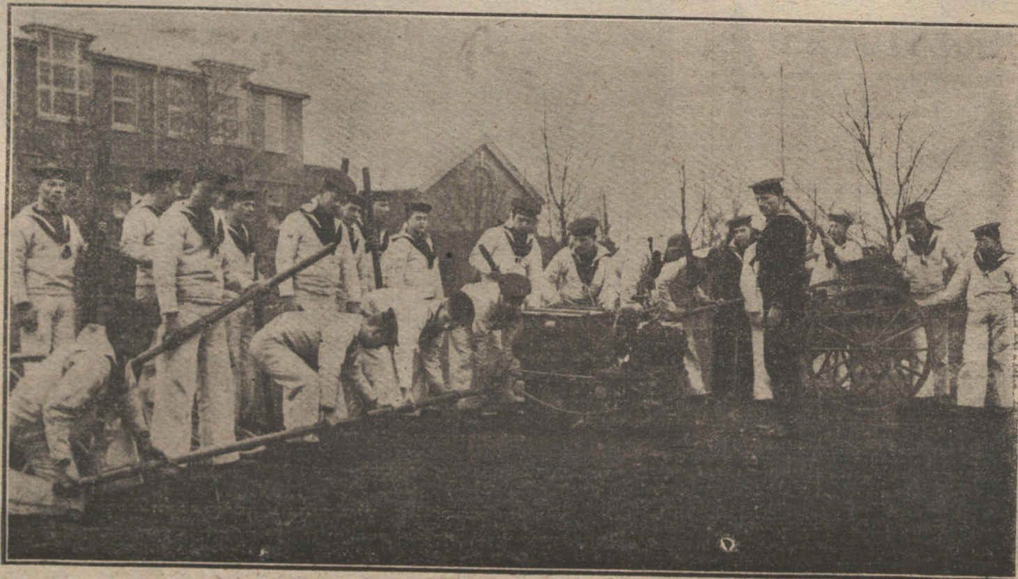
Marinos ingleses montando un servicio radiotelegráfico en la costa belga.

Pero como España, á pesar de los esfuerzos de los servidores de Inglaterra, parece virilmente dispuesta á libertarse de tutelas extrañas y á orientar su política exterior hacia la mayor grandeza de su soberanía, el dominio