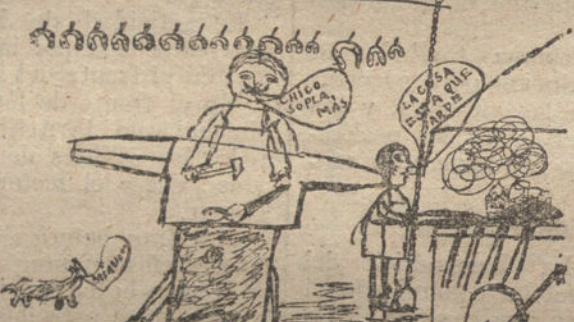
La Fragua de mi tío - Por Antonio Campoamor - 10 años