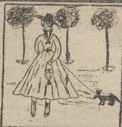
Lulú y su perro - Por Anita Peña - 12 años