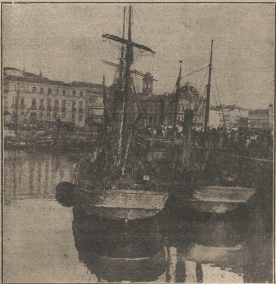
EL INCIDENTE DE LA COSTA FRANCESA.—Llegada al puerto de San Sebastián de los vaporcitos «Nueva Providencia» y «Marciala», que trajeron á los marineros heridos.

preocuparnos de los caminos que vamos á adoptar, de los caminos que vamos á seguir, sino también de los efectos y consecuencias de los pasos que vamos á dar, «porque España no puede colocarse en una actitud tal que pueda rectificar aquella que adoptara desde el primer momento de la guerra». (Grandes aplausos.)