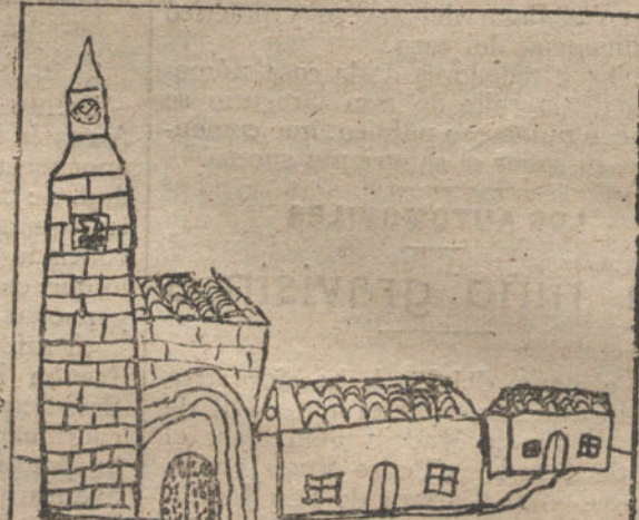
El pueblo de mis abuelitos - Por Pepita Sierra - 6 años - Madrid