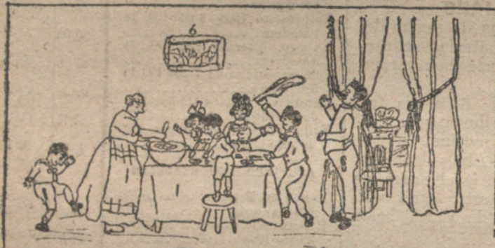
A la hora de la Comida todos en casa se arriman - Por Elvira González - 11 años