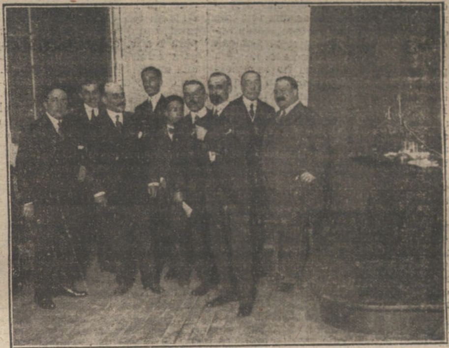
El Sr. Cambó, al terminar la conferencia dada anoche en la Residencia de Estudiantes.

No se diga que no hay recursos para combatir la intrusión. Los comerciantes los tienen en la actitud levantada y enérgica del industrial catalán citado en nuestro artículo de ayer, oponiéndose radicalmente a la sumisión onerosa que le brindaban los ingleses, a cambio de suprimir su nombre de las listas negras.