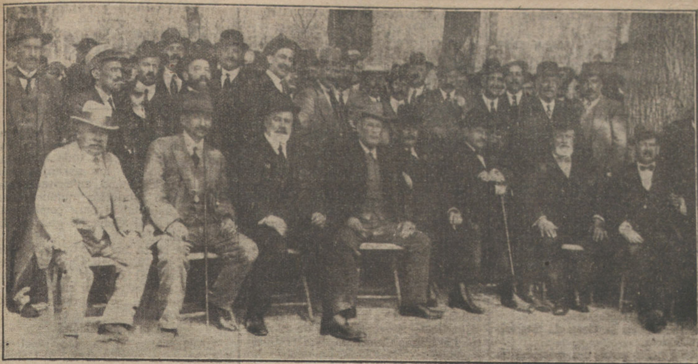
Grupo de asistentes al banquete homenaje a la mesa de la Sociedad de aparejadores de obras, celebrado esta tarde.

La posición quedó firme en manos de los alemanes. Un fuerte ataque enemigo al Oeste de Bremon, a las once de la noche, fué rechazado sangrientamente. Continuó el violento fuego. Importantes columnas enemigas en marcha fueron en la mañana del día 8 cogidas por certeras ráfagas de fuego.