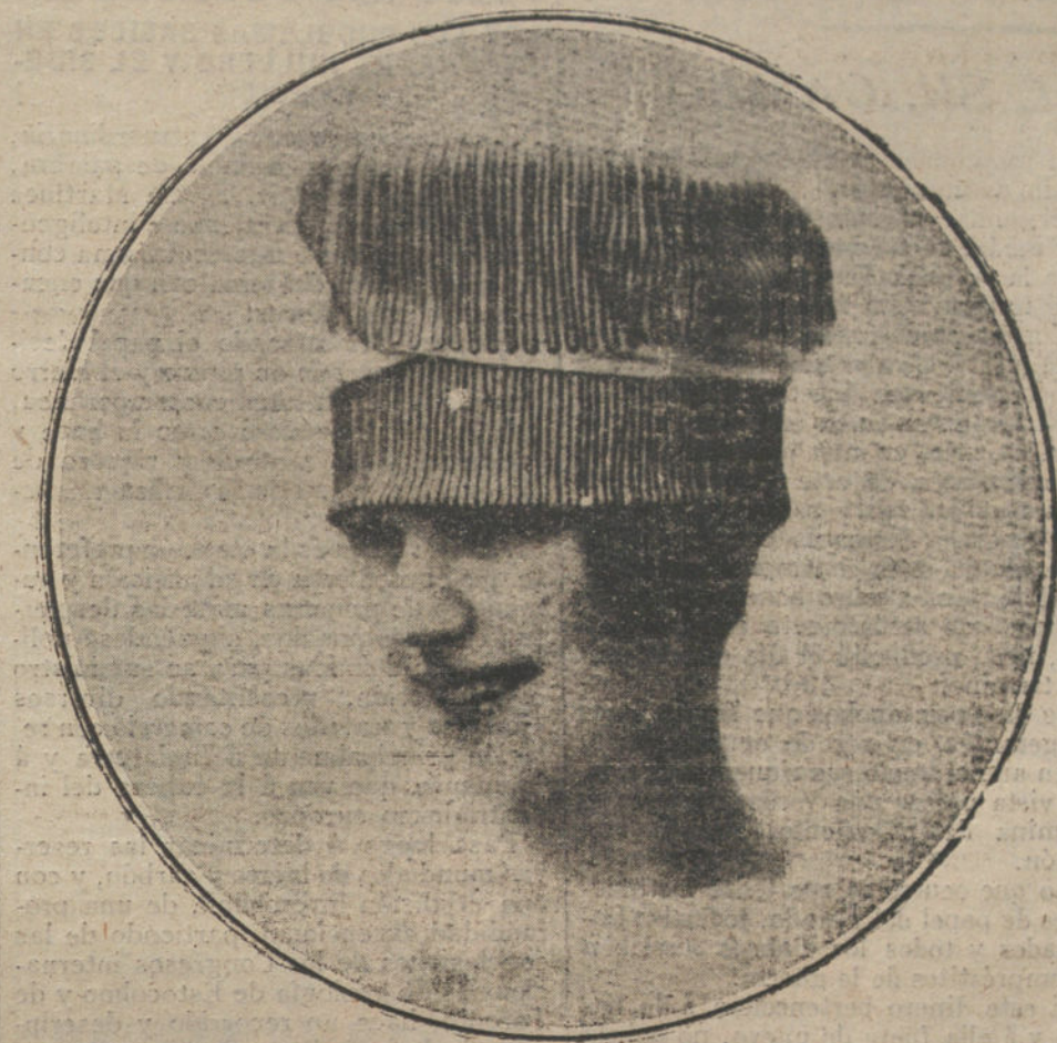
Toca de crepé de China, adornada de galones azul marino, modelo de la Anillo, de París.