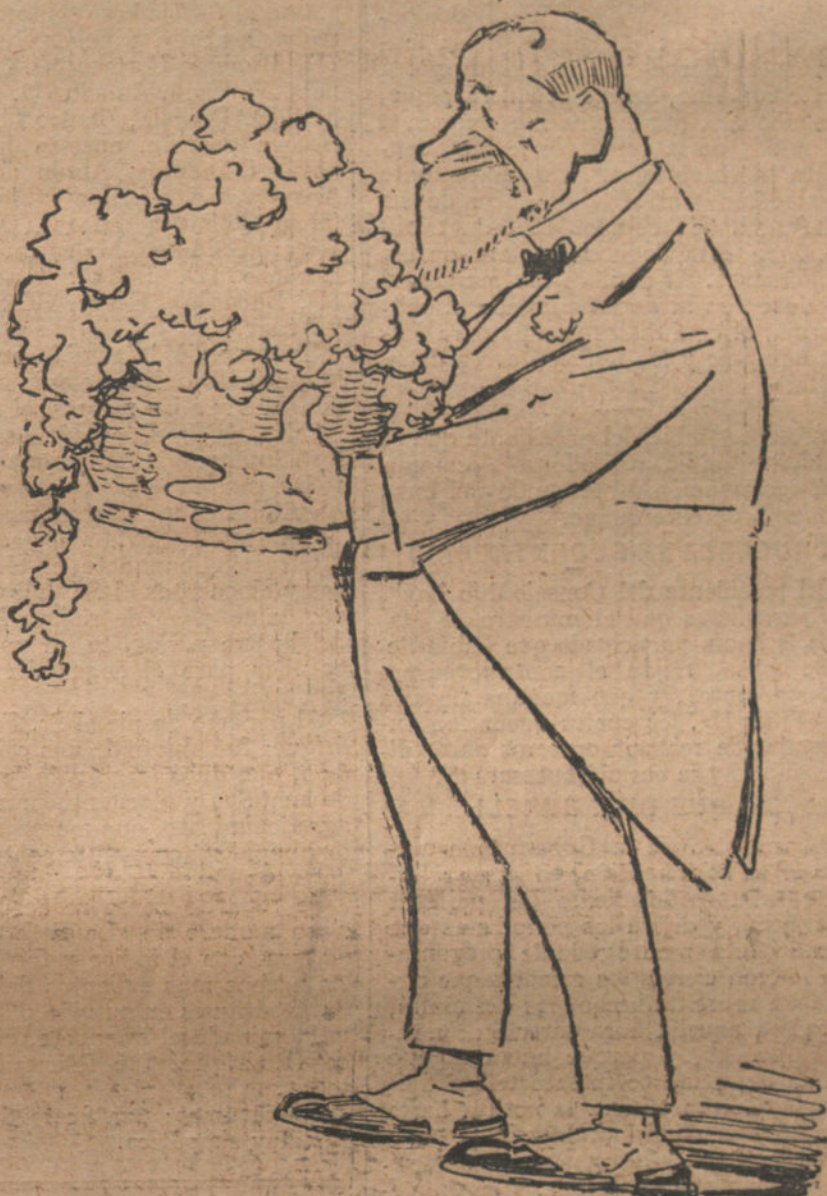
«LA DUDA Y EL MINISTRO» ¿A quién envío las flores? ¿A casa de Romanones ó á casa de García Prieto? (Caricatura de AGUSTIN.)