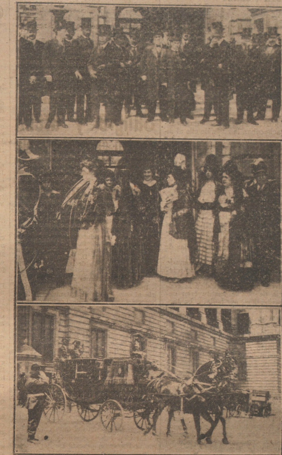
EL DIA EN PALACIO.—La Comisión de Córdoba, acompañada del ministro de Fomento, saliendo de visitar a S. M.—Las damas invitadas al bautizo de la hija de los duques de Medinaceli, saliendo de Palacio.—Carroza que ha conducido a la neófita.

Un modesto periodista provinciano, que forma parte integral de la Comisión cordobesa llegada anoche a Madrid, conocedor de la eficacia que en todos los aspectos de la vida social tiene la cooperación de la gran Prensa madrileña, se atreve, interpretando el sentir de sus compañeros y de Córdoba entera, a suplicar un poco de espacio en las prestigiosas columnas de la aménisima y cordial TRIBUNA, para exponer, en breve síntesis, el objetivo de dicha Comisión, que no es sino intentar de los Po-