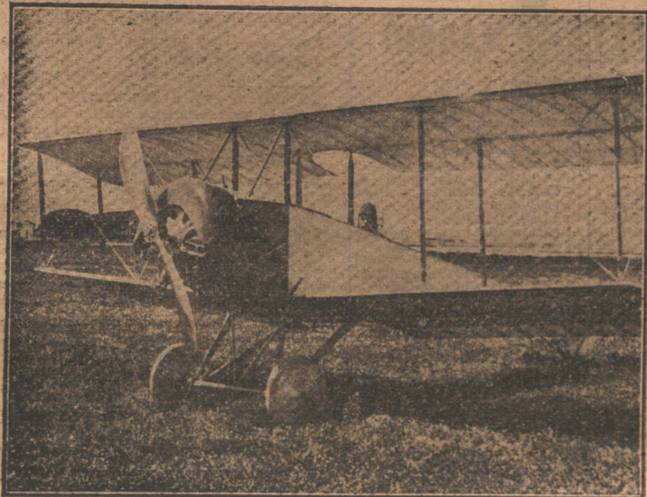
Nuevo aeroplano «Perejo», tipo militar extrarrápido, de construcción española, cuyas pruebas han dado excelentes resultados.

Como patriotas, nos congratulamos del éxito obtenido en estas pruebas, y tributamos al Sr. Perojo el aplauso que merece por sus esfuerzos para emancipar á la industria española de construcción de aeroplanos, de la tutela extranjera.