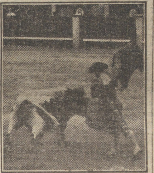
Belmonte en una buena verónica á su primer toro.

Siguen los espectadores sin ponerse de acuerdo respecto á la sanción que merece la faena. Remitimos al paciente lector á las observaciones que hicimos en el prólogo de estas ligeras notas respecto á la clientela de hoy.