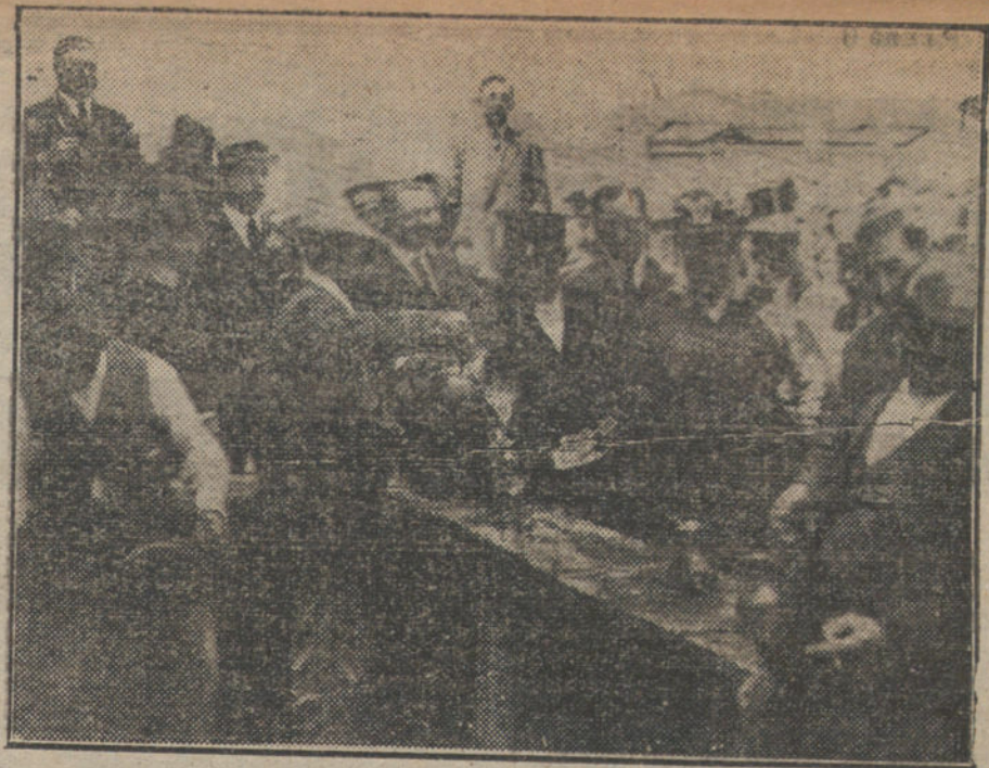
EN LA PRADERA DE SAN ISIDRO. — S. A. la Infanta Isabel, bebiendo agua de la fuente del Santo.

Durante todo el primer tercio persiste el mitin antibelmontino. Ya te tra-