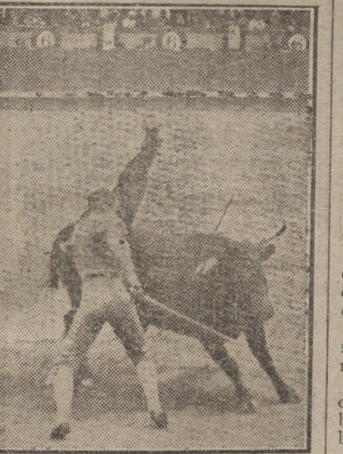
Joselito pasando de muleta.

Pepito se pone de rodillas en el tercio y quiebra, imitando al autor de sus