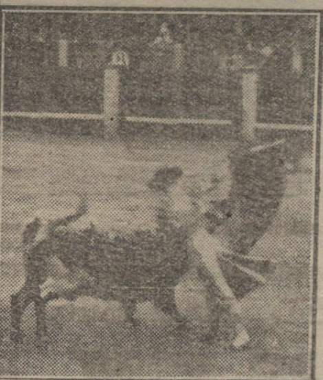
Salieri II lanceando al tercer toro.

DESPACHO EN LA CALLE DEL POZO. EMPRESA DE TOROS DE MADRID.