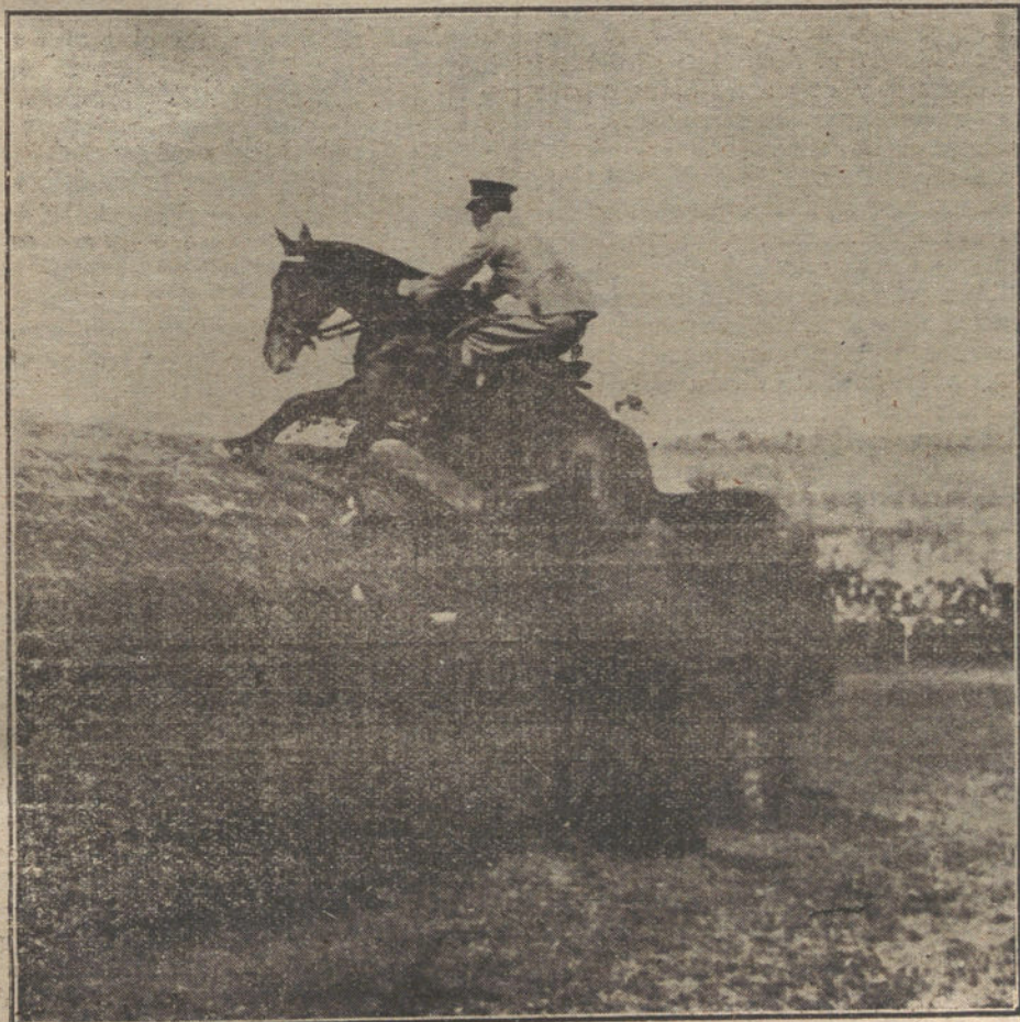
Un bonito salto de la banqueta, en el Concurso hipico celebrado en Madrid.

El árbitro, á satisfacción de todos, haciendo honor á su merecida fama.»