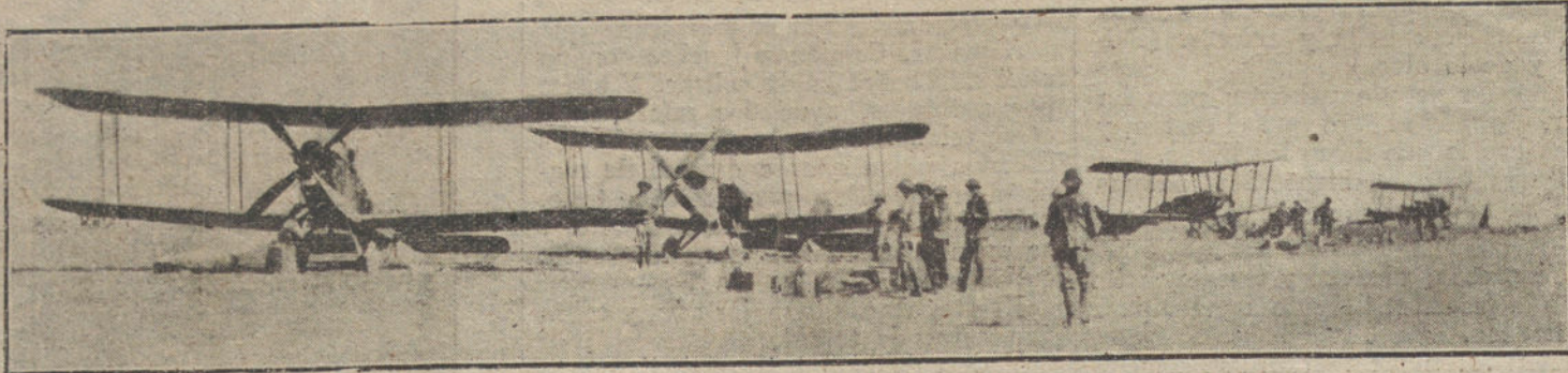
LA AVIACION EN LA GUERRA.—Aeroplanos ingleses preparados para un vuelo sobre las líneas enemigas.

Debieran considerar estos juveniles é impetuosos motoristas que para las