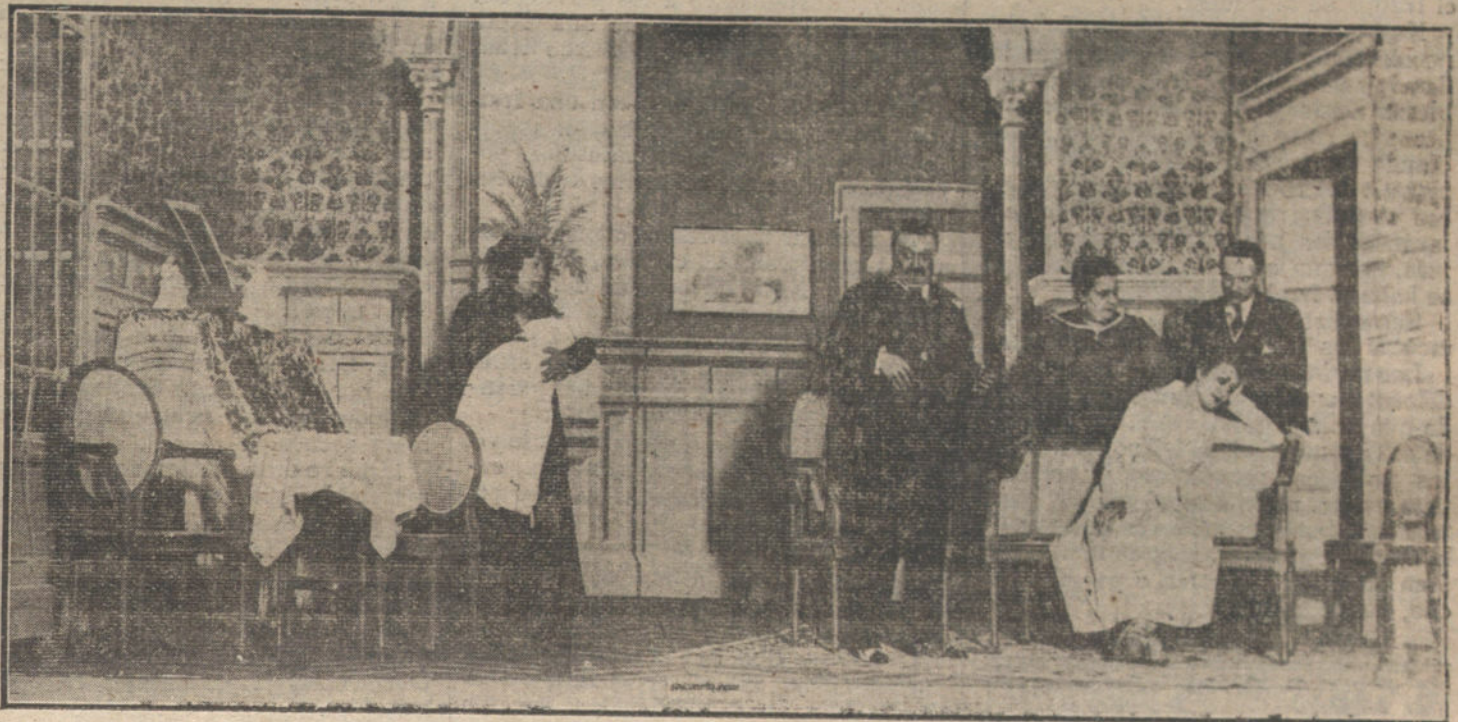
Una escena de «La gentil Mariana», obra estrenada anoche en el teatro de Estava.

Allí no se les ha ocurrido llevar a la Presidencia del «Board of Education», por ejemplo, a un cacique enredador y travieso, o conturbio de boxeadores; fué nombrado el doctor Fischer,